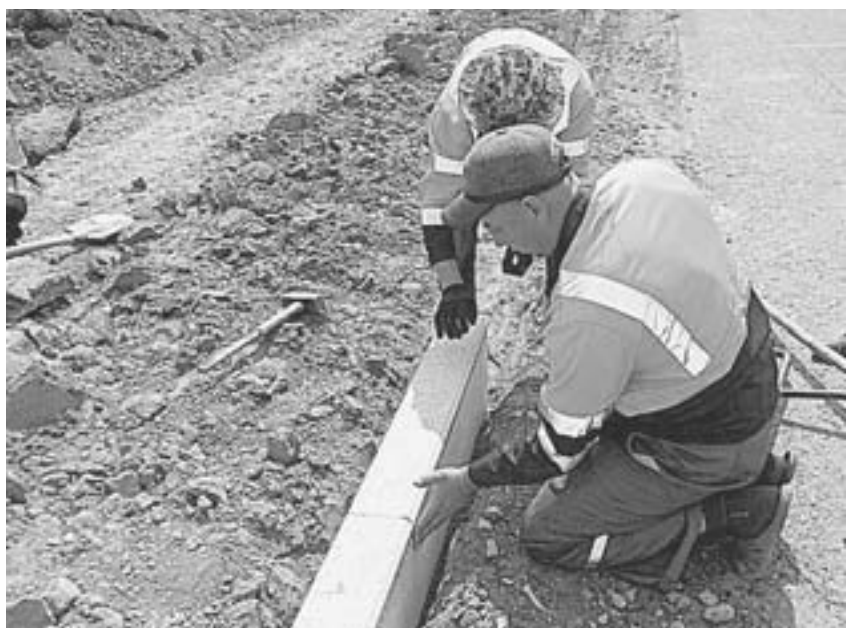
В населенных пунктах укладывают бордюрный камень.

В Юго-Западном ДСУ в головном предприятии трудятся около 220 человек. Есть и династии, и люди, отработавшие по 20 – 30 лет. Машинисты асфальтоукладчиков, машинисты катков, автогрейдеристы – это те специалисты, без которых дорожной отрасли невозможно существовать. От их умения в конечном счете зависит качество дорог. Мало иметь