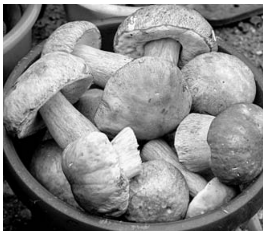
Белый гриб ценится выше других.

– У нас есть закон о пищевых лесных ресурсах, в соответствии с которым граждане могут собирать себе грибы и ягоды сколько угодно для собственных нужд. Но поскольку критериев нет, получается: все, что собираешь, все