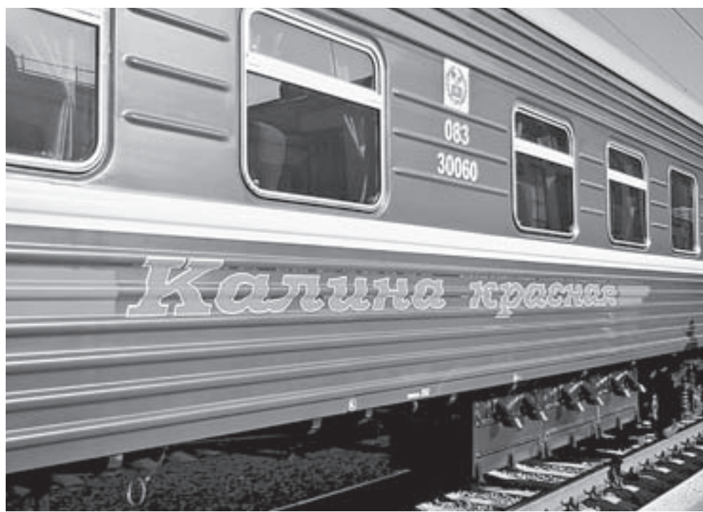
«Калина красная» уже давно стала визитной карточкой Алтайского края.

Четыре современных вагона закупят для поездов «Калина красная», «Восток» и «Просторы Алтай».