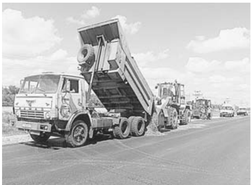
При ремонте используются новые фракции щебня.

Предприятие располагает большим современным парком техники, который значительно обновился за последние два года благодаря под-