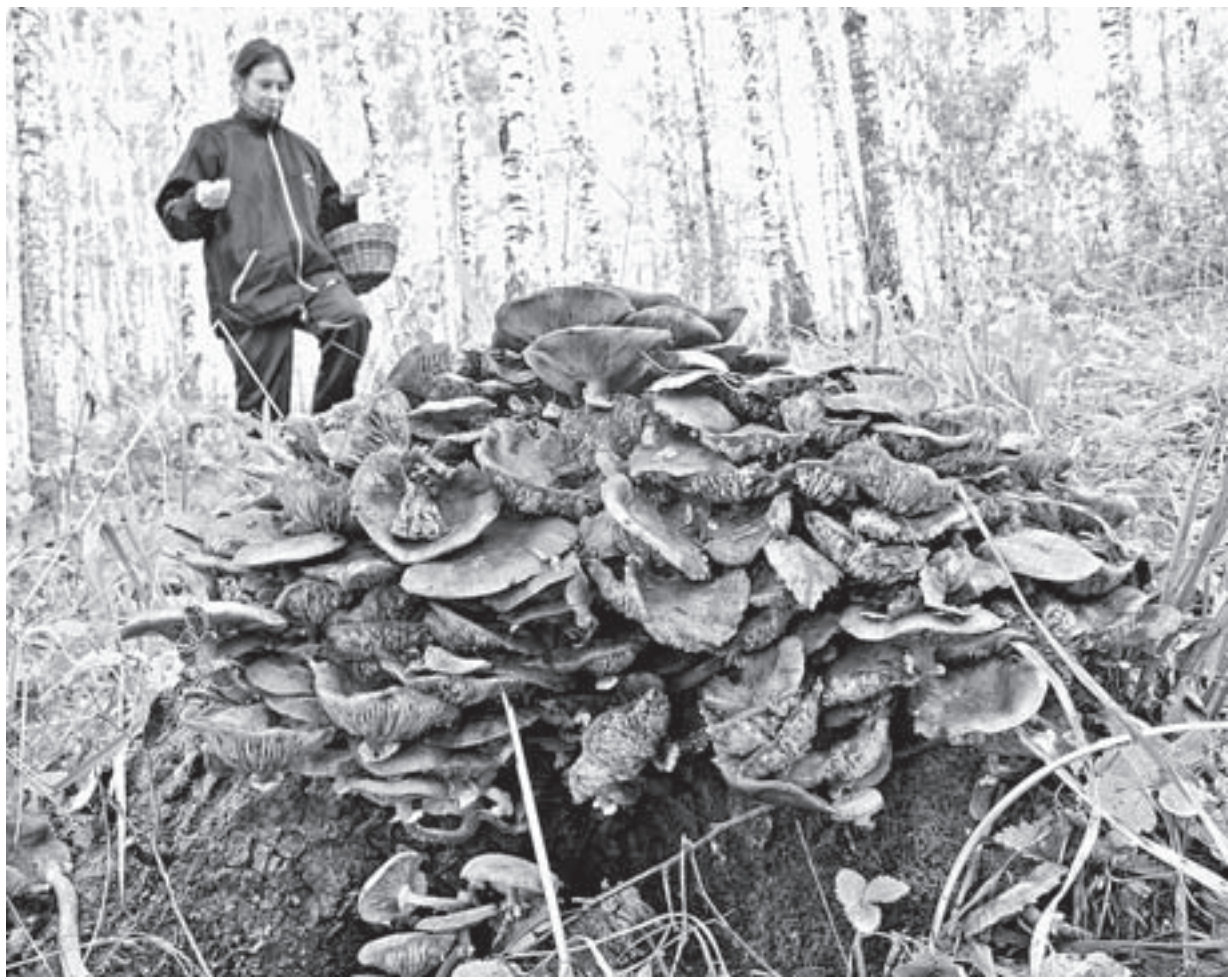
Грибники ожидают большого сезона.

– Конечно, к белому есть требования. Мы учтем, что алтайский гриб практически весь червивый. Нечервивый пускается в заморозку или солено-отварную продукцию. Червивый идет в сушку. Обязательно требуется, чтобы гриб был очищенный и рассортированный. Это зависит от цвета нижней поверхности шляпки: кремневая – 1 сорт, желтая – вторая, зеленая – третий. От этого зависит цена. Но многие жители заводят сушилки и предпочитают сдавать уже сушеные грибы (точно так же рассортированные). Стоимость их значительно выше, – рассказала предприниматель.