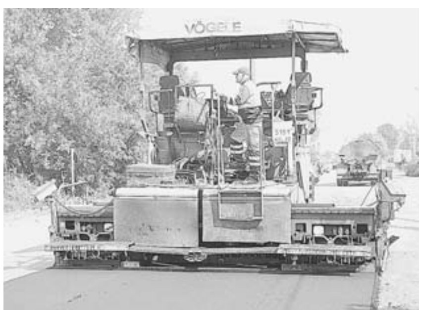
Парк Юго-Западного ДСУ значительно обновился.

современный материал, нужно его правильно положить.