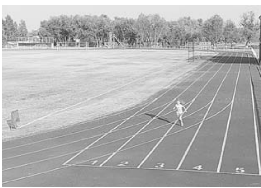
Теперь в Завьялово есть где разбегаться.

Кроме того, на стадионе с нуля построены по две игровые площадки для классического и пляжного волейбола, баскетбола, городского спорта. Рядом расположились новые душевые и туалеты. Со стадиона открывается красивый вид на озеро,