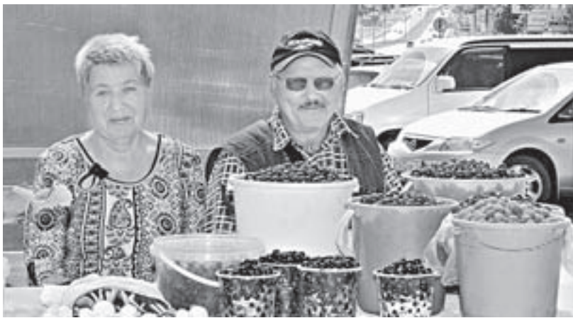
А вот торговлю продукцией со своего ЛПХ закон никак не ограничивает.

Однако есть одна проблема, которую вынуждены обходить любители грибных заработков не один год. Лесной кодекс, принятый около 10 лет назад и действующий сегодня на территории Российской Федерации,