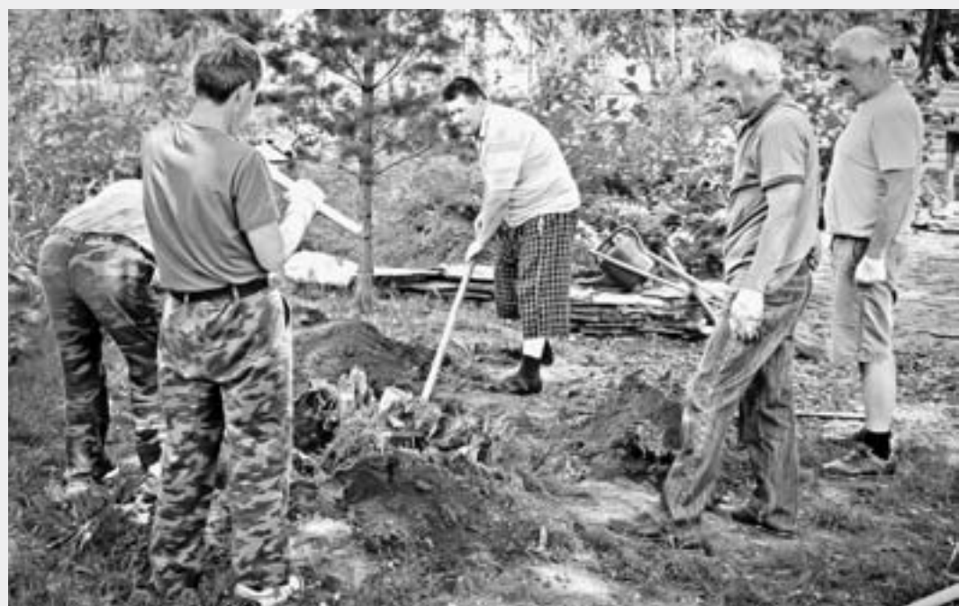
Обустройство сквера идет полным ходом.

В Барнауле ветераны краевого студенческого отряда «Алтай» делают семейный сквер.