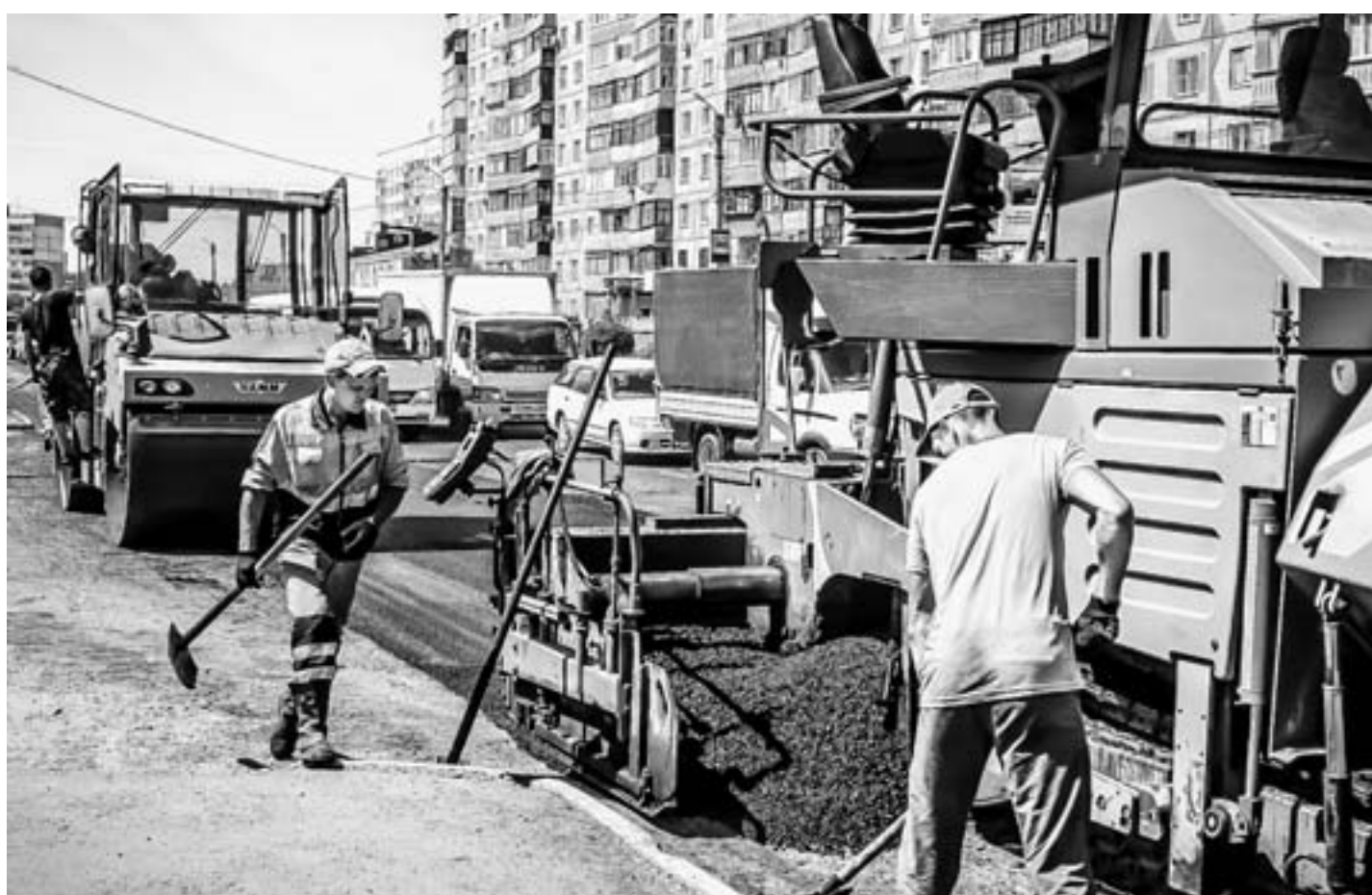
На ремонт дорог в Бийске дополнительно выделено еще 80 млн рублей.

Глава региона напомнил, что по этому показателю Алтайский край находится на последнем месте в Сибири и занимает предпоследнюю позицию в стране. По итогам 2017 года средняя зарплата в регионе не дотягивает до 23 тысяч рублей, в то время как у наших соседей-регионов эти параметры в полтора, а то и в два раза выше. А между тем к средней заработной плате, по словам Виктора Томенко, привязана зарплата сотен тысяч бюджетников.