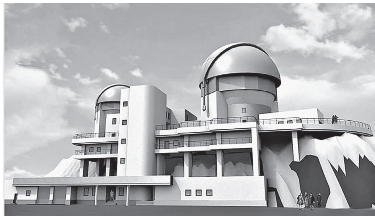
С 2004 года работает Алтайский оптико-лазерный центр.