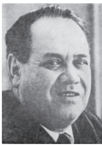
Одно из самых известных произведений писателя Петра Бородкина - «Тайны Змеиной горы».

12 июля исполняется 100 лет со дня рождения выдающегося писателя-земляка Петра Бородкина.