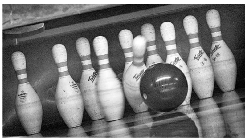
Участники заворачивали сериями сношибательных страйков.