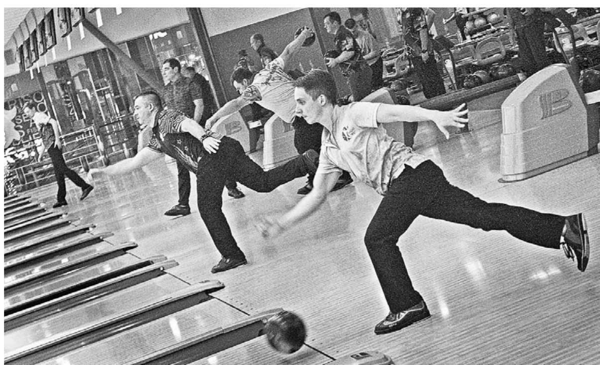
Кубок страны собрал элиту российского боулинга.

Представители Алтайского края на домашнем турнире не затерялись в солидной компании приехавших мастеров, завоевав четыре золотые, одну серебряную и одну бронзовую медали. Всё это позволило нашей сборной занять первое место в общекомандном зачёте,