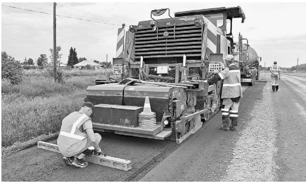
Дорога должна быть прочной.

К обновлению 13 км региональной трассы Калманка – Новороманово – Лебяжье подрядная организация Центральное ДСУ приступила в мае. Дорога была в ужасном состоянии, между тем по ней день и ночь непрерывно идут автомобили, среди которых много тяжелых грузовиков. Поэтому проектировщики решили сделать два слоя асфальтобетона. Вначале рабочие срезали старый асфальт, а потом, смешав его со свежим связующим, укладывали вновь на дорогу. Сверху покрыли слоем нового асфальтобетона. Эта технология холодной регенерации позволяет, с одной стороны, сэкономить средства, с другой – добиться удовлетворительного качества полотна. В прошлом году,