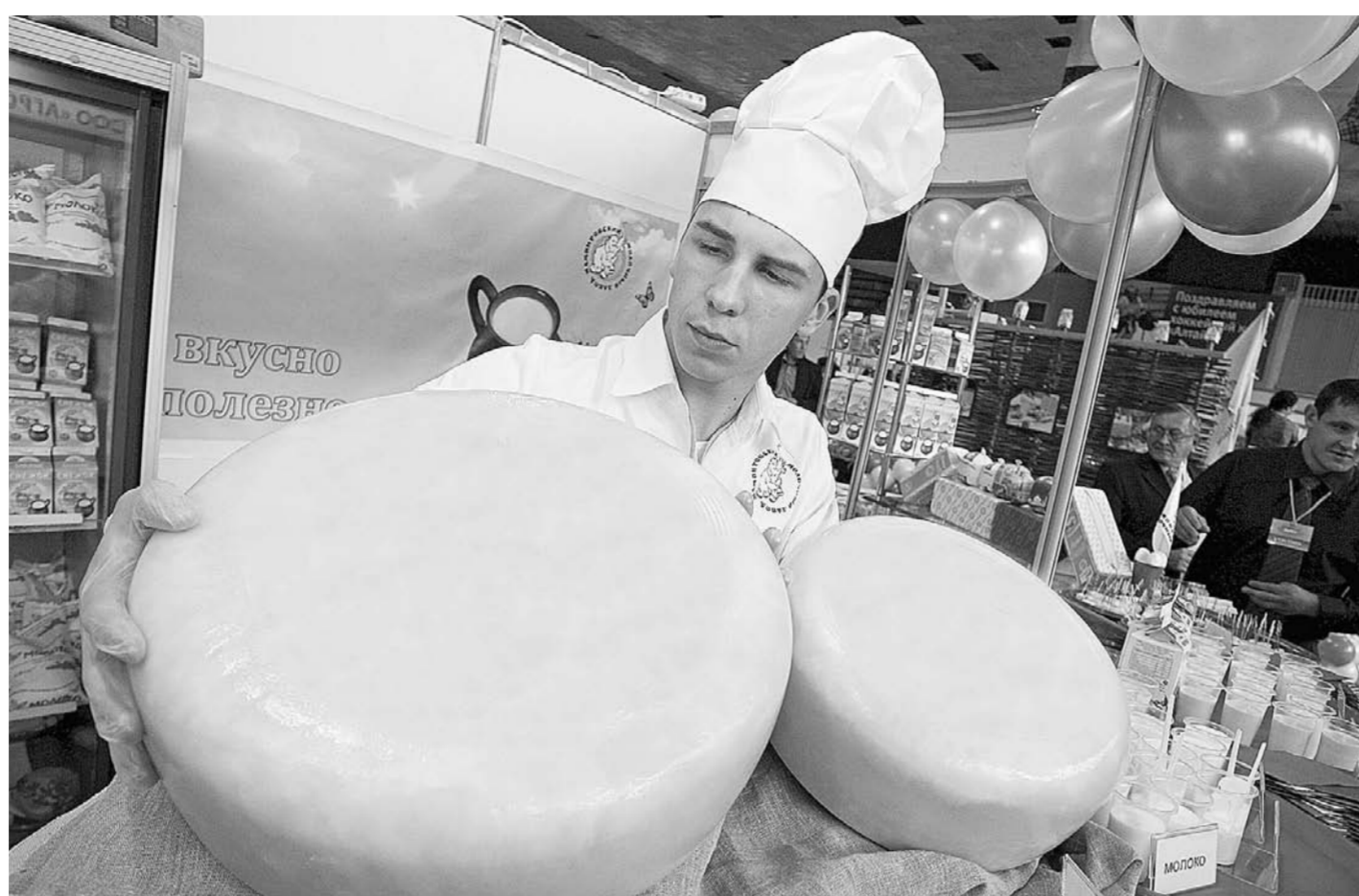
Рынок молочных продуктов в Алтайском крае – в числе приоритетных.

— Мы стартуем не с чистого листа. В регионе определены два приоритетных рынка – туристических услуг и молочных продуктов и одиннадцать социально значимых рынков, на которых предоставляется широкий спектр востребованных населением услуг. Реализация разработанной «дорожной карты» позволяет проводить оптимизацию процедур государственных закупок, устранение избыточного государственного