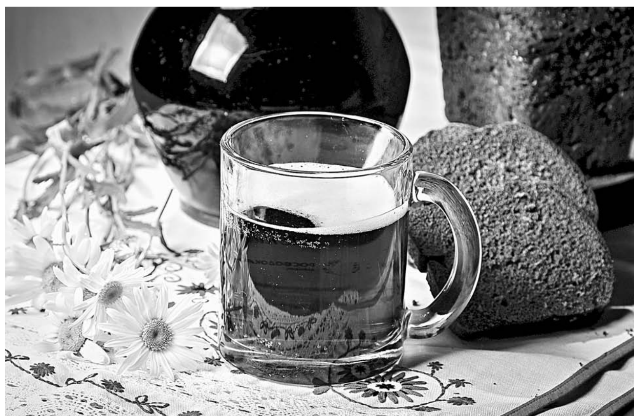
Квас любят и взрослые, и дети.

Квас, пожалуй, самый популярный летний напиток. Его любят дети и взрослые. Каждая хозяйка знает секрет приготовления своего особенного кваса. А мы побывали на одном из крупнейших предприятий Барнаула и посмотрели, как готовится квас в промышленных условиях.