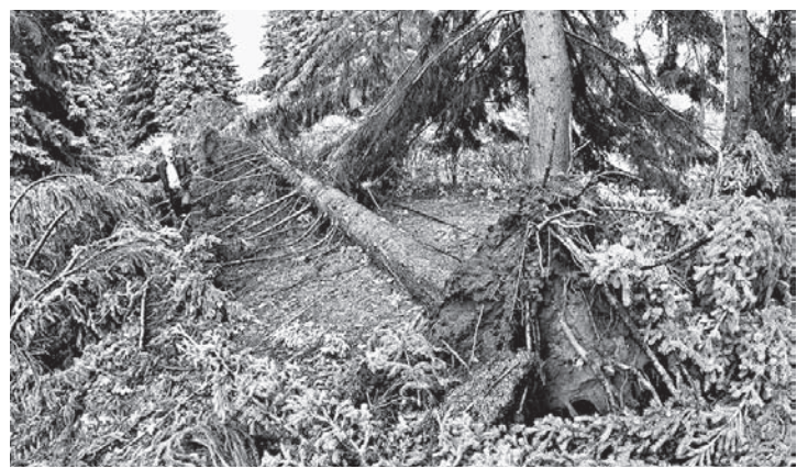
Стихия нанесла немалый урон биосоюзу дендрария, уничтожила ценные виды деревьев.