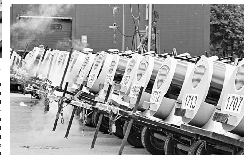
Обработанные бочки ждут заливки продукта.

вы с каждой бочки. Кстати, и изготовлены они в соответствии со всеми требованиями – предназначены для хранения и перевозки пищевых продуктов, к ним предъявляются особые требования к внутренней поверхности и швам, которые должны быть гладкими, шероховатости недопустимы, в противном случае такую бочку не удастся качественно вымыть.