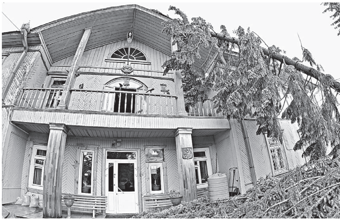
Ель, сраженная ураганом у одного из корпусов НИИ садоводства им. М. А. Лисавенко.