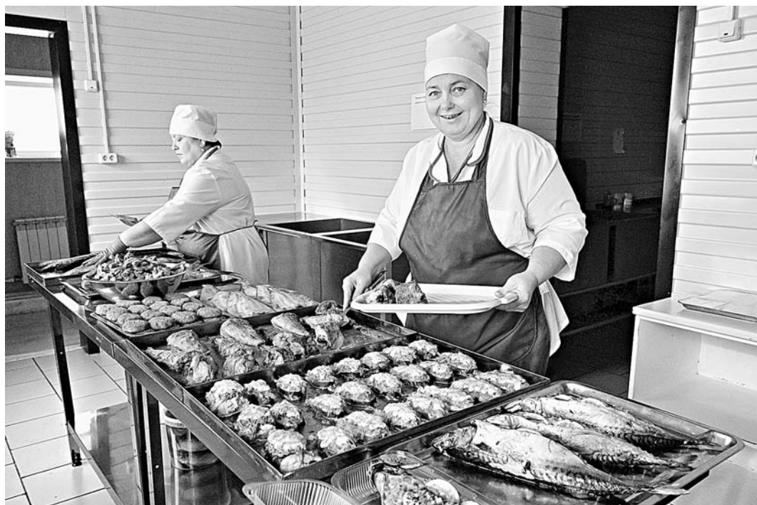
Алтайские кооператоры делают акцент на увеличение в ассортименте доли продукции собственного производства.