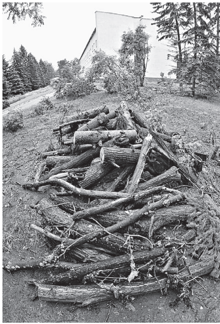
Очередная партия древесных отходов готова к отправке на участок временной утилизации.