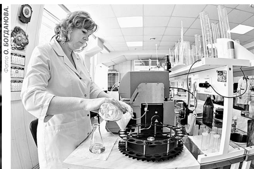
В химической лаборатории определяют качество напитка.

Идем по производству. Цельный ряд бочек ждет своей очереди. Они обработаны специальным образом – выдолбаны, промыты моющими растворами, а затем чистой водой, простерилизованы паром. За качеством мойки следит лаборатория, специалисты регулярно берут смы-