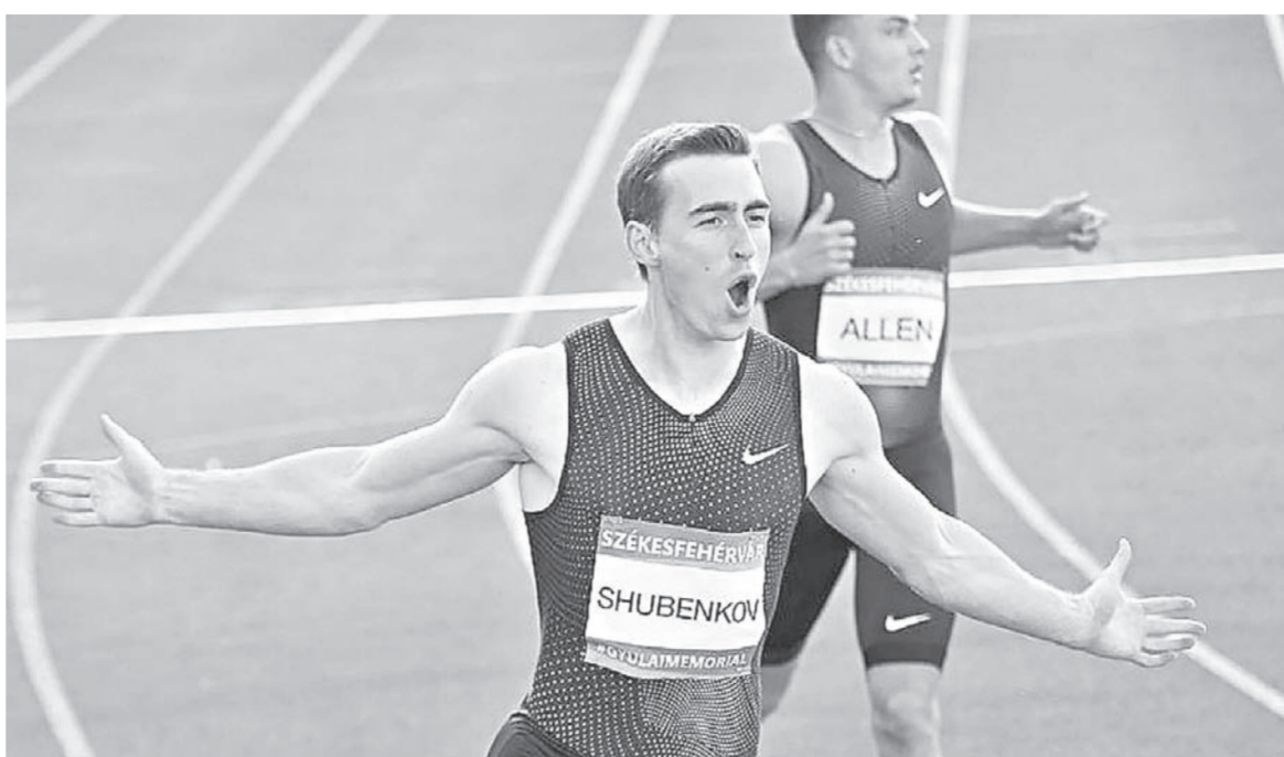
Шубенков обновил не только национальный рекорд, но и лучший результат сезона в мире!

Предыдущий рекорд России на дистанции 110 метров с барьерами равнялся 12,98 сек. и был установлен Шубенковым в финале чемпионата мира в Пекине в 2015 году, где он одержал триумфальную победу. Лидер российской команды по лёгкой атлетике переписал не только национальный рекорд, но и лучший результат текущего сезона в мире. Кроме того, его время – второе в истории среди европейских атлетов.