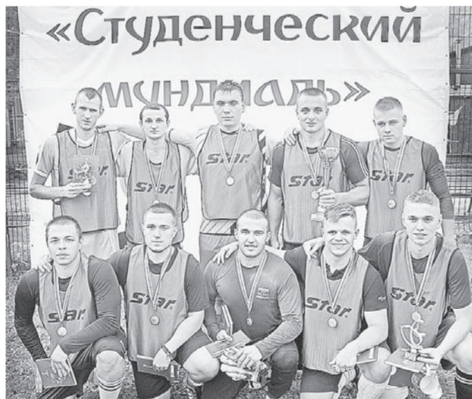
Золотые медали достались «Ахмату».