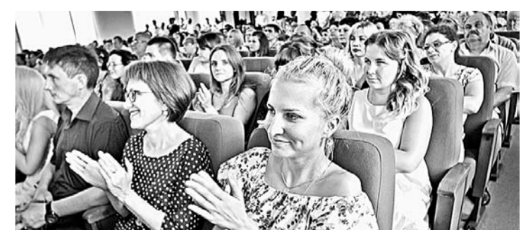
(Начало на 1 стр.)

Сейчас мы ведем обработку полей. Это будет мой первый урожай.