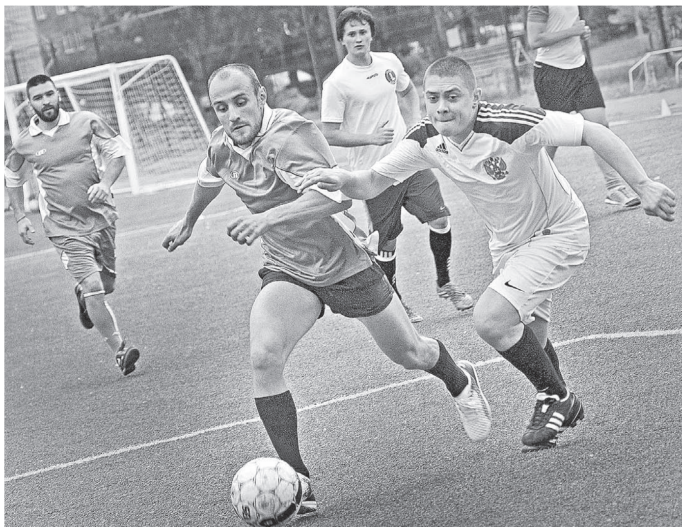
В финале, как говорится, нашла коса на камень.