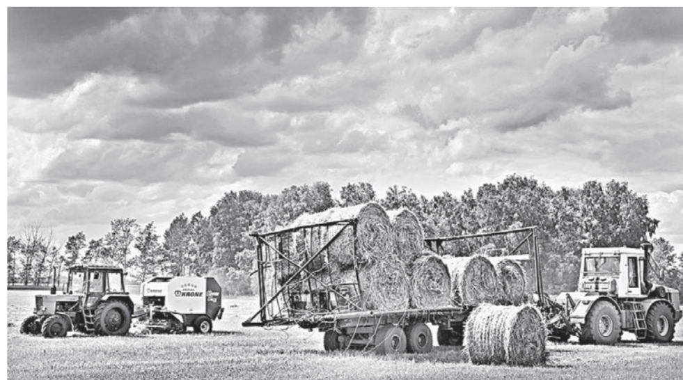
Теперь на повестке дня заготовка кормов.