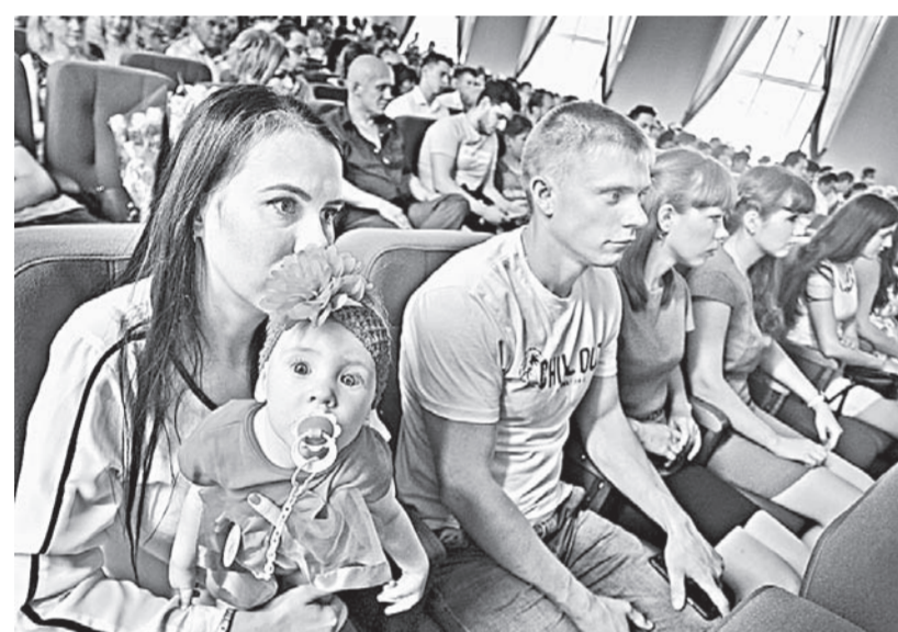
В актовом зале аграрного университета.

Первые 10 выпускников АГАУ, которые сразу по окончании вуза отправятся работать в хозяйства края, получили по 300 тысяч подъемных от края. Остальные могут рассчитывать на господдержку в течение ближайших 5 лет.