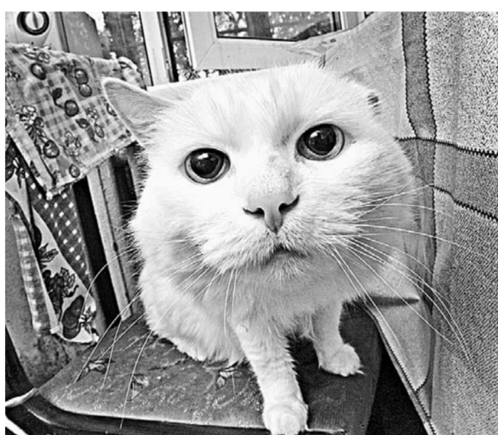
Без крысолова в доме никак.

аварийную службу. Мастера-сантехники в один голос утверждают, что в душевой на втором этаже стоит незаконно установленный поддон. Он забетонирован. Жильцы второго этажа не хотят его взламывать за свой счет, а сантехник – бесплатно. Управляющая компания ПЖЭТ № 1 Октябрьского района не хочет этим заниматься. Мастер выдала предписание жильцам 11-й секции обновить все трубы. Они повиновались и выполнили, заплатили 26 тысяч рублей. Но это не помогло, вода с потолка продолжает бежать как ни в чем не бывало... И после этого еще стало заливать второй этаж.