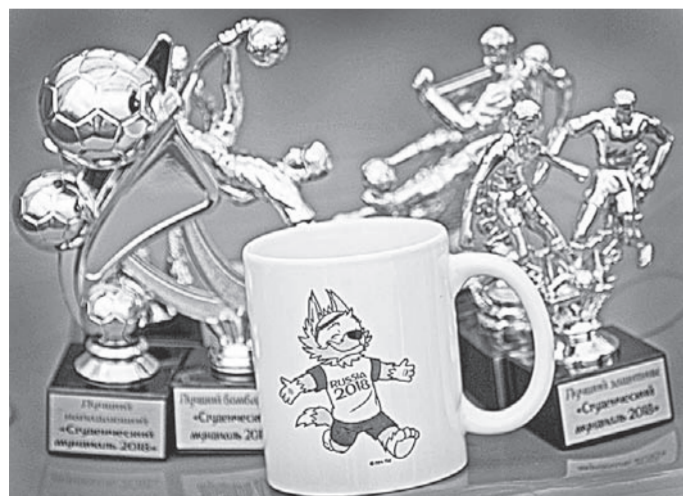
Призы и сувениры – от организаторов и партнёров.

В минувшие выходные, когда вся страна находилась в тревожном ожидании матча сборных России и Испании, на Алтае кипели свои футбольные страсти. В Барнауле параллельно с мировым первенством состоялся турнир «Студенческий мундиаль».