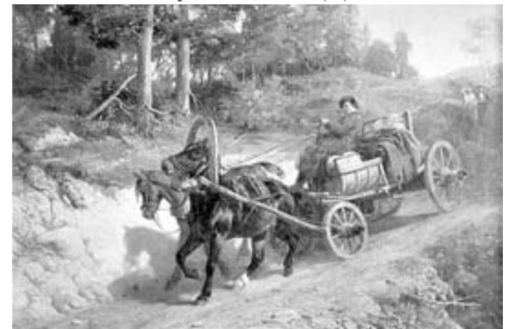
Выставка «Время былое» в Художественном музее.

КРАЕВЕДЧЕСКИЙ МУЗЕЙ, ул. Ползунова, 46, тел. 63-47-58. Выставки: «Алтай – перекресток культур», «Душа России» (изделия народных мастеров Алтая), «Заповедными тропами Алтая», «Алтай на звездных орбитах», «Детский мир», «Солдаты России», «200 без 5», «Говорит и показывает» (из частной коллекции А.А. Минкина) и др. (все 6+). «На просторах Монголии» – персональная фотовыставка Альфреда Позняка (0+). Более 90 фотографий, представленных в музее, – результат международной экспедиции, проходившей в 2017 году. Выставка работает до 31 июля. ХУДОЖЕСТВЕННЫЙ МУЗЕЙ, ул. М. Горького, 16, тел. 50-22-29. 28 июня. 16.00 – открытие выставки художников Республики Тыва «Сокровища времён». Скульптура и камнерезное искусство мастеров – участников и лауреатов многочисленных выставок в России и за рубежом. «Время былое» – выставка к 60-летию музея (0+). «Волшебный мир зверей и птиц» – мини-выставка анималистической скульптуры к 60-летию со дня рождения Ю. Мингулова (1958 – 1995). До 1 июля. «Путешествие сказочника Сани» (0+). «Рисуют дети Японии» (0+). Фотовыставка «Парад победителей» (0+).