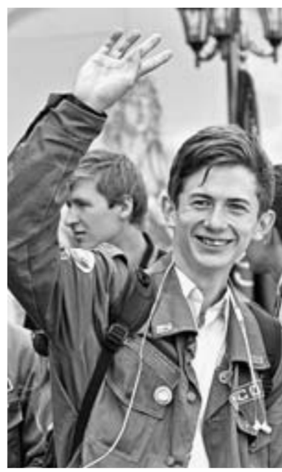
«До встречи на стройке!».

Поздравили активистов со стартом третьего трудового семестра