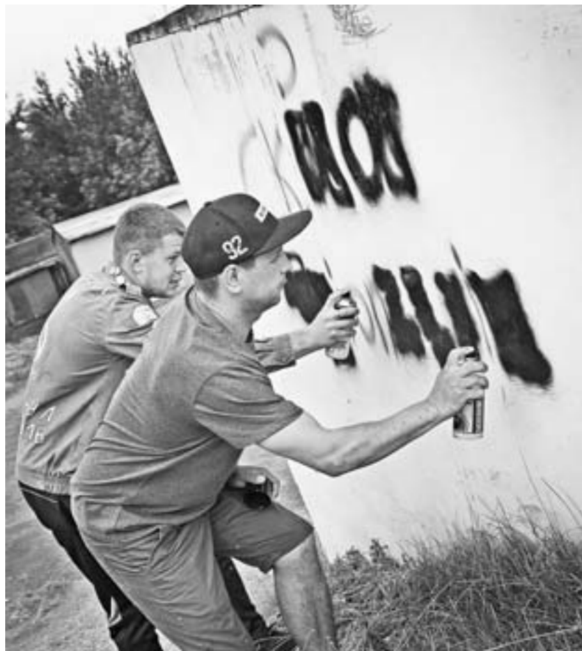
Волонтеры «Антидилера» закрашивают незаконную рекламу наркотиков.

— Надписей с каждым годом становится все меньше и растет число людей, вовлеченных в решение этой проблемы. Но нам очень не хватает участия горожан, надо, чтобы они помогали пополнять базу таких адресов, сообщали о них «ВКонтакте»