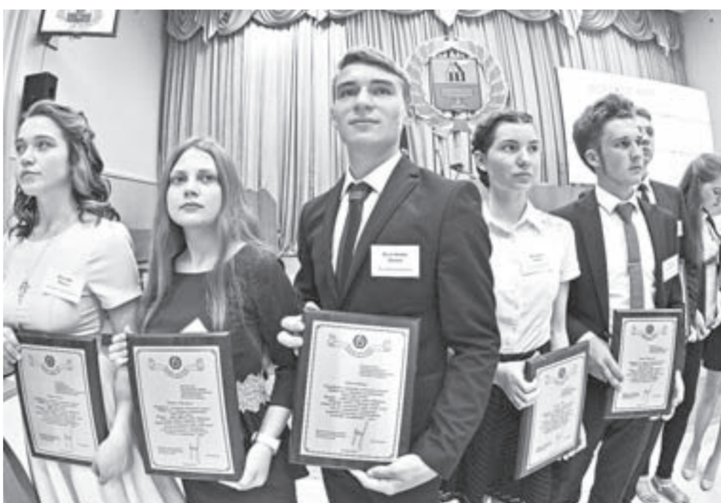
Эти ребята – отличники, победители и призеры олимпиад.