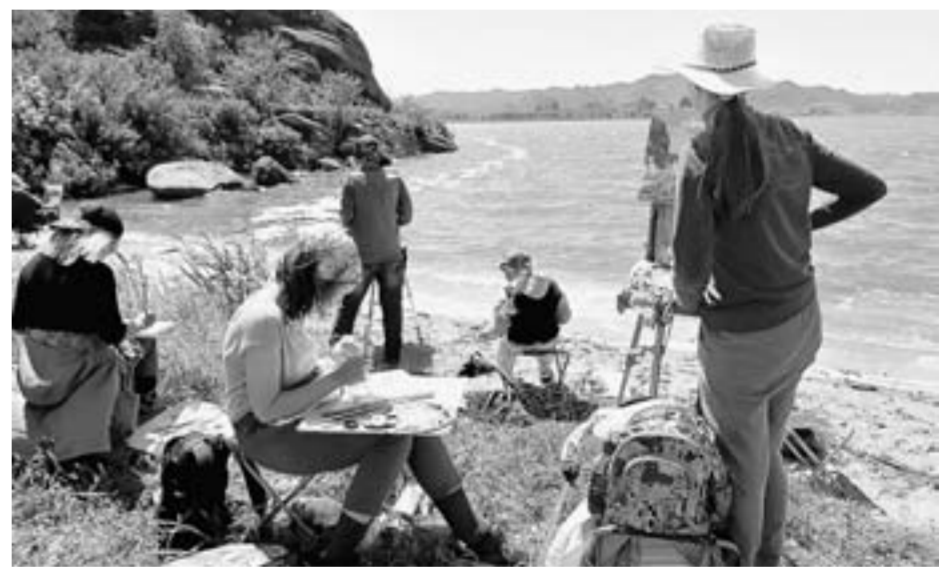
Школьники многому научились, работая вместе с известными живописцами края.

– Это эффективная передача опыта, – говорит художница. – Мы следуем тради-