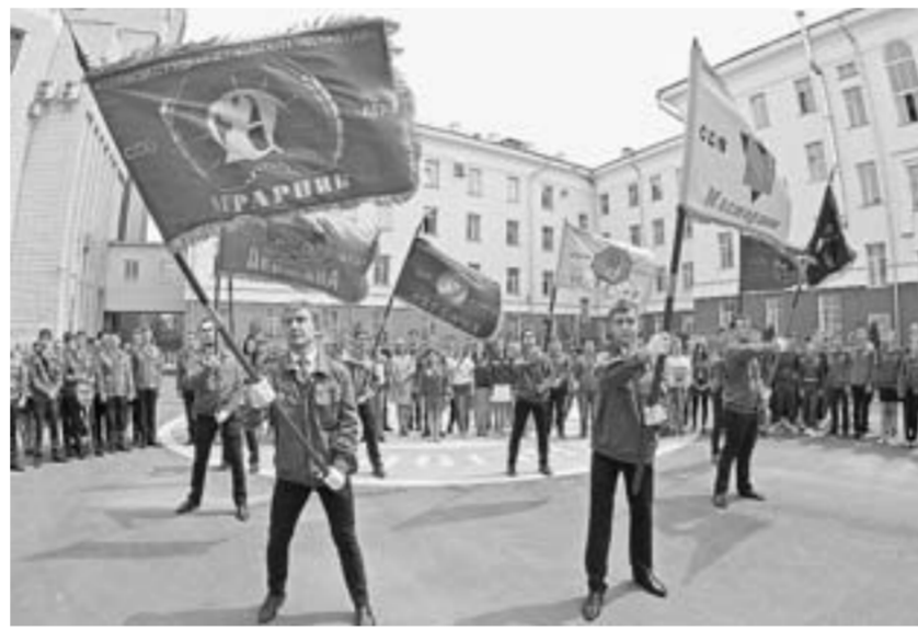
Во время торжественного открытия мероприятия.

инфраструктуру. Прикладывая собственные усилия к ремонту, бойцы по-другому начинают относиться к малой родине, краю. В-третьих, активисты чувствуют себя нужными, есть возможность закрепиться на предприятиях и получить достой-