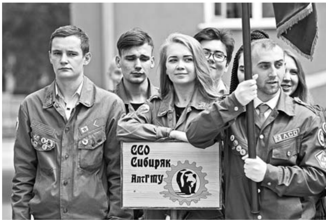
Стройотряд «Сибиряк» займется озеленением города.

— Работа в своем городе имеет массу преимуществ. Во-первых, ребята проходят тест-драйв, не уезжая из дома, получают уникальный опыт, с которым могут выходить на всероссийский уровень. Во-вторых, есть возможность своими руками привнести в порядок общегородской, городскую