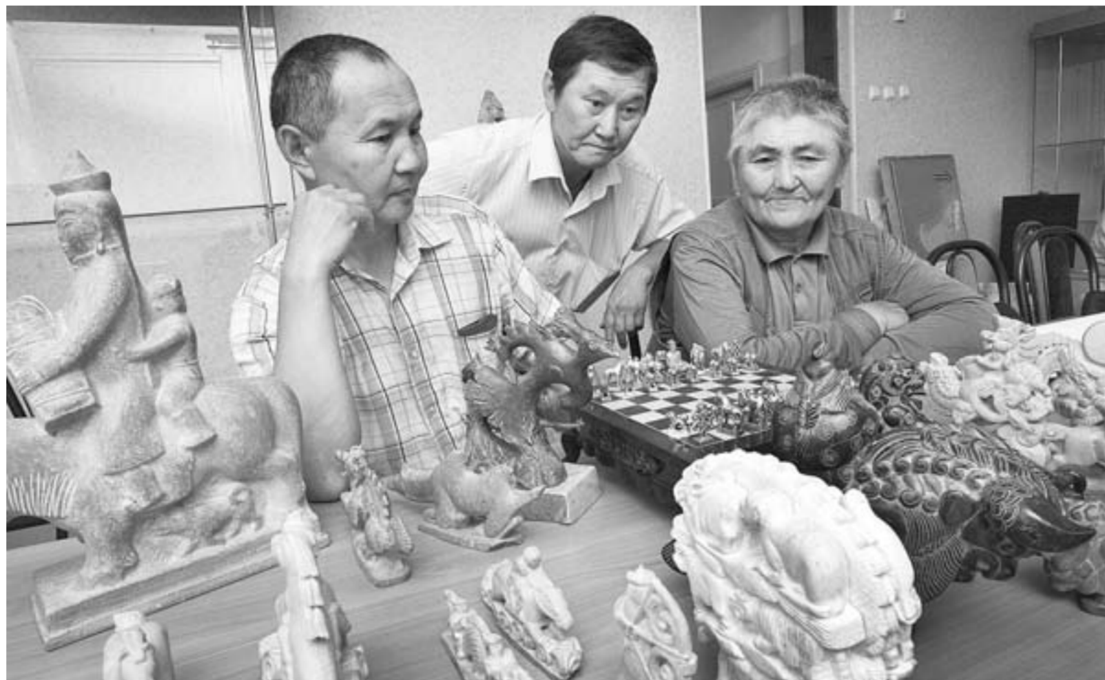
Художники-камнерезы из Республики Тыва привезли в Барнаул более 70 работ.