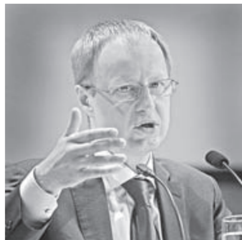
Участники предварительного голосования представили свое видение развития региона.

Врио главы региона заострил внимание на нескольких вопросах, которые требуют решения. Он отметил, что по уровню заработной платы Алтайский край занимает последние строчки не толь-