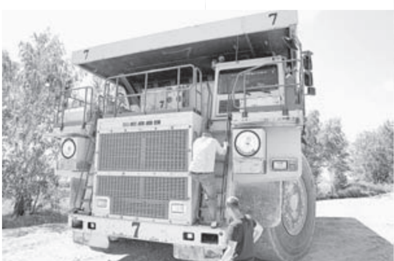
За рейс БелАЗ перевозит почти 140 тонн руды.