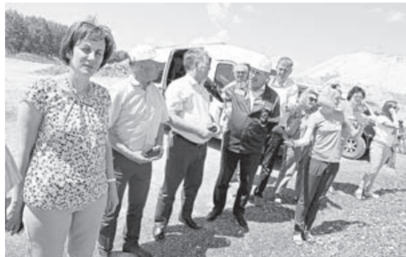
Депутаты АКЗС побывали на Степном месторождении.

На прошлой неделе в Змеиногорском районе подвели итоги Дней Алтайского краевого Законодательного Собрания. В течение месяца в муниципалитет выезжали и там работали председатели, депутаты и консультанты постоянных профильных комитетов АКЗС, а также специалисты аппарата краевого парламента. Они встретились с жителями практически всех населенных пунктов района.