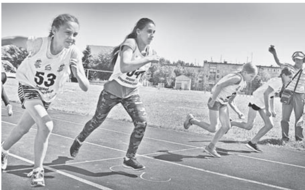
Фестиваль собрал самых подготовленных школьников.

Судейство было довольно строгим, но корректным. Таким, как и должно быть на краевом финале. Если, к примеру, участник заступал за черту при броске мяча либо