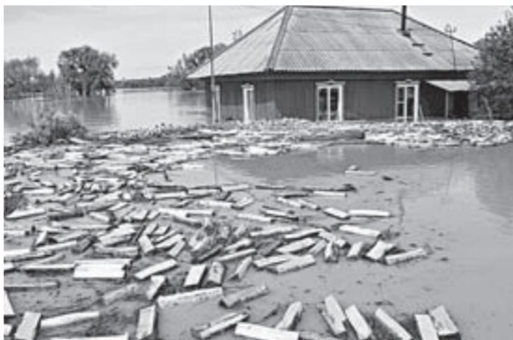
Первая волна затронула 23 района края.

Все пострадавшие получат единовременную материальную