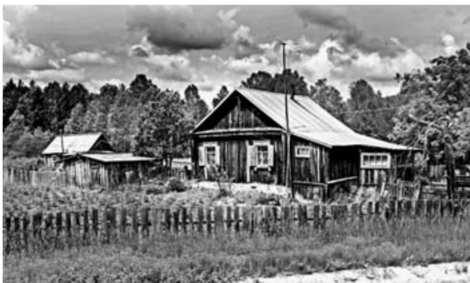
В крае удалось выявить порядка 600 случаев пересечения границ с лесными землями.