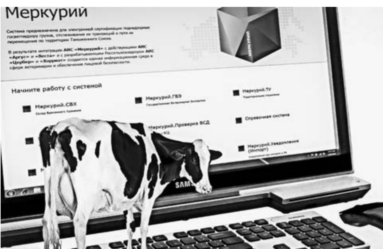
Получить доступ к работе в «Меркурии» при желании можно за пять дней.