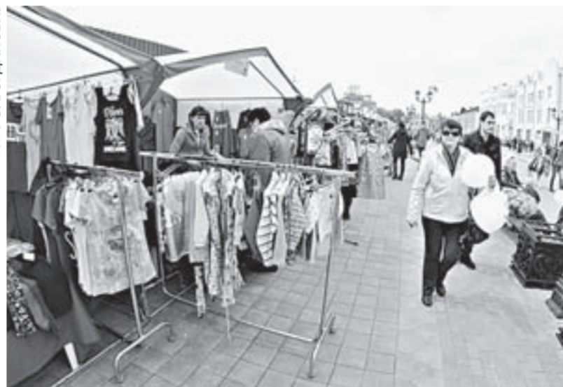
На всяк взгляд, на любой вкус.

Правда, порой и сама продажа-покупка товара превращалась в занимательное мероприятие. К примеру, специалисты ООО «Барно», ТМ «Алтайский пряник» предлагали при покупке пряника разрисовать его разноцветной глазурью, а ООО «Мельник» организовало для маленьких