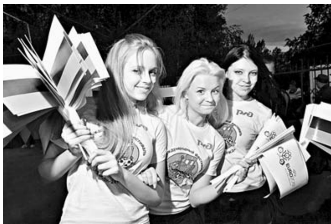
С такими болельщицами наши футболисты просто обязаны побеждать в каждом матче.

До главного спортивного события последних лет остались считанные дни. Увидеть лучших футболистов мира живую на российских стадионах удастся далеко не всем. Однако присоединиться к празднику всё равно можно: во время турнира надо идти в фан-зону!