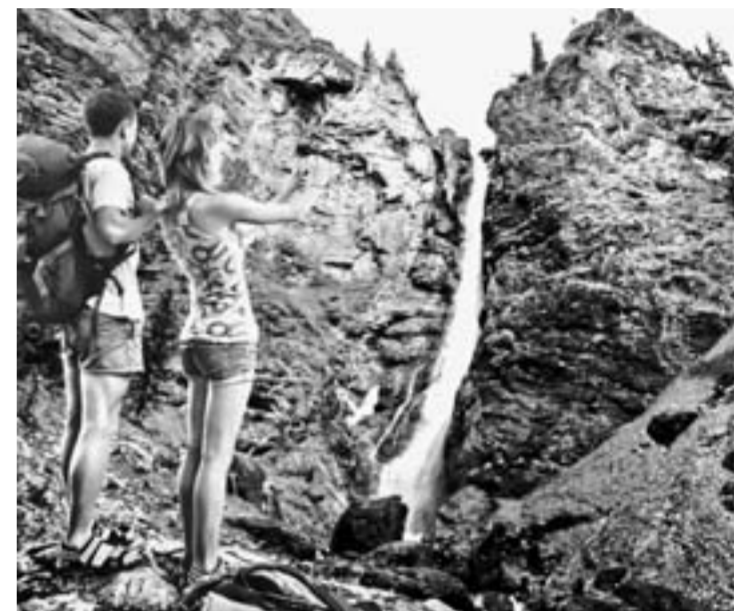
Каскад водопадов на реке Шинок – одна из достопримечательностей Алтайского края.

Уже этим летом можно будет без труда полюбоваться каскадом водопадов на реке Шинок в Солонешенском районе. В КГБУ «Алтайприрода» подготовили перечень работ по благоустройству экологической тропы на этот природный объект.