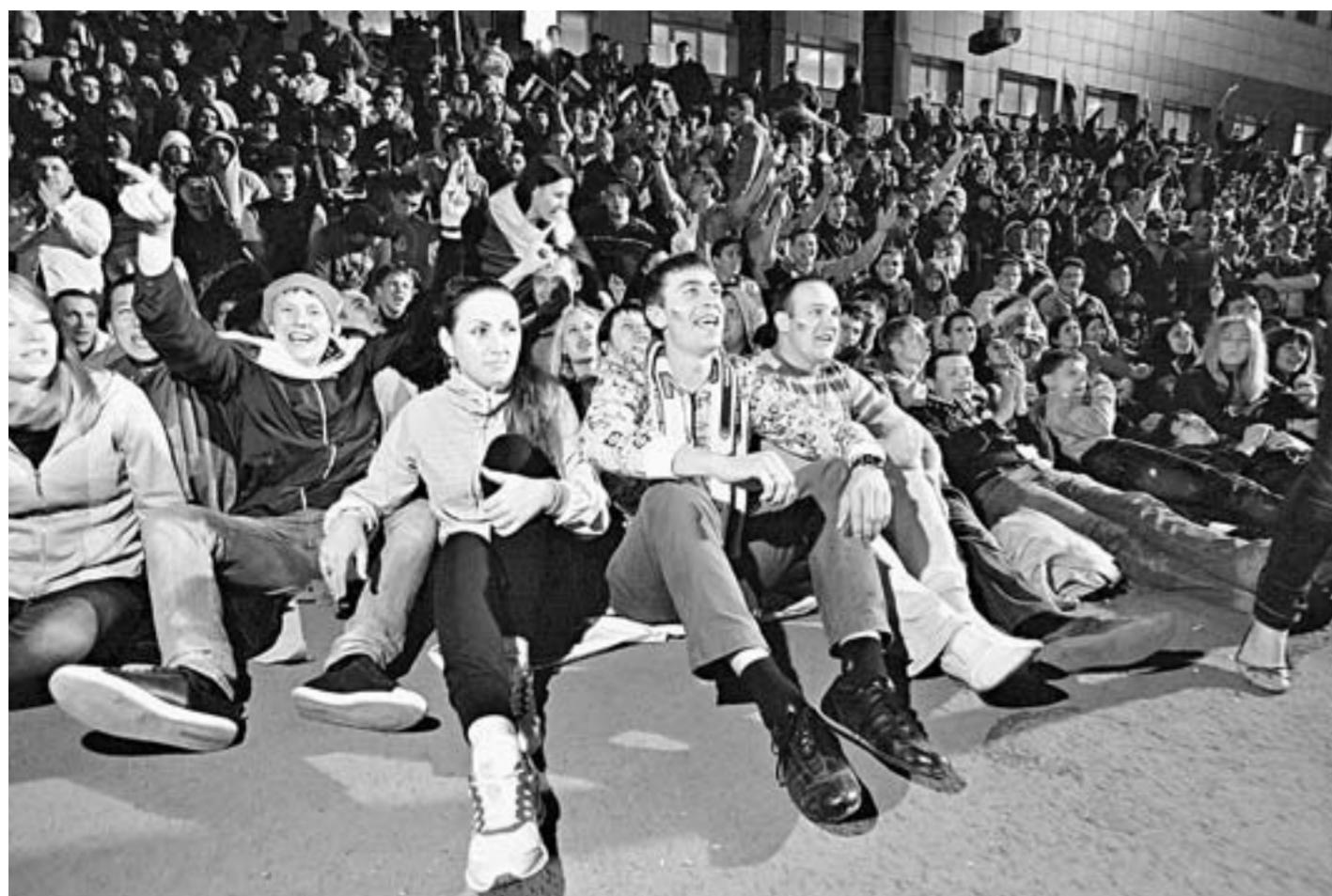
Барнаульская фан-зона готовится принять до 5 тысяч человек.