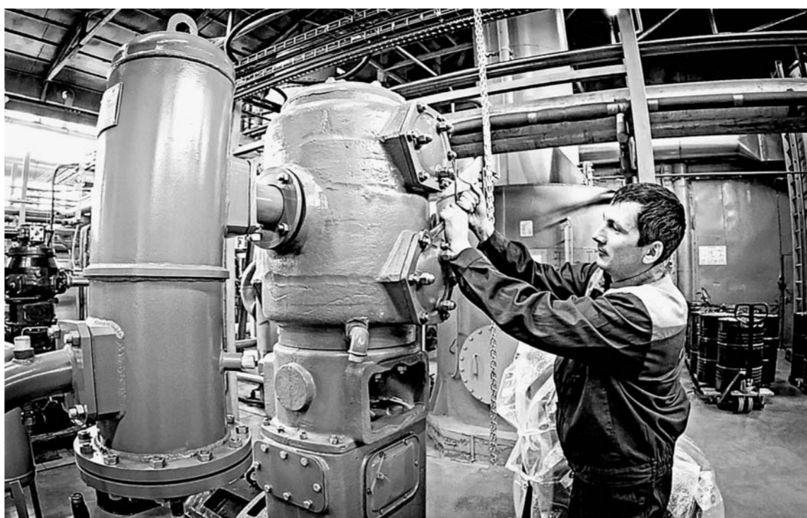
Система очистки углекислого газа иногда требует регулировки.

Проект завода разработала московская компания «Пламя», складывая в него отечественное оборудование. Москвичи потом его и монтировали.