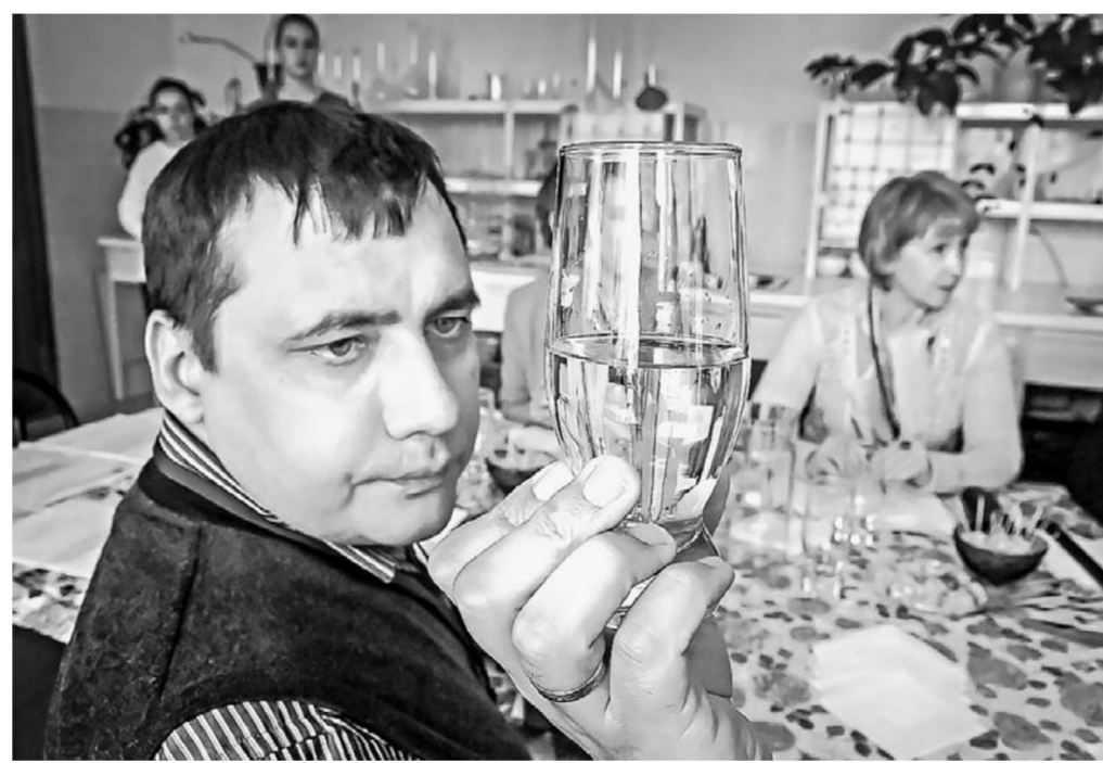
Посмотрим... и попробуем.

В этот раз экспертное жюри оценило 39 образцов продукции, которую представили 9 предприятий пивобезалкогольной отрасли Алтайского края. В 12 номинациях