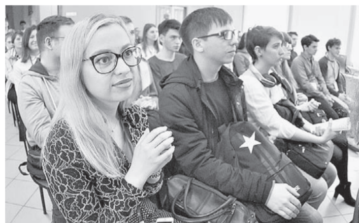
32 студента принимают участие в состязаниях на базе АлтГУ.

были максимально приближены к реальной жизни. По его словам, чемпионат «Молодые профессионалы» набирает обороты, в его ассоциацию входят 160 ведущих вузов из 34 российских регионов. Кстати, к работе постепенно подключаются не только студенты, но и школьники от 14 до 16 лет. Более того, рассматривается вопрос о том, чтобы снизить возрастную планку до 10 лет.