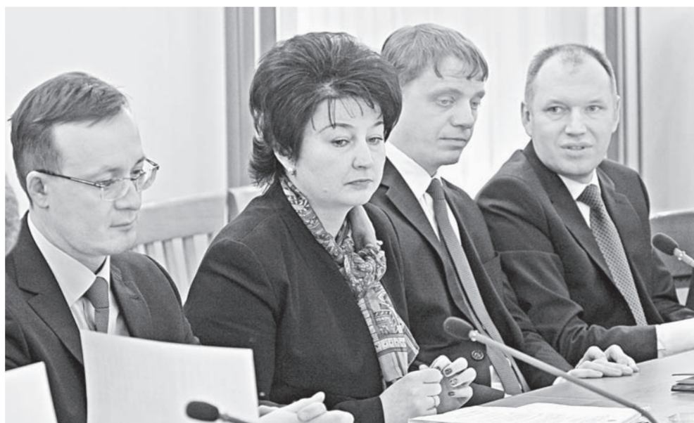
Предстоит серьезная совместная работа.