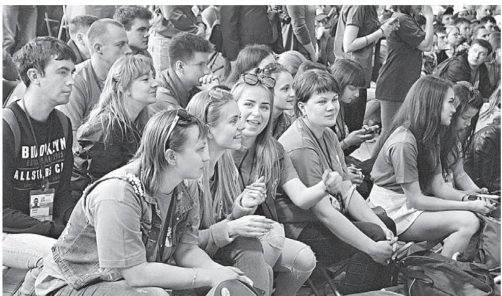
Участие в форуме для многих молодых людей открывает хорошие перспективы.

НА ФОРУМЕ «АЛТАЙ. ТОЧКИ РОСТА» УЧАСТНИКИ ПОЛУЧАЮТ ВОЗМОЖНОСТЬ ПРЕЗЕНТОВАТЬ СВОЮ БИЗНЕС-ИДЕЮ, ПОЛУЧИТЬ ОЦЕНКУ ВЕДУЩИХ ЭКСПЕРТОВ.