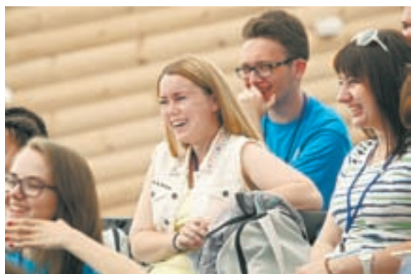
Идет работа секции.