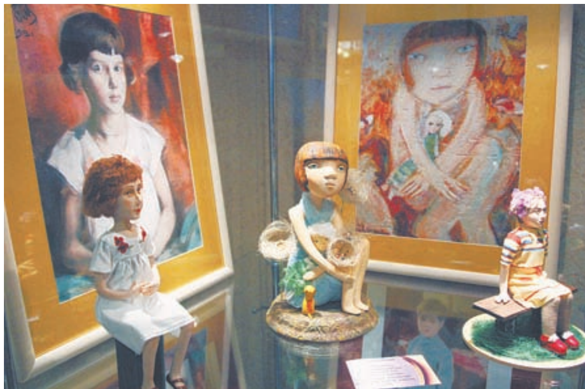
Мастера-кукольники вдохновлялись не только академической живописью.