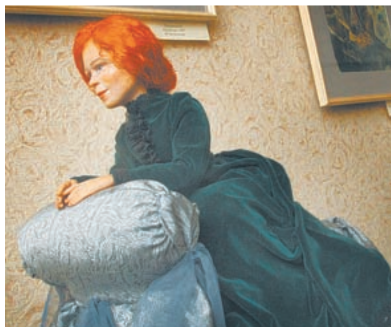
Одежда, украшения и аксессуары для кукол выполняются вручную.