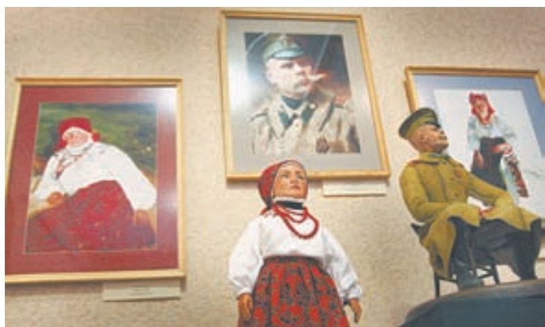
В зале Художественного музея.

В Художественном музее работает уникальная выставка-конкурс «Куклы в зеркале художественных полотен».