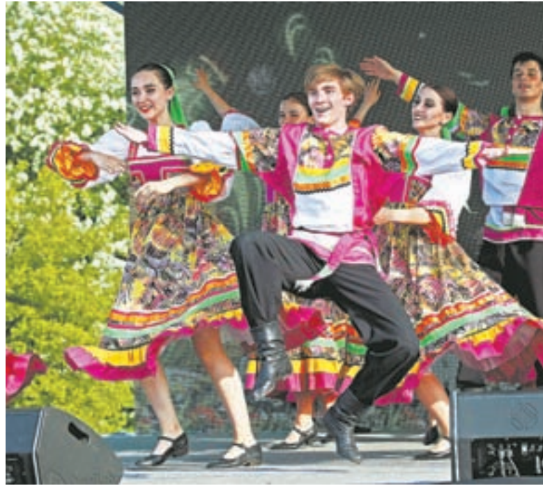
Во время праздничного концерта.