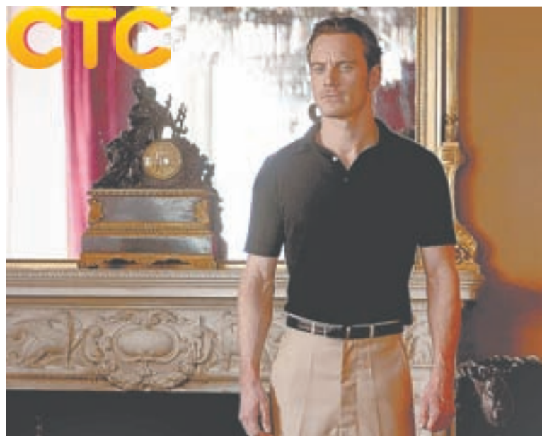
21.00 Х.ф. Впервые на СТС! «Люди Икс: Первый класс» (16+)

05.00 Т.с. «Дорожный патруль» (16+) 06.00 Сегодня 06.05 Т.с. «Дорожный патруль» (16+)