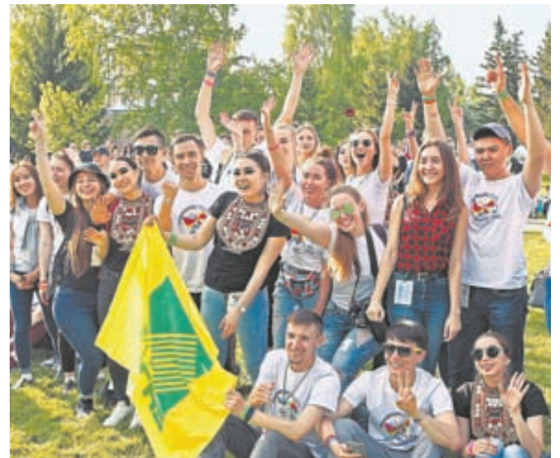
Фестиваль объединил студентов из 22 регионов страны.

– На Алтай приехала впервые и полюбила с первого взгляда. Краси-