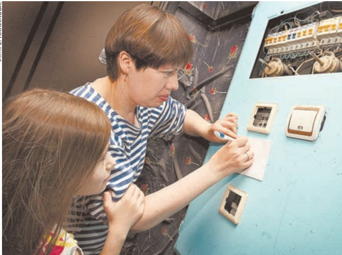
Интеллектуальные приборы избавят от необходимости каждый месяц снимать данные с электросчетчиков и передавать их в управляющую компанию.

будет возможность перейти на изготовление новых приборов.