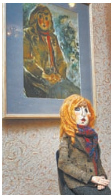
Текстильная кукла Светланы Уколовой.