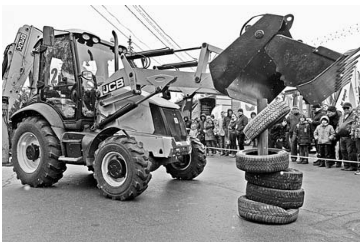
Экскаватор строит пирамиду.

По специальности он механизатор широкого