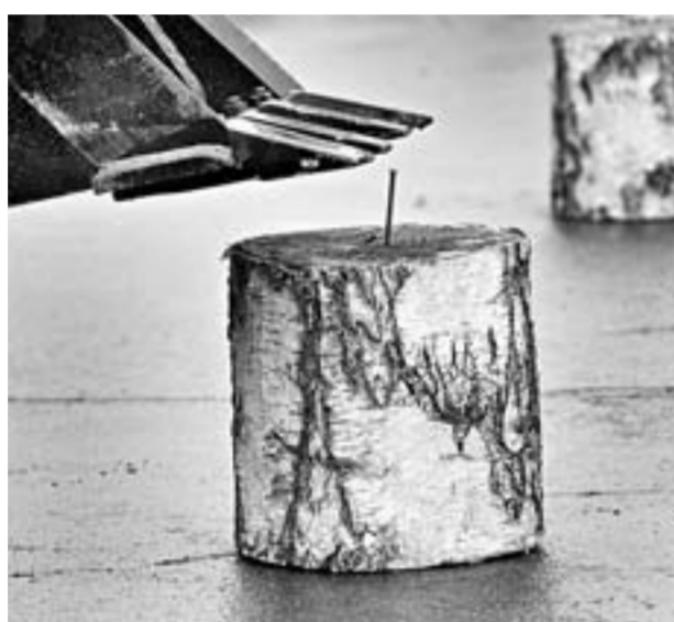
Вбить гвоздь в чурку железным ковшом – испытание не из легких.