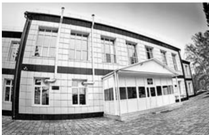
Родинская школа №1 после капремонта.