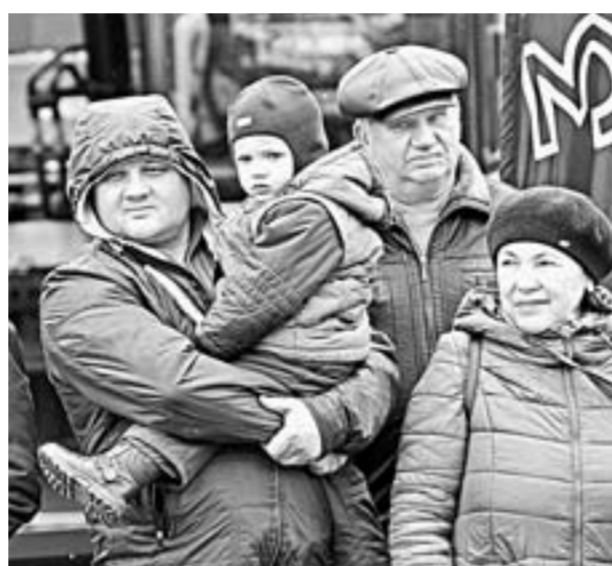
Зрители с интересом наблюдали за происходящим.

профиля, хотя диплом долгое время лежал без дела. Мужчина 20 лет работал токарем. Затем решил сменить род деятельности и переключился