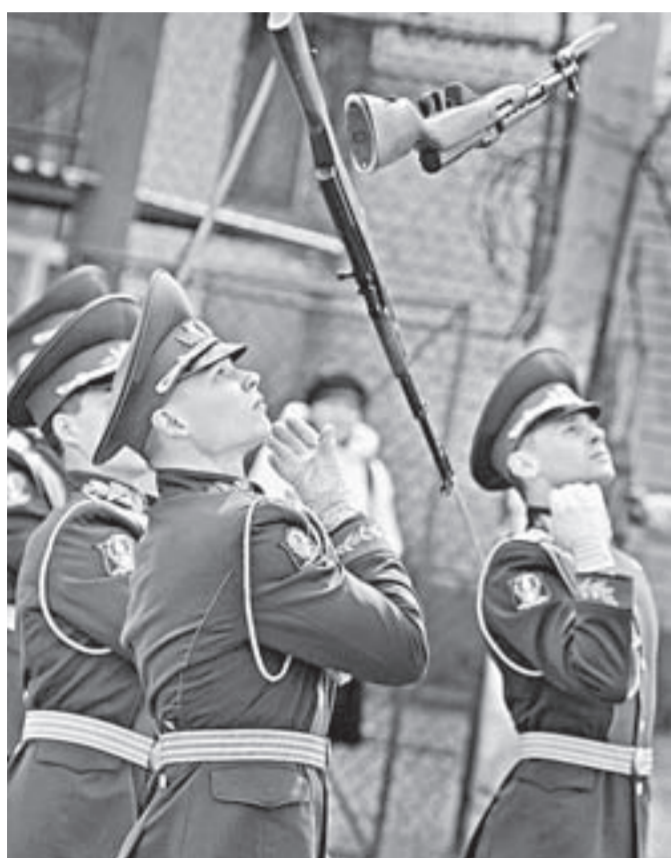
Взвод почетного караула БЮИ. Показательные выступления.