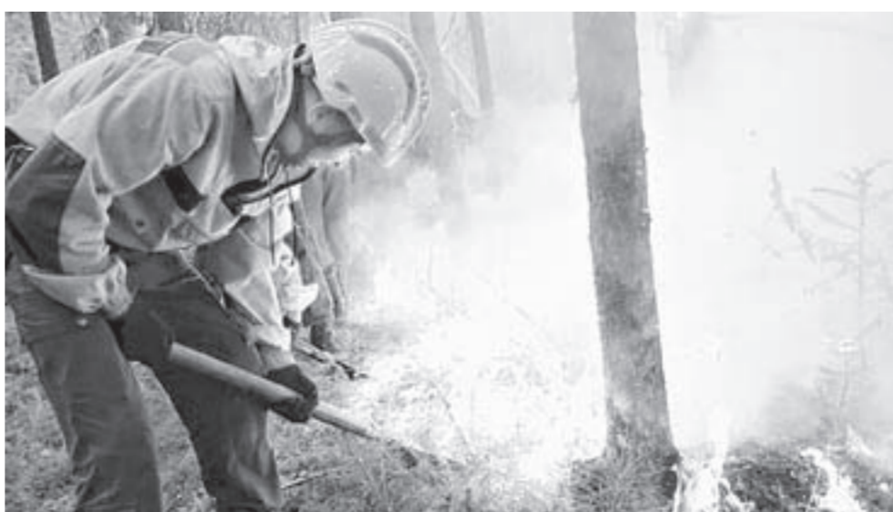
В регионе готовы оперативно реагировать на ситуации любой сложности.

В 2018 году в регионе произошло 11 лесных пожаров (для сравнения: на аналогичную дату 2017 года – 42). Площадь возгорания