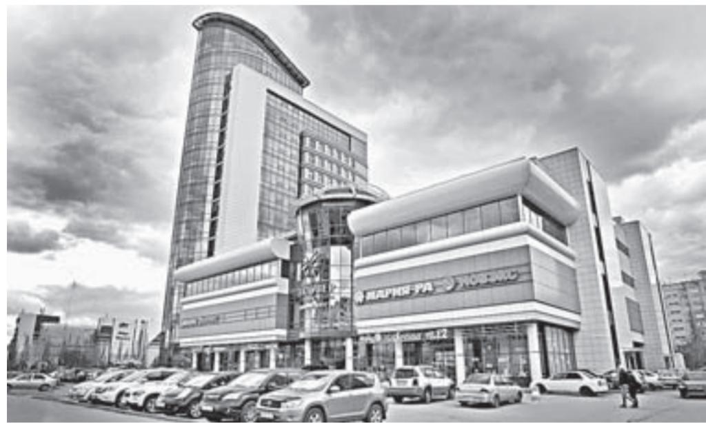
От собственников ТРЦ ждут устранения нарушений.

В Барнауле и Бийске за нарушение пожарной безопасности приостановили работу уже пять торговых-развлекательных центров. И это не показатель истинного положения дел. Нарушение противопожарных правил в разной степени контролирующие органы выявляли практически на всех проверяемых объектах. А их, к сожалению, сотни.