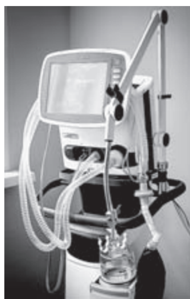
Аппарат искусственной вентиляции легких всегда готов к работе.