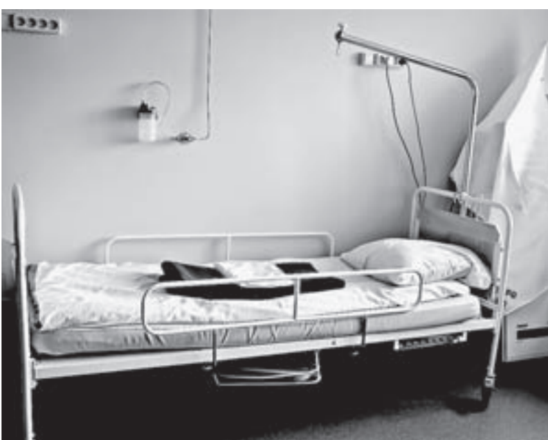
Палаты интенсивной терапии преобразились.