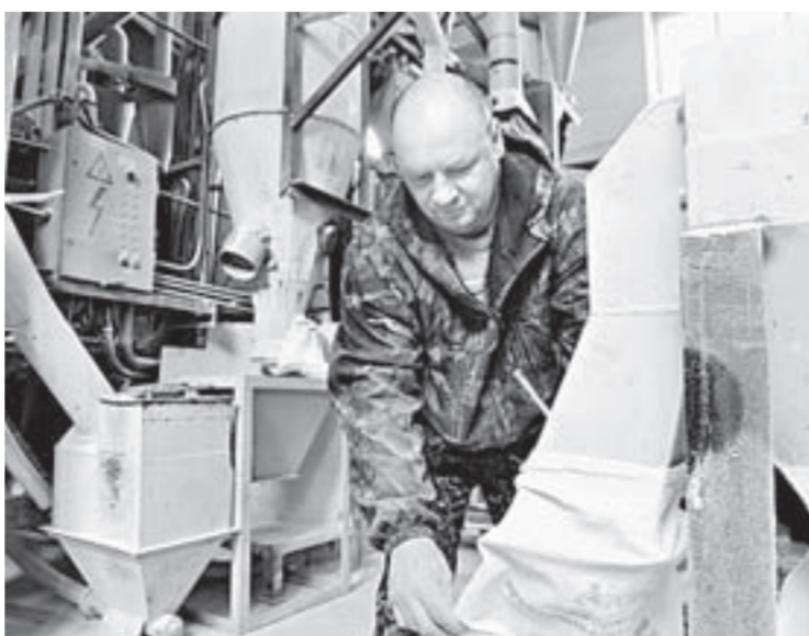
И на российском оборудовании можно получать хорошую муку.