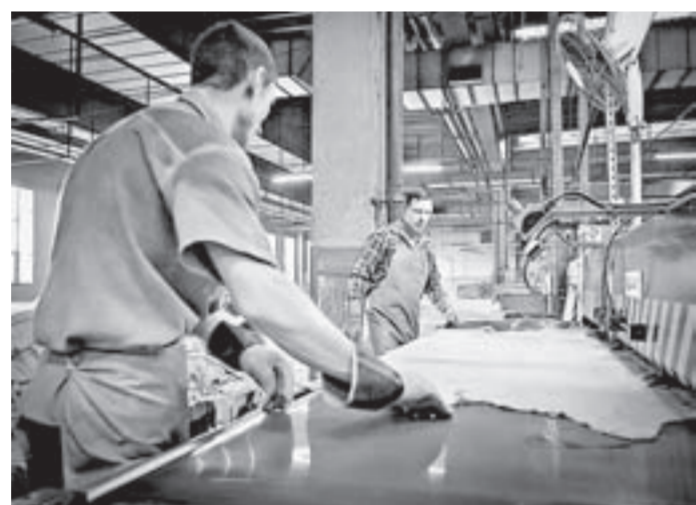
В строительство кожевенного завода планируют вложить 1,6 млрд рублей.

Он сообщил, что подготовлена схема заключения соглашений об осуществлении деятельности на ТОСЭР Заринске и Новоалтайске. Сейчас документы проходят процедуру согласования.