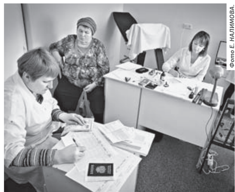
Новые подходы позволят сократить сроки и улучшить качество диспансеризации.

По словам министра здравоохранения Ирины Долговой, цели про-