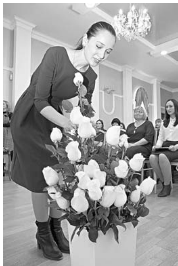
Белые розы – символ чистоты и благородства медиаторов.

Проект «Алтай – территория примирения» поможет семьям региона в решении своих конфликтов. Первые 30 медиаторов, обучающихся искусству мирного их разрешения, скоро приступят к работе в ЗАГС Барнаула и Бийска.