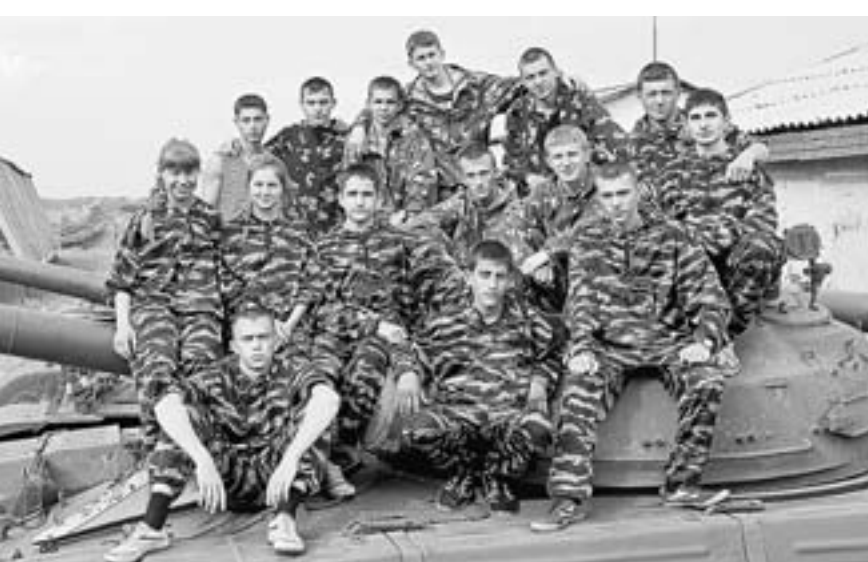
Юные патриоты Славгорода.

Автомат Калашникова слугородские мальчишки и девчонки из клуба «Десантник» разберут и соберут за считанные минуты. Кроме этого они владеют основами рукопашного боя, занимаются кикбоксингом, боксом и прыгают с парашютом. А сегодня центр военно-патриотического воспитания «Десантник» известен своими победами не только в Славгороде, но и далеко за его пределами. Этой весной военно-патриотический центр отметит 30-летие.