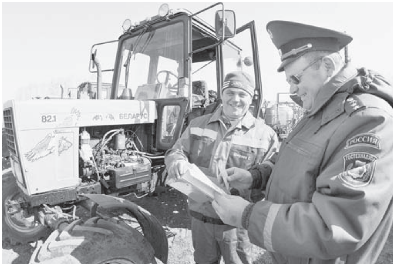
Специалист Ростехнадзора проверяет документы у тракториста.

– потом успокаивается и начинает рассказывать: – Мы руководим хозяйством вместе с братом с 2003 года. В 2008