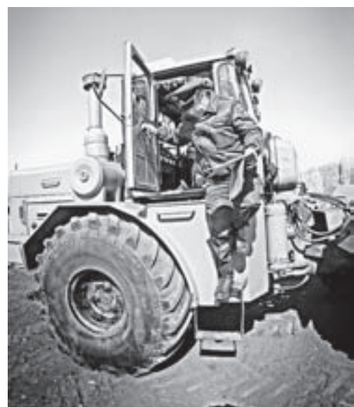
Техосмотр – дело серьезное.

По статистике, больше всего нарушений в мелких хозяйствах. Техника там, как правило, старая. На ее восстановление необходимы