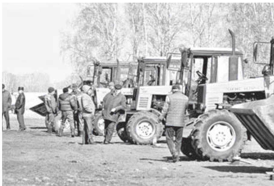
Скоро эта техника выйдет на поля.