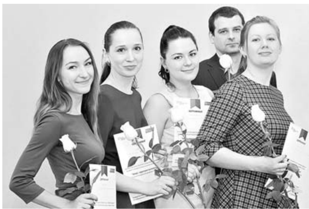
Скоро они приступят к работе.

Социально значимый проект «Алтай – территория примирения» начался, можно сказать, по требованиям, предъявленным самой жизнью. Ежегодно в крае реги-