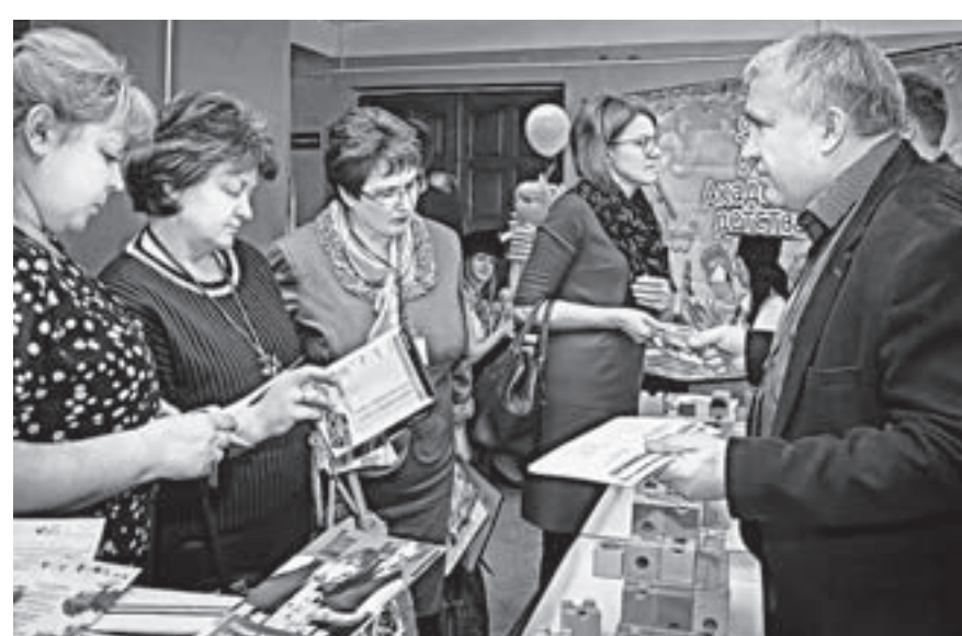
Одна из задач конференции – обмен опытом и идеями.

А недавно открытый в Барнауле технопарк «Кванториум» на выставке представил наборы для сборки и пилотирования различных коптеров.