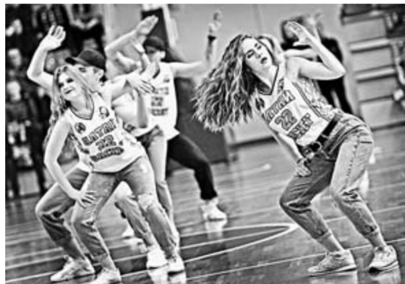
Группа поддержки заводила публику в перерывах матча.

В целом же концовка прошла под стать всему сезону – утешительный турнир за 9 – 14 места команда провела весьма нервно. На выезде барнаульцы так и не сумели одержать ни одной победы. Зато отведдали домашней виктории, огорчив по разу и курских «Русичей» (78:77), и динамовцев Ставрополя (87:76), и черкесский «Эльбрус» (91:71).