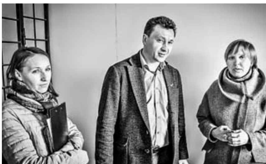
Комиссия тщательно проверила новое жильё.

В новый дом на улице Советской Армии, 71 в Барнауле передут 30 детей-сирот. Перед новосельем качество новостройки проверили представители Минстройтранса, ОНФ, Регионального жилищного управления, администрации города.