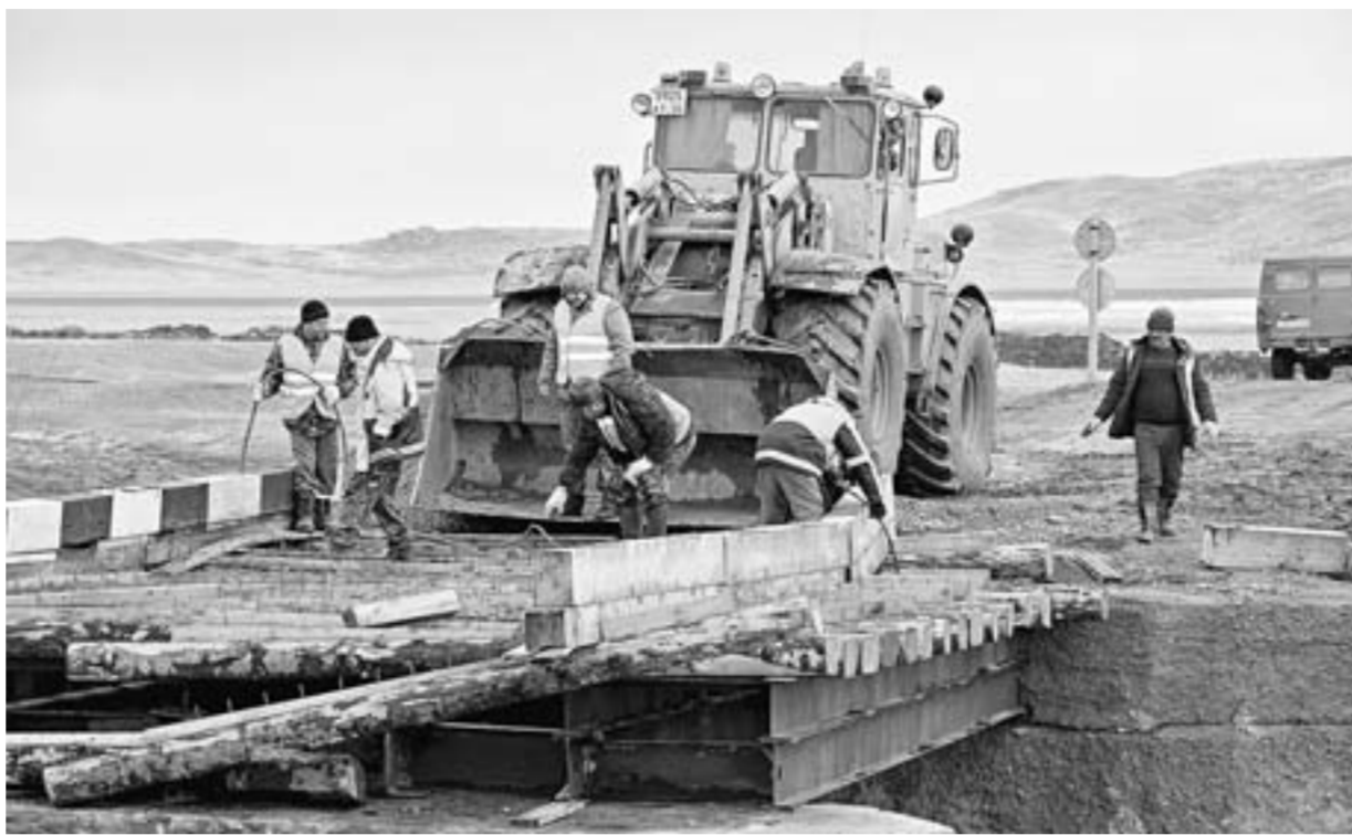
Дорожники демонтируют поврежденный мост.

Между тем для Екатерининского сельсовета мост имеет, можно сказать, стратегическое значение. Прежде всего по нему проходит школьный маршрут. В Екатерининском