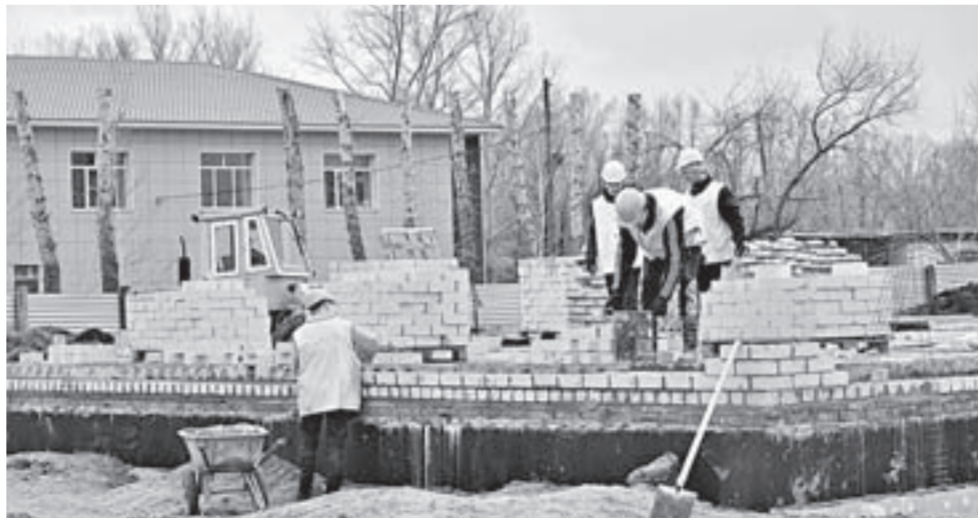
Строители приступили к кладке стен.

На территории села расположено крупное сельскохозяйственное предприятие «Колос», которое обеспечивает жителей работой. За последнее время даже наблюдается прирост населения. Современная школа и детский