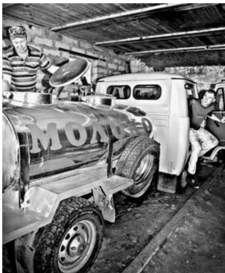
Кооперативы могут выдерживать стабильные цены на сырье.

В отношении трёх закупщиков сырого молока, работающих в Усть-Калманском районе, управление Федеральной антимонопольной службы по Алтайскому краю возбудило дело. В их действиях выявлены признаки картельного сговора.