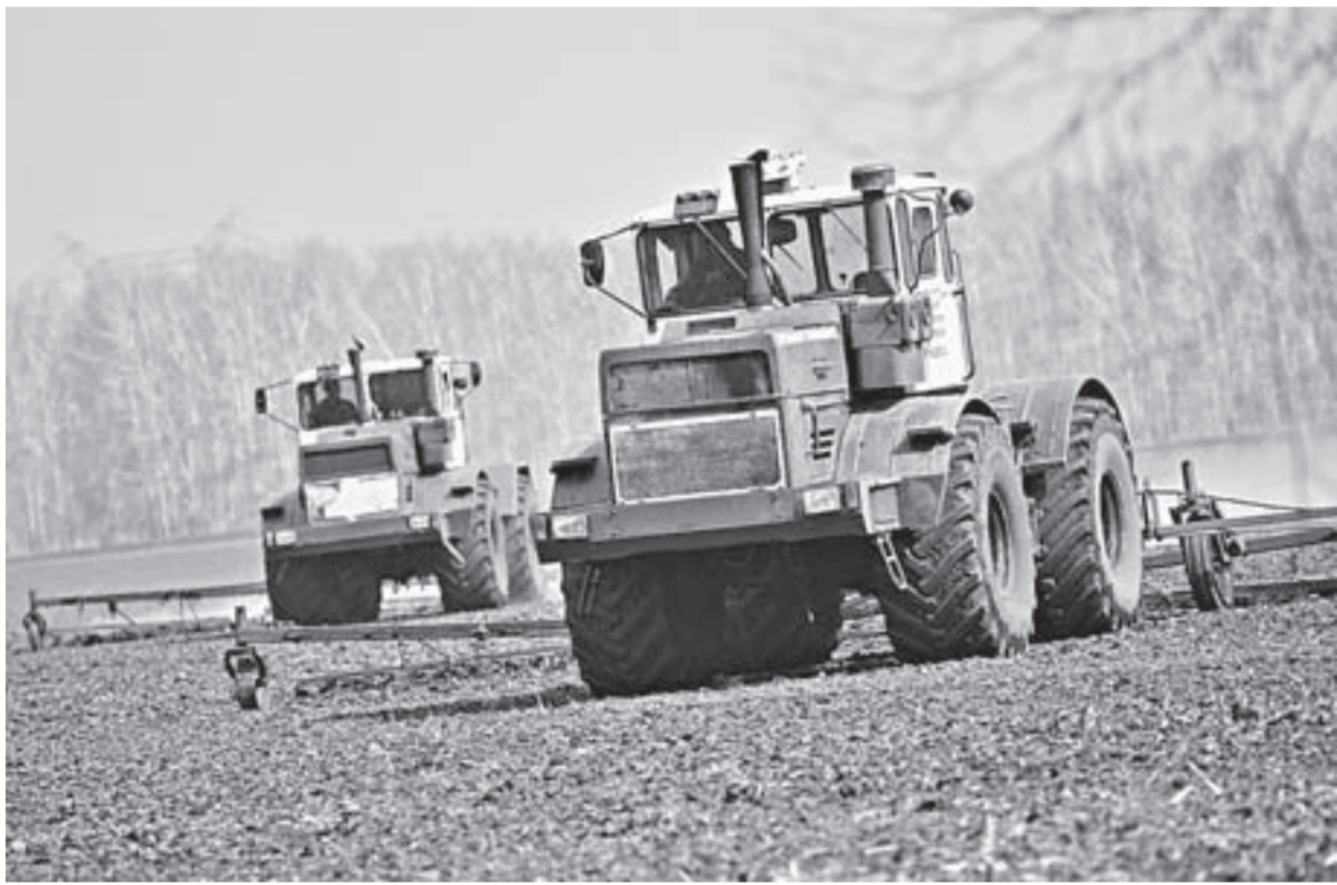
Алтайские аграрии начали весенне-полевые работы с прибавки влаги.

Для того чтобы хозяйства края могли подготовиться к сезону, в этом году Минсельхоз РФ беспрецедентно рано выделил финансовые средства для АПК. Аграрии края уже получили по разным формам поддержки 1,7 млрд рублей. Всего же планируется выде-