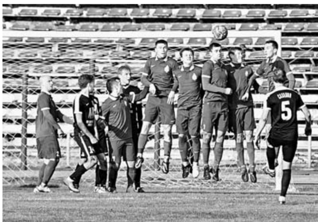
Защитник «Сахалина» забивает гол в ворота «Динамо».