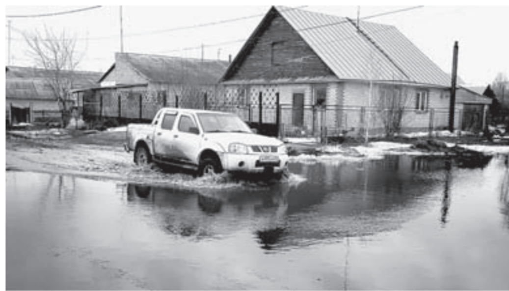
Такую водную преграду не на каждом транспорте получится преодолеть.

...Проехали мы по всемо поселку. Заметили кое-где подтопленные огороды, но во многих уже установлены насосы для откачки избыточной воды. Лужу или почти уже небольшое озеро заме-