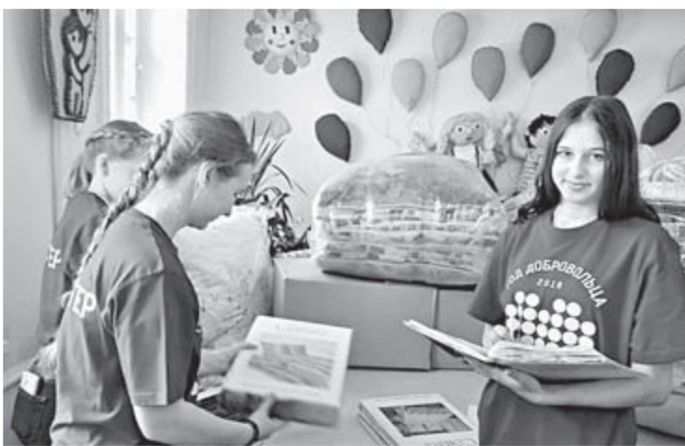
Каждый день волонтеры собирают гуманитарный груз для подтопленных районов.

Весна-2018 испытывает на прочность наших земляков. Сбор и доставка гуманитарных грузов в пострадавшие от паводка районы – одна из точек приложения сил волонтеров. Едва объявили режим ЧС, сменяя друг друга, они помогают сотрудникам регионального отделения Российского детского фонда сортировать и отправлять нуждающимся грузы, собранные, кстати, такими же людьми доброй воли. Они восстанавливают подтопленные усадьбы, оказывают психологическую поддержку детям из пострадавших районов, которые проходят реабилитацию в санаториях Бий-