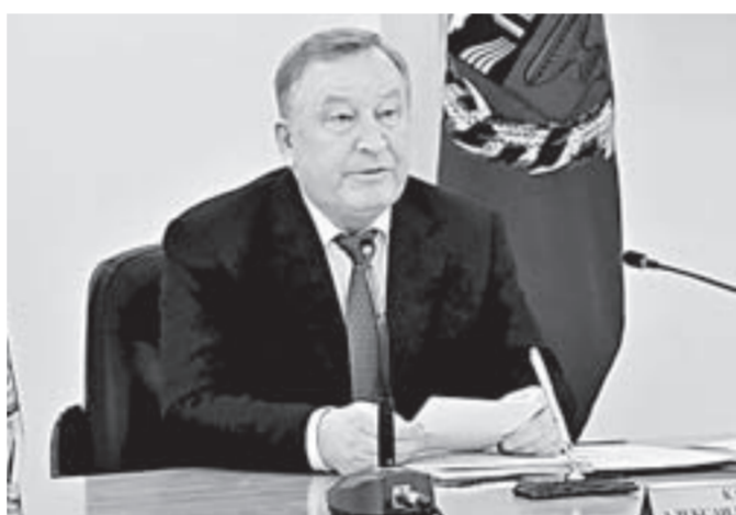
Александр Карлин: «Все внимание – ветеранам».