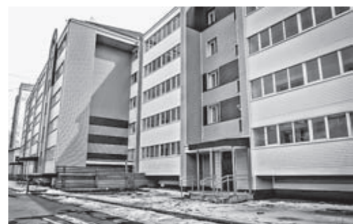
Этот дом – для медиков и педагогов.

ли поздравления и напутствия первых лиц города. Главными пожеланиями было жить в мире и дружбе с соседями, сделать свой дом образовательным и произвисти в нем настоящий беби-бум!