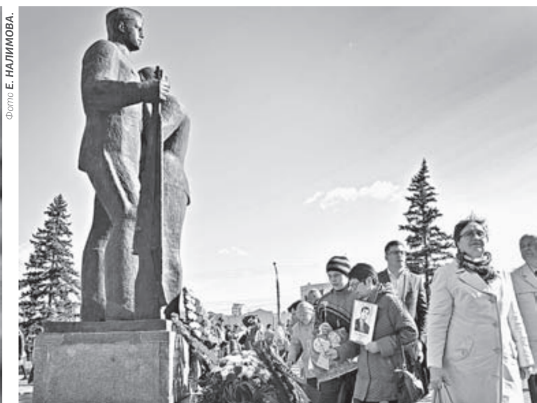
В акции «Бессмертный полк» примут участие десятки тысяч жителей края.