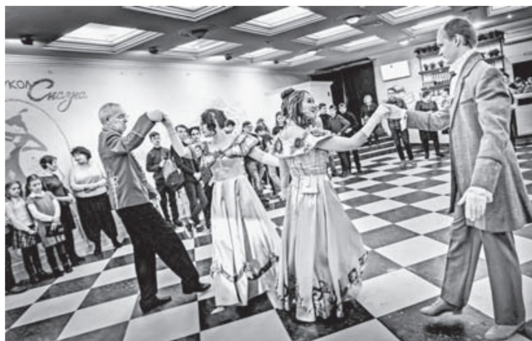
Перед премьерой исполняли балетные танцы XIX века.

Вот через зимний пейзаж, возникший над черной Невой, едет крестьянин на санях (плоская белая фигурка из фанеры!), и вдруг заснеженные холмы становятся скатертью на праздничном столе, над кото-