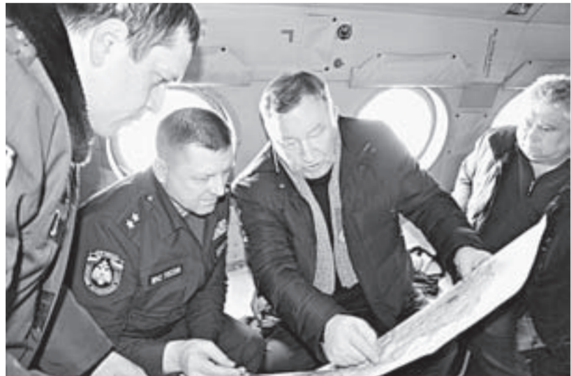
Александр Карлин и Сергей Диденко оценили ситуацию в трех наиболее пострадавших территориях.

С 27 марта губернатор Александр Карлин ввел на всей территории Алтайского края режим чрезвычайной ситуации.