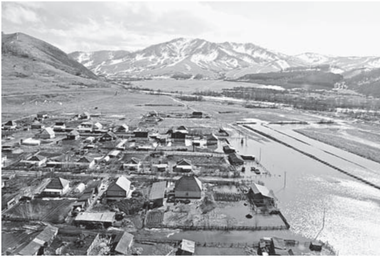
Паводковая обстановка по-прежнему остается непростой, она меняется достаточно стремительно.