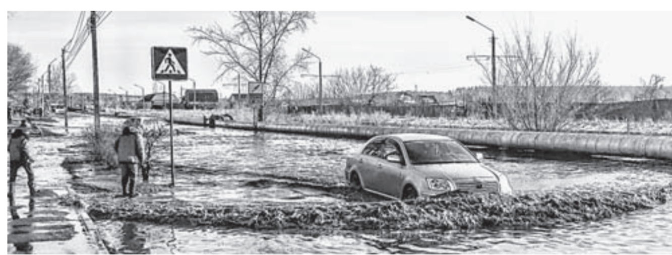
На некоторых участках легковые автомобили бийчан скрывало чуть ли не по самый капот.

Жители наукограда ждали паводок, готовились к нему. Проводили заседания Комиссии по чрезвычайным ситуациям, проходили командно-штабные учения с развертыванием оборудования, спецтехники и отрядов спасателей. Бия находилась под постоянным наблюдением. А паводок начался для многих бийчан совершенно неожиданно и вовсе не со стороны реки.