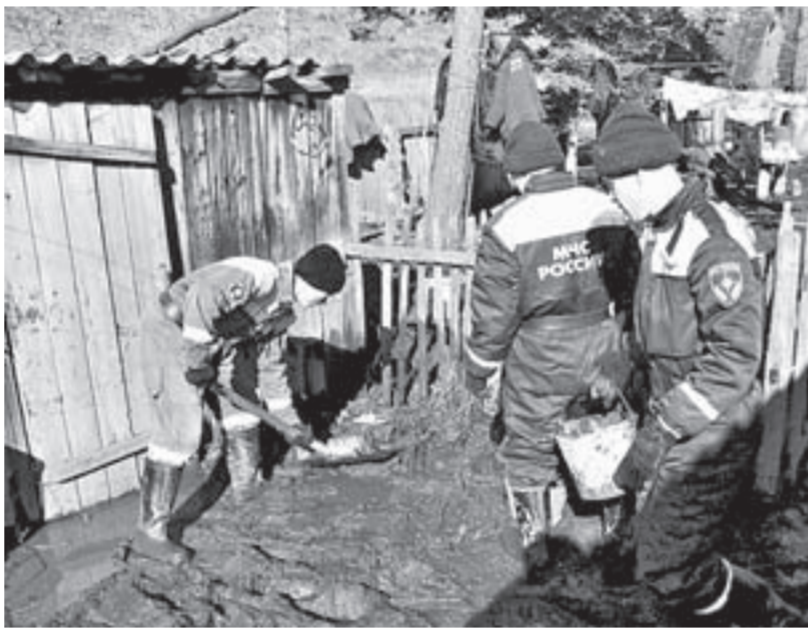
Спасатели оказывают необходимую помощь людям.

снег... По состоянию рек было все понятно. Мы это видели, поэтому подготовились, – рассказывает глава района Виктор Горбачев. – С 23 марта вся техника уже находилась возле администрации. Вода постепенно