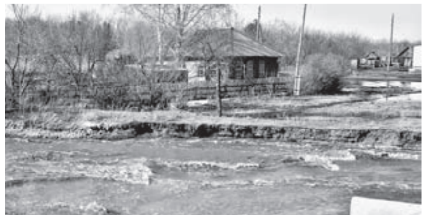
Вода вплотную подошла к домам, но больших бед наделать не успела.