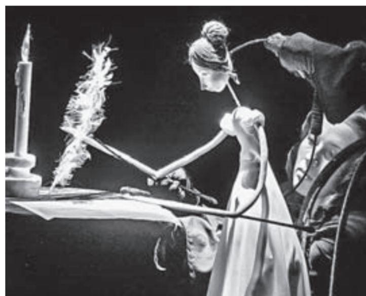
«Я к вам пишу – чего же боле?»

рым мгновенно появляются физиономии досужих деревенских сплетников из папье-маше. Выразительными куклами в театре не ограничились, создав еще и множество масок основных героев, безымянных соседей семейства Лариных и даже самого Пушкина, осеняющего спектакль своим присутствием. Больше всего работа художни-