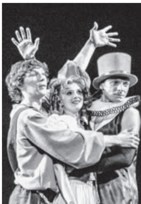
Фото с выставки – фрагмент спектакля театра драмы.