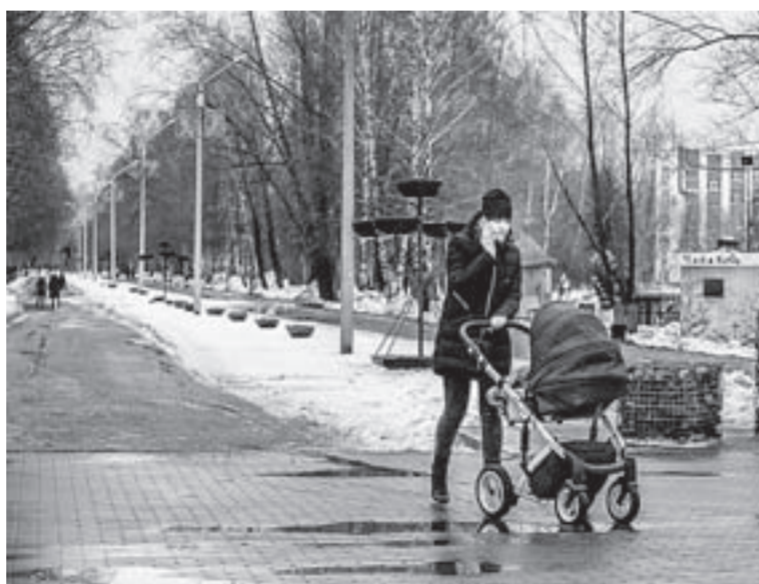
Тан выглядет сейчас аллея Целинников.