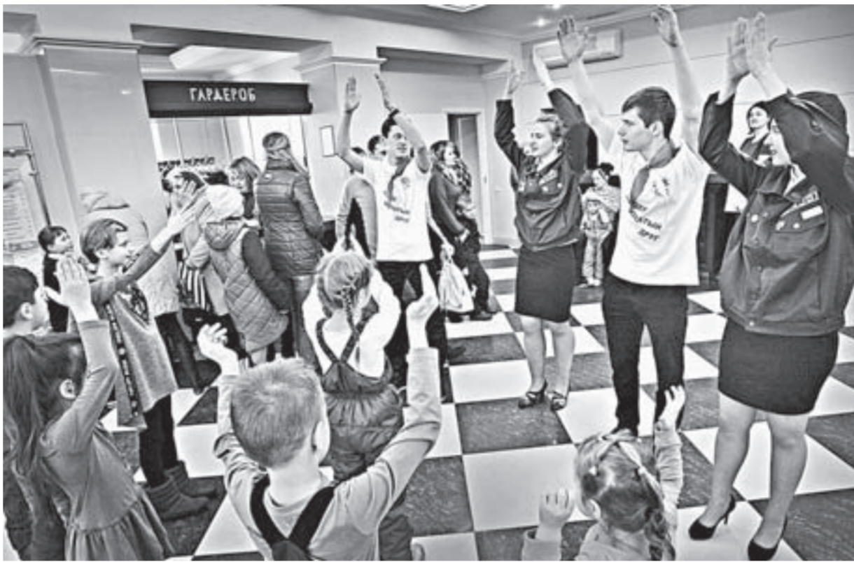
С детьми на празднике поиграли волонтеры краевого подотряда «Ювента».