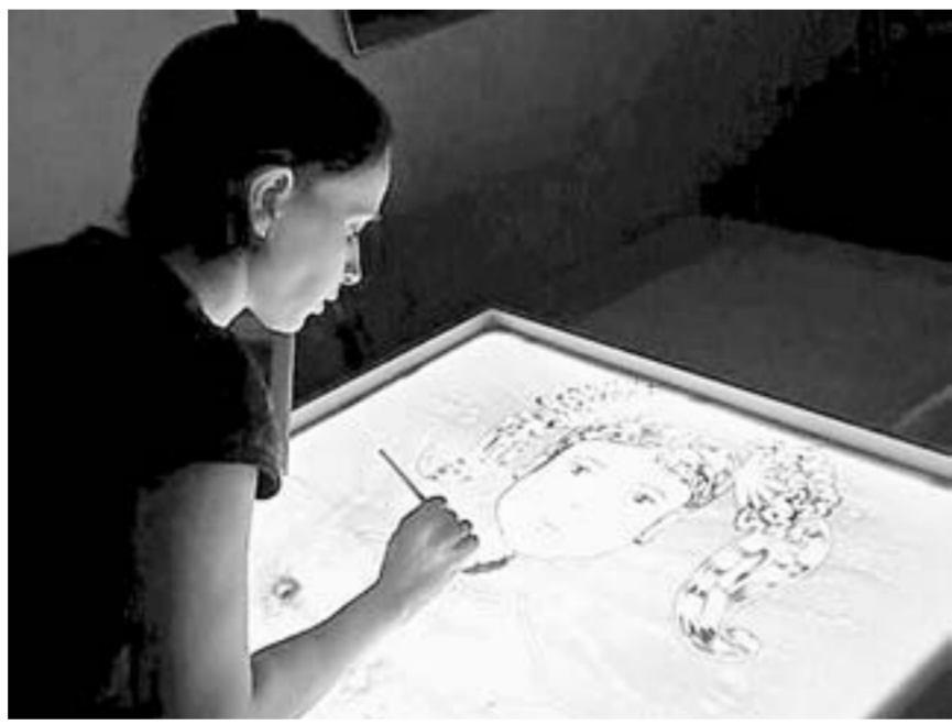
Рисование песком – увлекательное занятие.