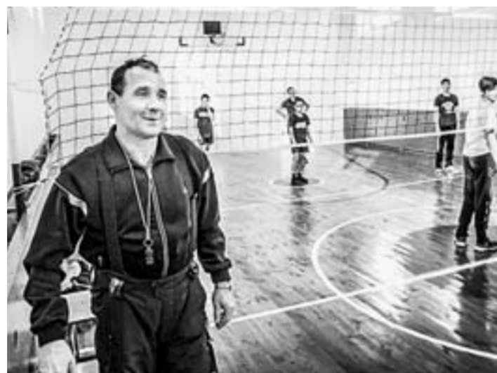
Спортивный зал реконструирован по программе «Детский спорт».

млрд рублей на погашение кредиторской задолженности и муниципального долга. Краевые власти ожидают, что расходование этих средств будет осуществляться с учетом столичных перед краем задач. В том числе это касается исполнения «дорожной карты» повышения заработной платы работников учреждений культуры и педагогам дополнительного образования.