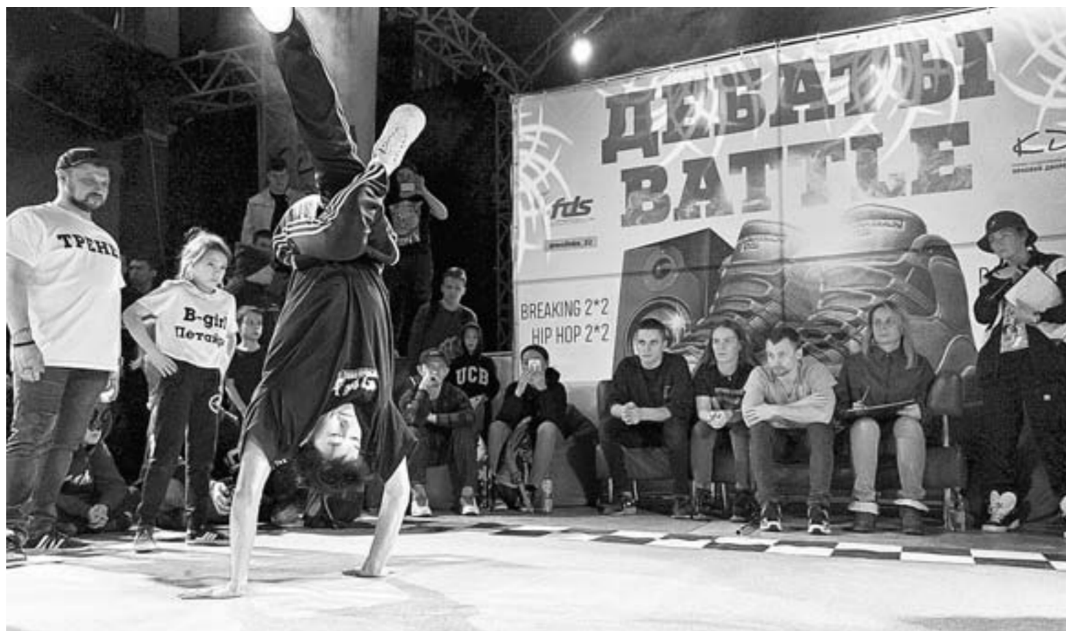
«А вам слабо?»

На фестивале «Дебаты ВАТПЕ» участники выходили парами, в каждой – профессиональный танцор и начинающий. Напарникам