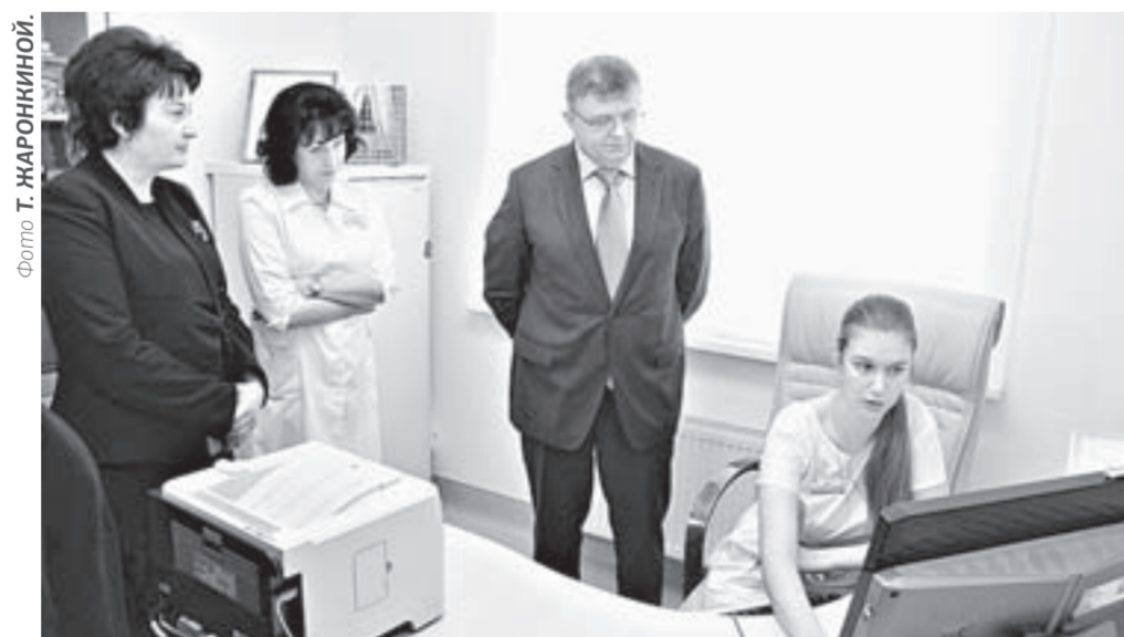
Сергею Краевому показали, как ведется регистр беременных.

Наработки Алтайского края в развитии здравоохранения будут рекомендованы другим регионам России. Об этом заявил заместитель министра здравоохранения Российской Федерации Сергей Краевой, на днях с рабочим визитом посетивший Барнаул.