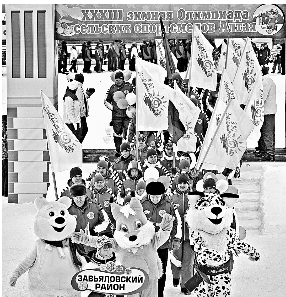
Во время парада команд на церемонии открытия.

В заключительный день Олимпийских игр, когда вся страна радовалась триумфальной победе российских хоккеистов, у нас завершилась своя олимпиада – сельская.