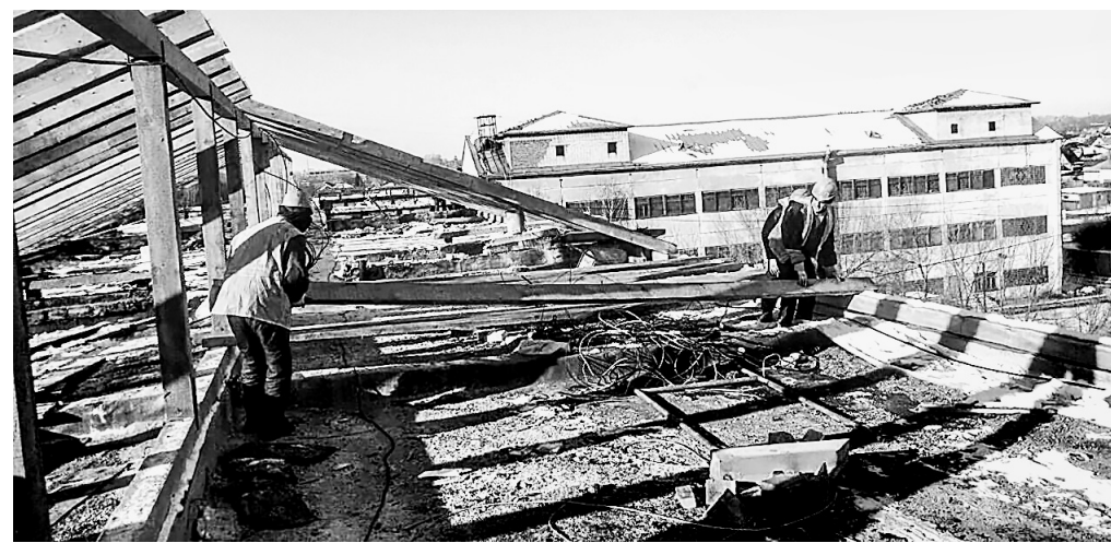
Капитальный ремонт идет в любую погоду.

– Внимательно разобравшись с проектом, сметой, поговорив со специалистами, мы пришли к заключению, что запланированный ремонт плоской кровли эффекта не даст,