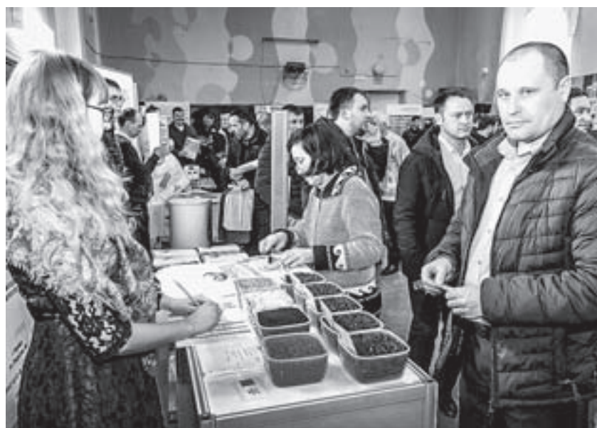
Перед конференцией участники знакомились с новыми сортами культур, изучали элитные семена.