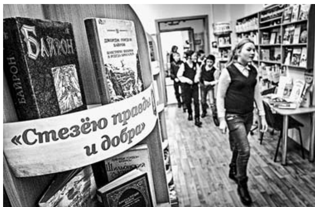
«Иди, мой друг, дорогою добра...»