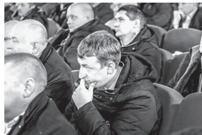
Алтайские ученые познакомили фермеров с новинками агротехники.

– Нашему хозяйству около 50 лет, я руковожу им уже более 10 лет. Мы Америку не открываем. Я начал работать в совхозе «Кулундинский», и у меня там были хорошие учителя. Технологию выращивания культур изучал на практике, в основе своей