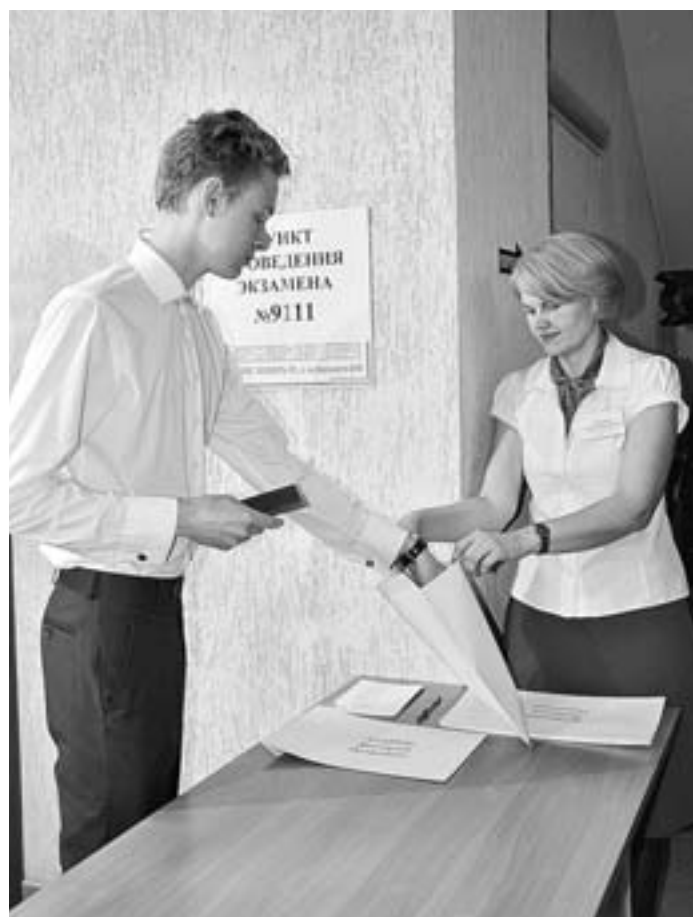
В этот день тесты сдавали в том числе и школьники.