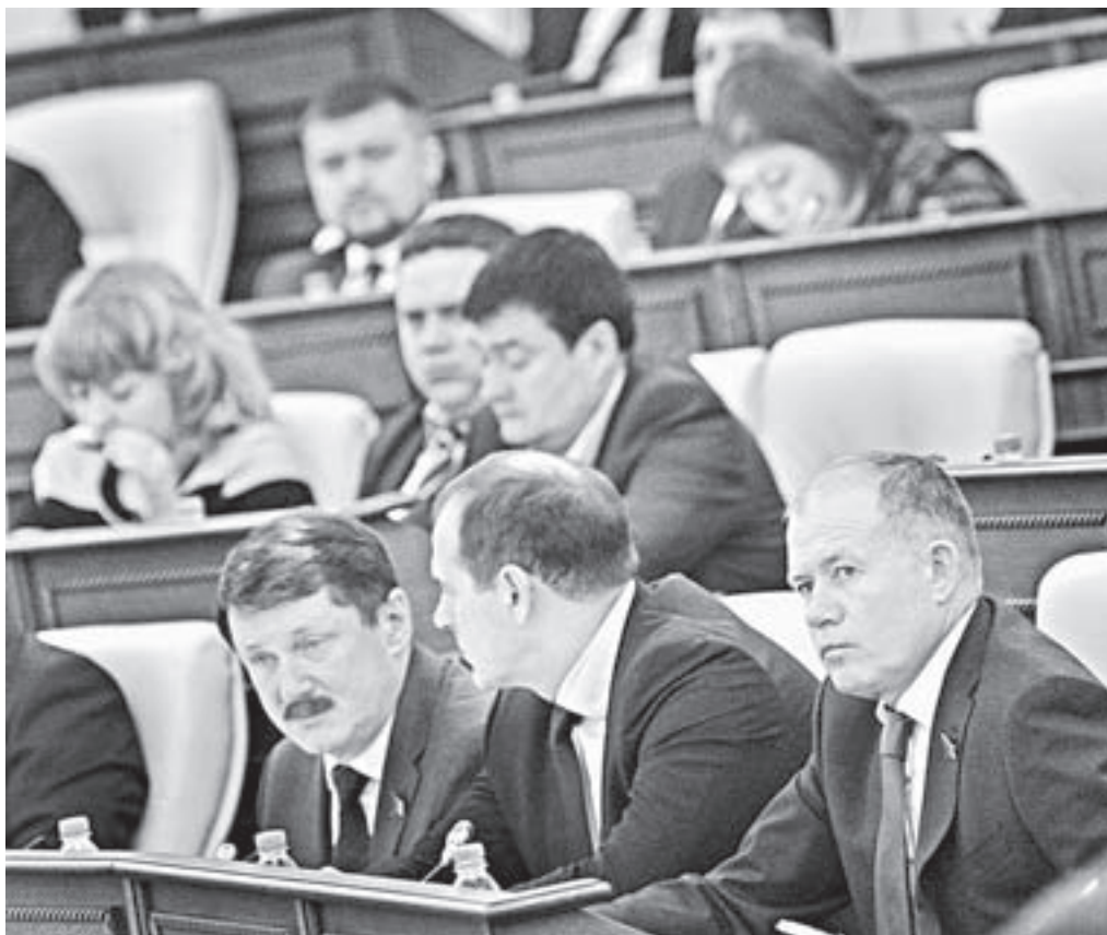
Рабочий момент сессии.

к основным направлениям деятельности относятся охрана общественного порядка при ЧС, проведении спортивных, культурно-зрелищных и