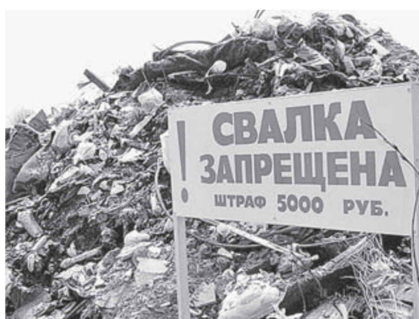
Несанкционированные свалки возникают даже под угрозой наказания.

Результаты анализов почвы на вредные вещества и плодородие в Алтайском крае выявили увеличение нестандартных проб. Во всяком случае, специалисты испытательной лаборатории Алтайского филиала Центра оценки качества зерна в прошлом году обнаружили превышение вредных веществ почти в трехкратном пробах.