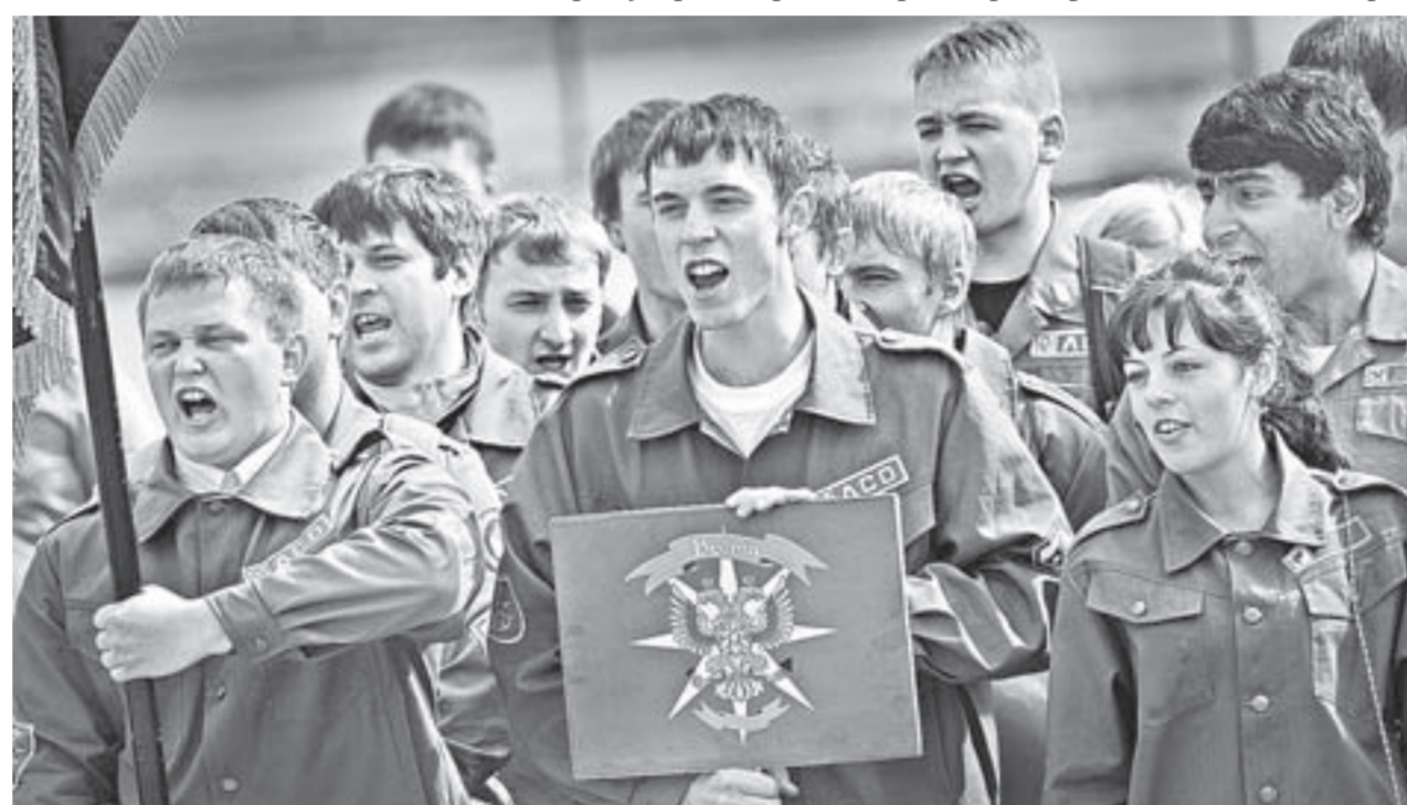
Алтайская стройотрядовская школа – лучшая в стране.

– Наши путинские отряды на Сахалине за два месяца зарабатывают 90–110 тысяч рублей, примерно столько же ежегодно привозят бойцы со Всероссийской студенческой стройки «Мирный атом». В регионе порядка 80 тысяч рублей получают стройотрядовцы, которые занимаются возведением мостов. Заработная плата студентов-экологов за сезон –