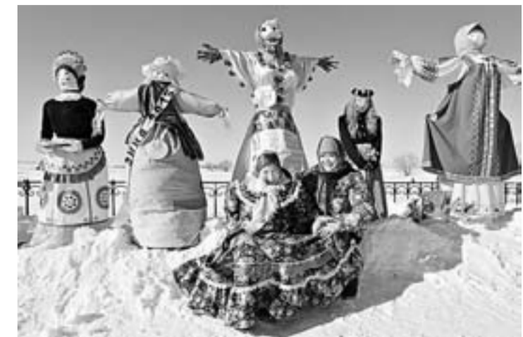
КАТАНИЕ ВЕРХОМ ВОКРУГ ГОРЫ

В Алтайском крае, как и по всей стране, идут масленичные гулянья. Где и как лучше отметить это праздник?