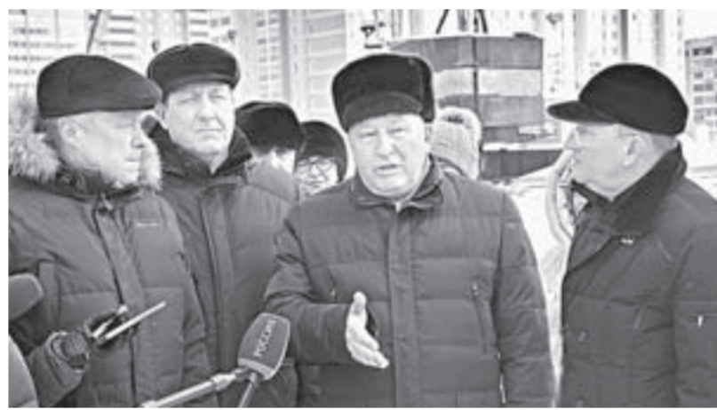
Александр Карлин: «Школы - это не просто планы, а реальный расчет».