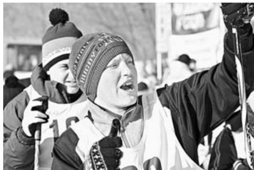
Спортивный праздник вызвал немало положительных эмоций.