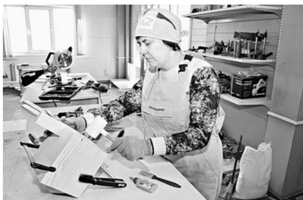
Чтобы деталь вошла в изделие, достаточно киянки.

Первый опыт обращения с пилой показал, что не все так страшно, правда, из-за неумения пристреливаться к размеру две ноги оказались несколько длиннее предыдущих. Но наставник успокоил,