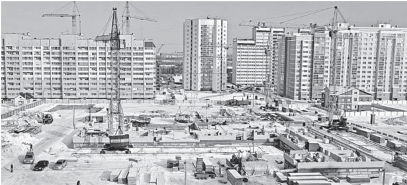
Образовательное учреждение строится в окружении новых домов.

Сергей Дутин поясняет, что три школы будут сдаваться в 2018, 2019 и 2020 годах. На их строительство