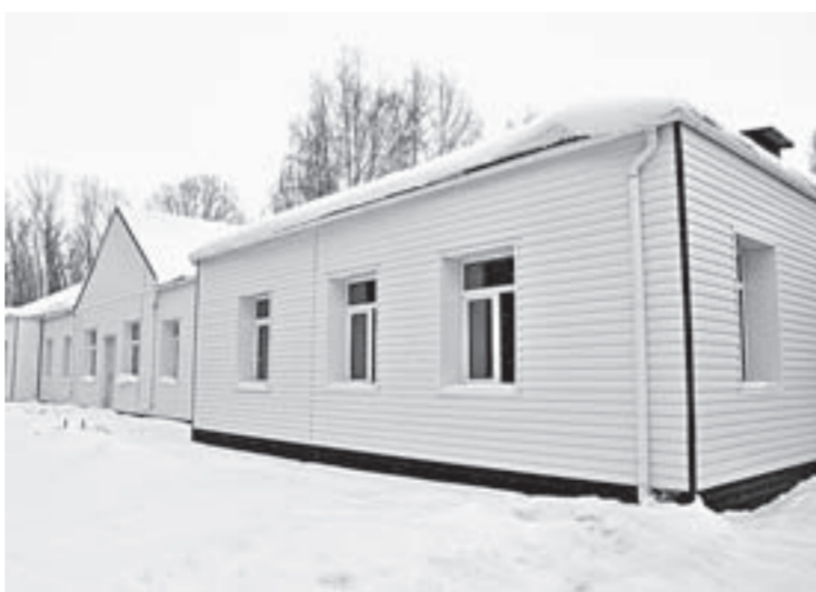
Красиво снаружи, удобно внутри.

Да и вообще за те пять месяцев, что трудились там специалисты новосибирской фирмы «Эквилибриум», работа по благоустройству корпуса была проделана немалая. Проведены штукатурные, малярные и облицовочные работы, уложено на пол более 900 квадратных метров плитки из керамогранита, стены облицованы на площади более 950 квадратных метров, полностью заменены системы водоснабжения, водоотведения и отопления. На каждый радиатор отопления установлен автоматический терморегулятор, смонтирована приточно-вытяжная система вентиляции, что позволило создать оптимальный тем-