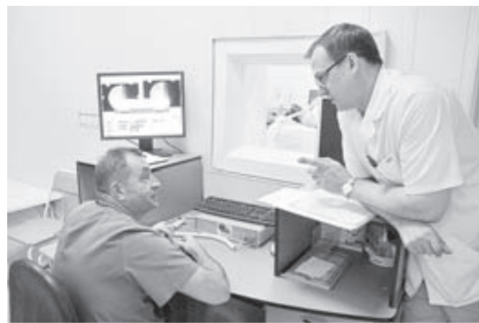
За ходом литотрипсии наблюдают специалисты.

Сегодня речь идет об увеличении доступности литотрипсии. Ведь с тех пор количество