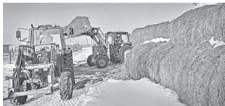
Грубые нормы в хозяйстве заготавливают самостоятельно.