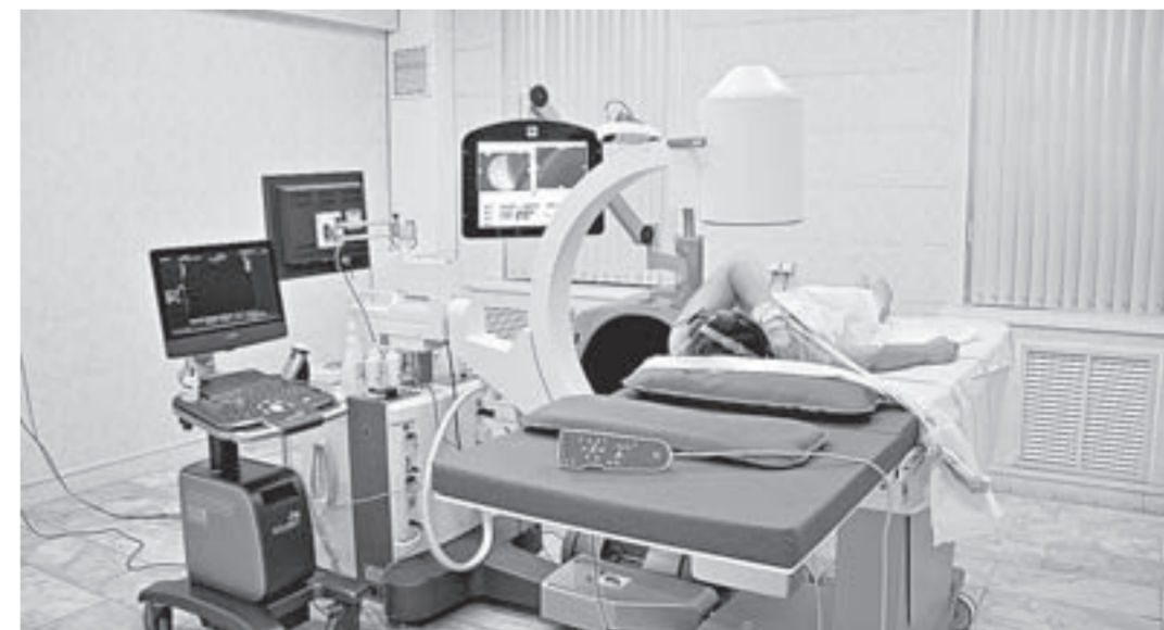
Новое оборудование не имеет аналогов в СФО.

– Дело в том, что один аппарат не закрывает потребности в лечении МКБ методом литотрипсии. Кроме того, он уже отработал пять лет. Моей задачей было подготовить помеще-