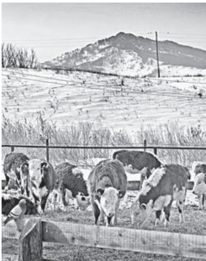
Вдали легендарный Бабьегран.

Сам он родом из Новосибирской области, но после того как выучился в Алтайском аграрном университете на зоотехника, остался в крае да так и прирос к нашим местам. Несколько лет работал в разных хозяйствах по специальности, потом в бизнесе. И вот в 2014 году решил заняться откормом мясного скота. Привел в порядок заброшенную на окраине села ферму, закупил в СПК «Шульгинский» и в хозяйствах Республики Алтай около сотни бычков помеси герфордов и казахской белоголовой, и дело потихоньку пошло. Покупаешь полугодичного теленка килограммов двести, через год он уже перевалил за четырехста. Можно реализовывать на мясо.