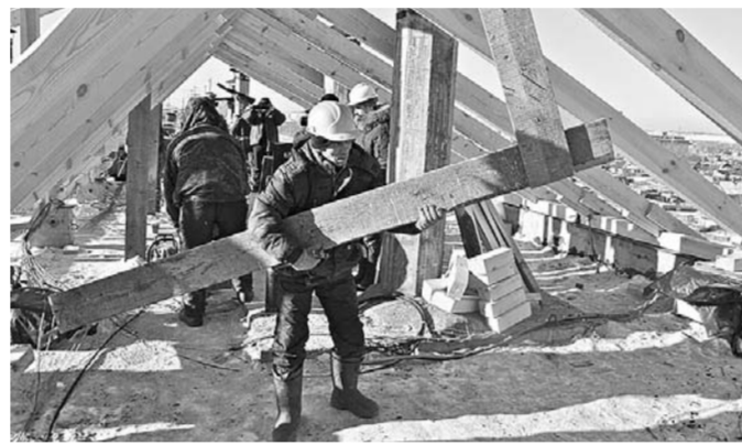
Работа по ремонту кровли идёт полным ходом.