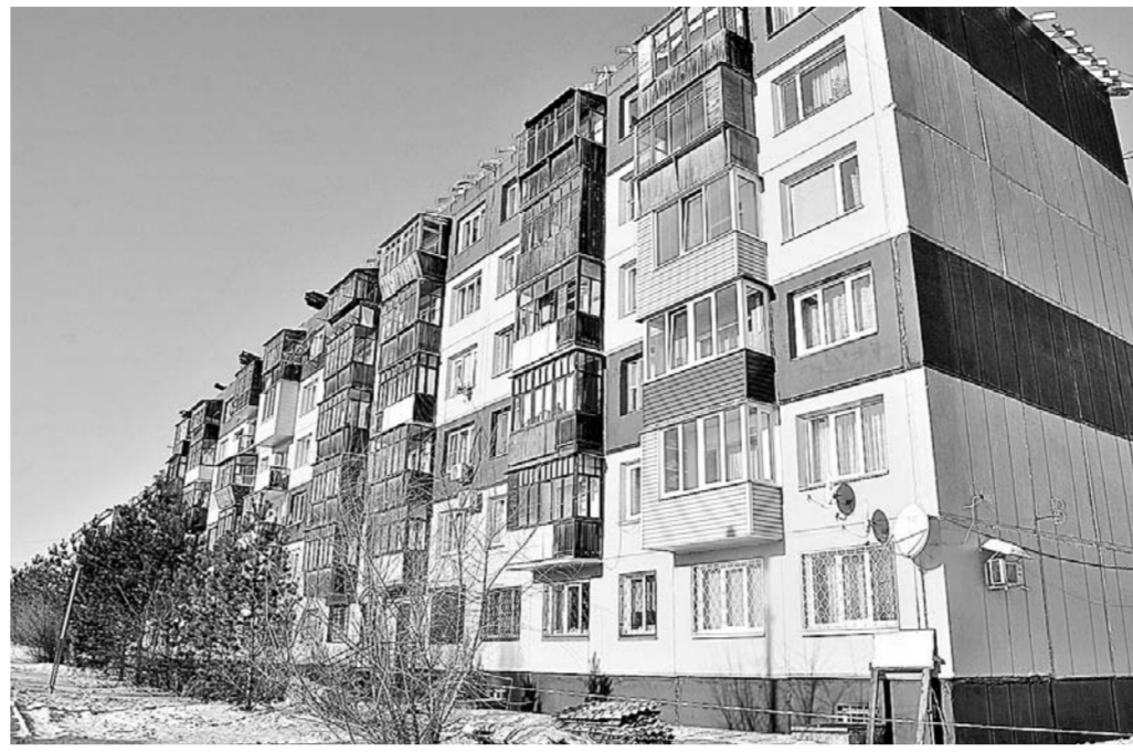
После ремонта шестиэтажка выглядит нарядно.

Эту бийскую шестиэтажку в пос. Котельщиков на ул. Петрова, 35 видно издали. Яркая, красивая, она выгодно выделяется среди рядом стоящих «сестер». Такой «макияж» шестиэтажка получила не так давно благодаря ремонту стен. Строители утеплили все межпанельные швы, обновили фасад, сделали отмостки – в доме стало тепло и комфортно, лишь только состояние крыши беспокоило хозяев. Впрочем, изменения в лучшую сторону для шестиэтажки не закончились.