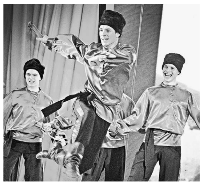
В программе «200 дней бессмертия» участвовали вокальные и хореографические коллективы.