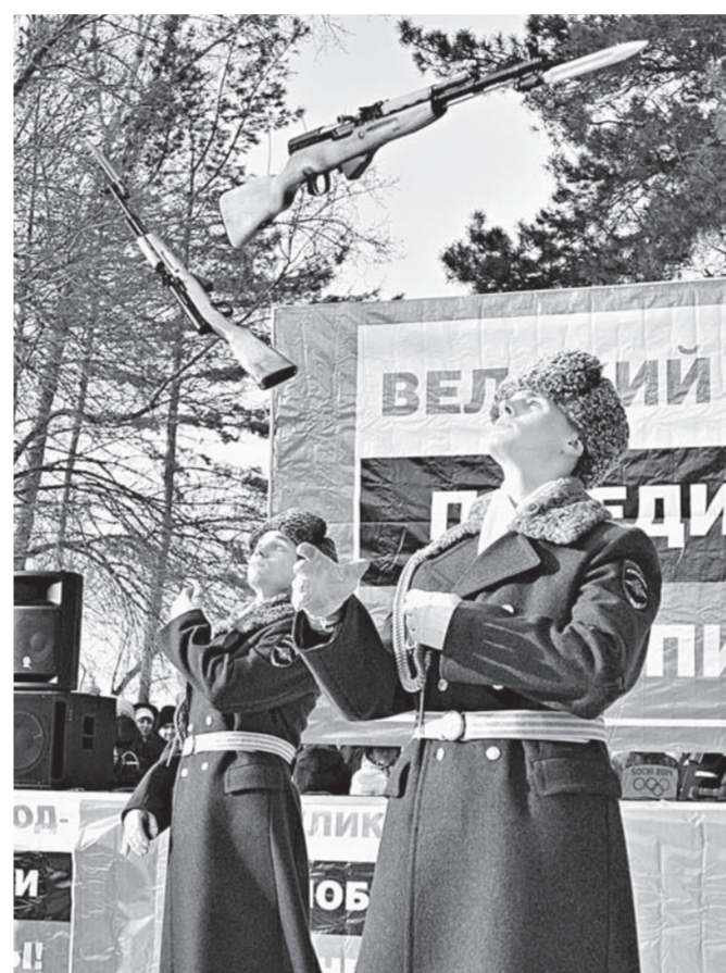
Выступление курсантов БЮИ.