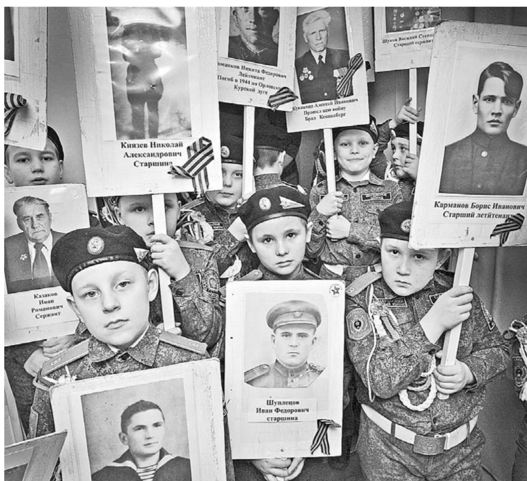
Юные воспитанники Барнаульского кадетского корпуса – участники концерта в АГИК.