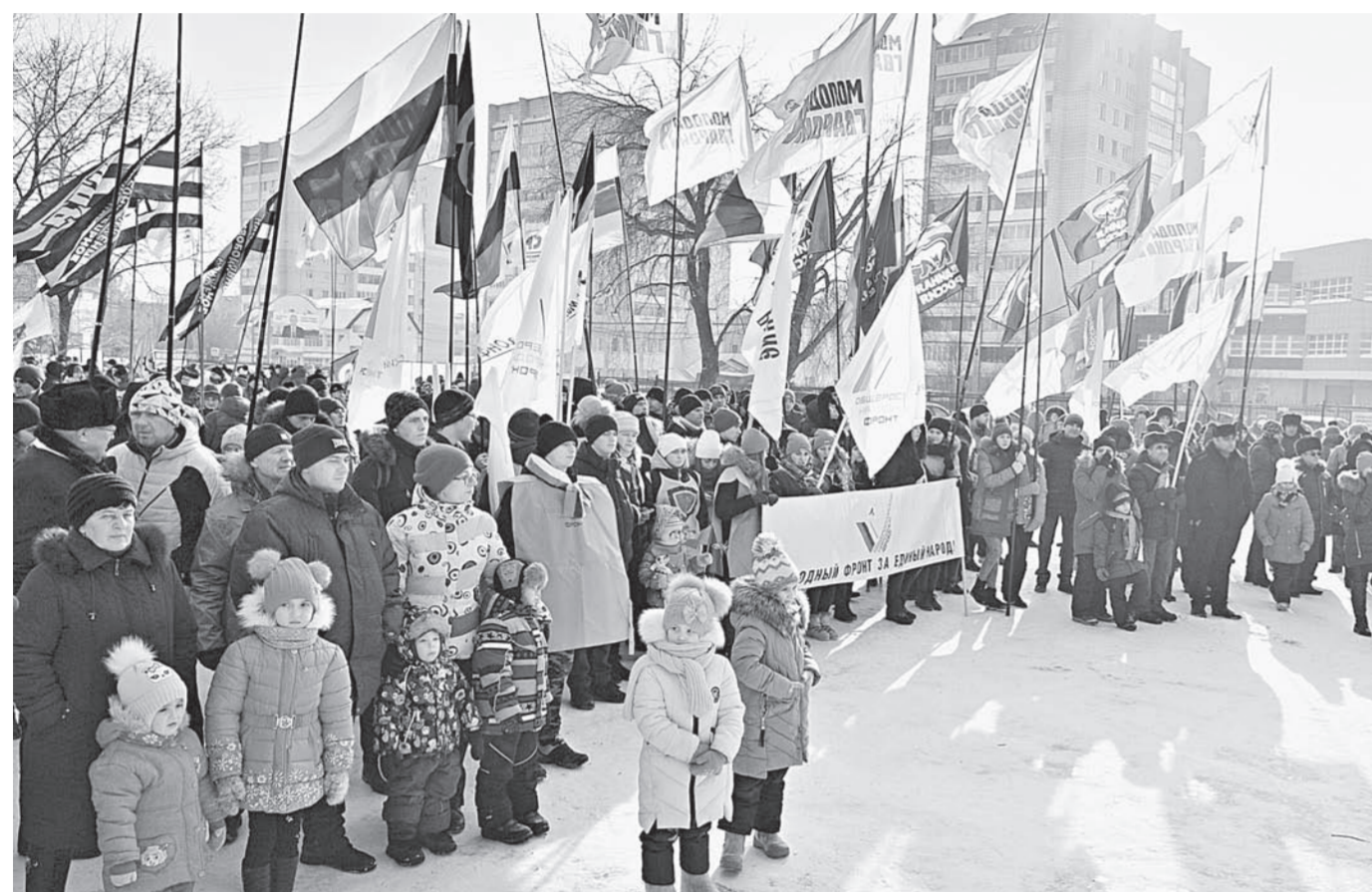
Любовь к Родине – в наших сердцах.