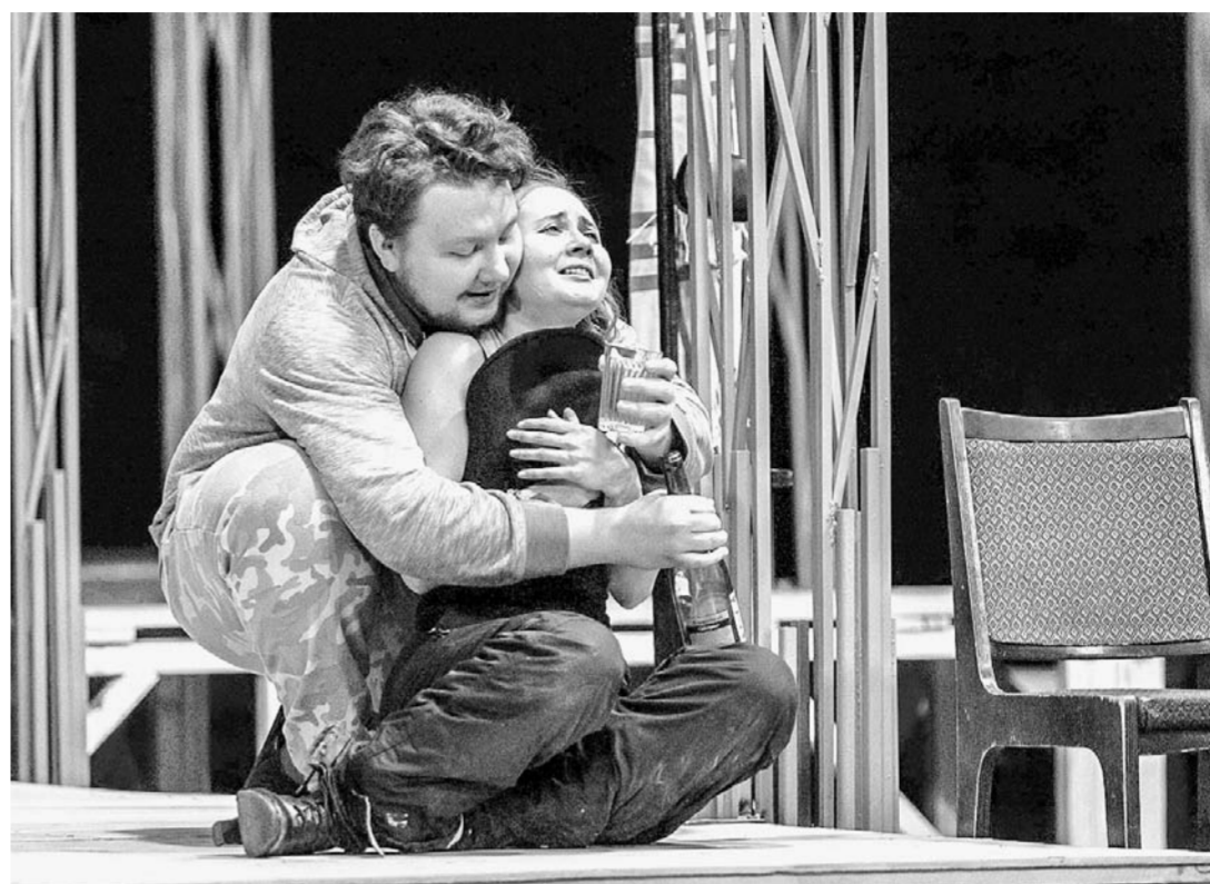
На репетиции спектакля «Темные аллеи».

Сейчас в инсценировке задействовано несколько текстов: рассказы из сборника «Темные аллеи», фрагменты из его записных книжек, стихи. И еще одно великодушное произведение, с которого, на мой взгляд, Бунин нужно