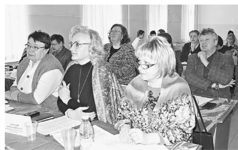
Эксперты программы «Будущее Алтая».