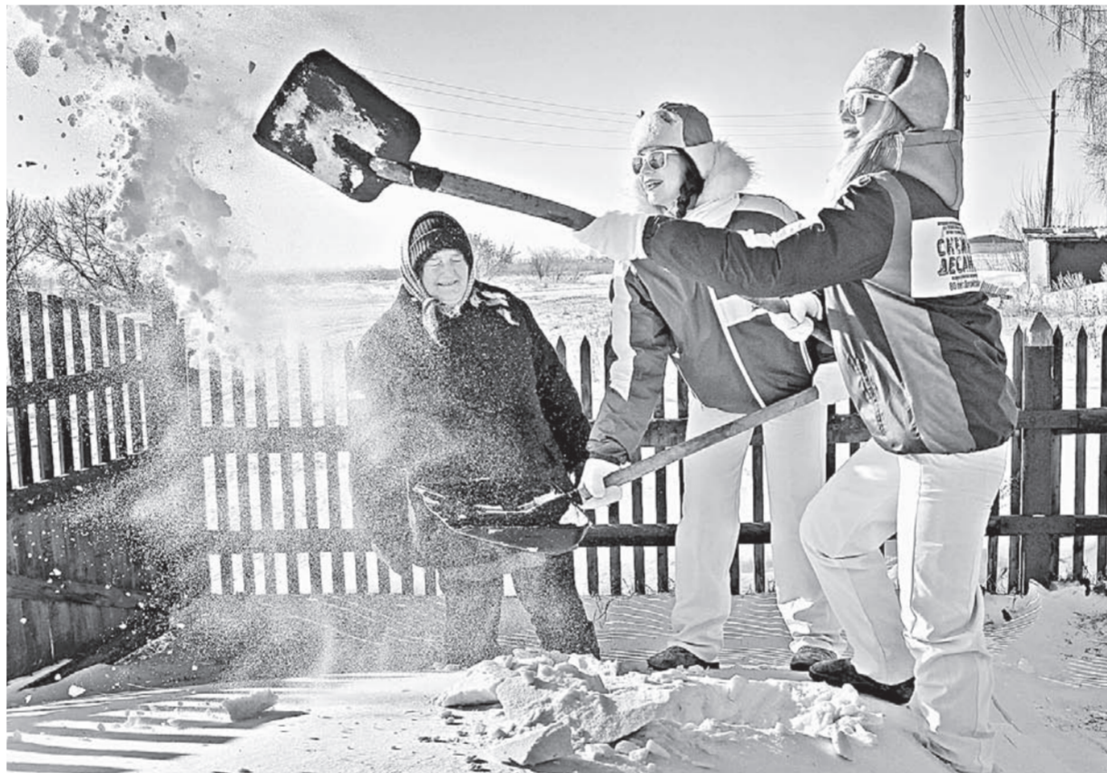
«Десантницы» не боятся тяжелой работы.