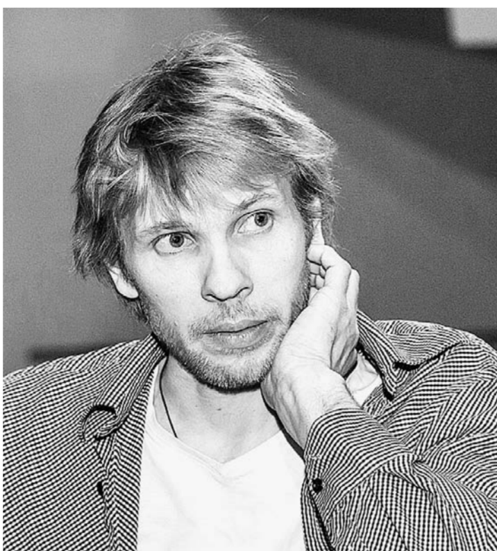
Режиссер Максим Астафьев.

– С прозой интересно очень: во всех этих пейзажных описаниях Бунина или характеристиках героев возникает мир, который ты буквально слышишь.