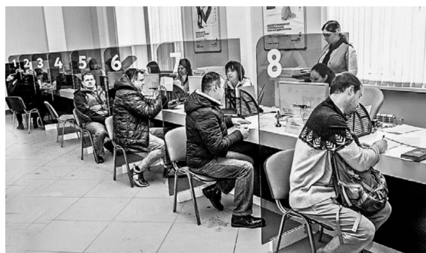
Сегодня в сети МФЦ региона представляют 236 услуг.

Регистрация миллионного пользователя означает, что половина взрослого населения края сегодня имеет возможность получать государственные и муниципальные услуги через Интернет. Для городских жителей это удобно, а для сельских – вдвойне.