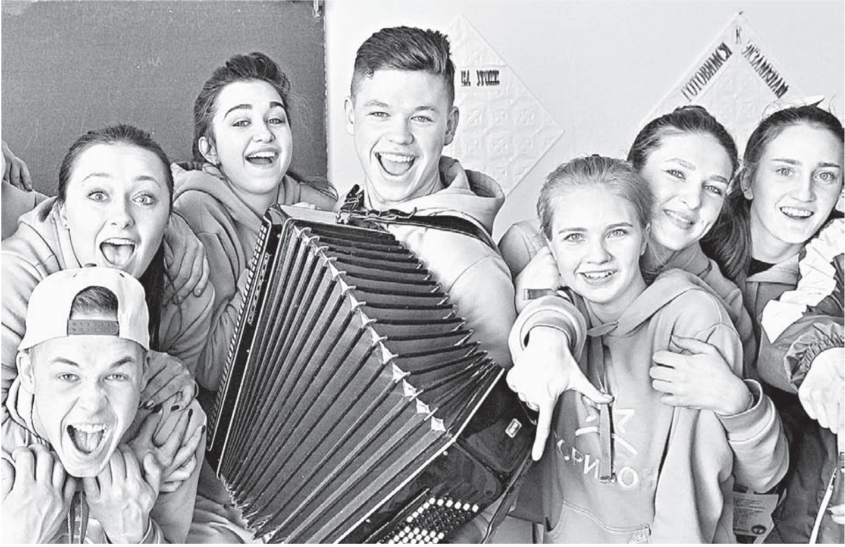
«Эх, разгуляй, русская душа!»