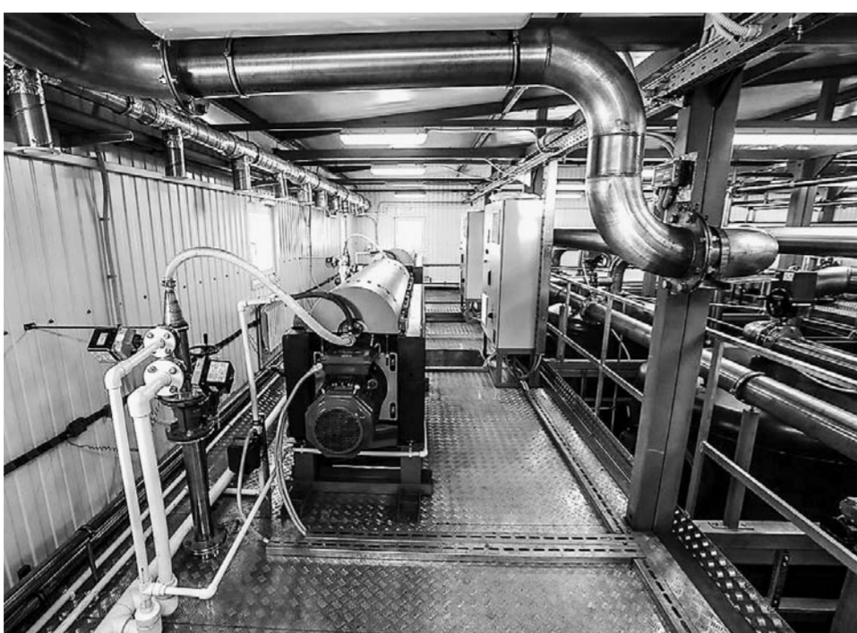
Очистное оборудование внутри комплекса.

В краевом центре на улице Чехова, 26 завершилось строительство уникального комплекса сооружений по очистке талых и ливневых вод. Подобные технологии впервые применяют в Сибири. Аналогичный объект есть только в Сочи – его построили к Олимпиаде 2014 года.