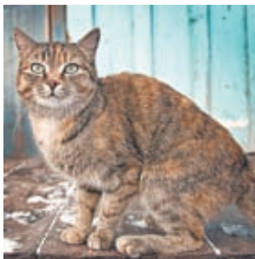
Кошка Бусинка встречает гостей на пороге жилого корпуса.