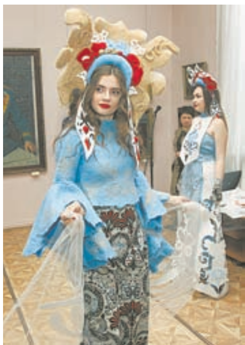
На фестивале можно было увидеть одежду из войлока.