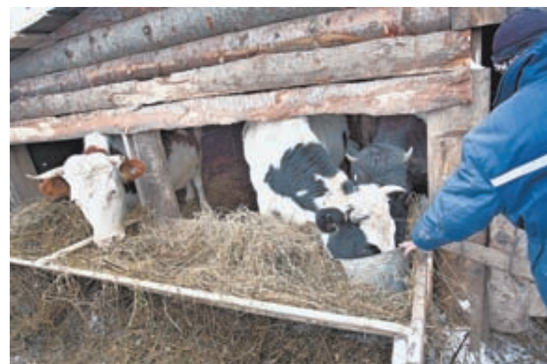
Собственное хозяйство помогает общине обеспечивать себя продуктами питания.

«Не поддерживают дочки связь со мной и вряд ли к себе заберут – зятья не позволяют».