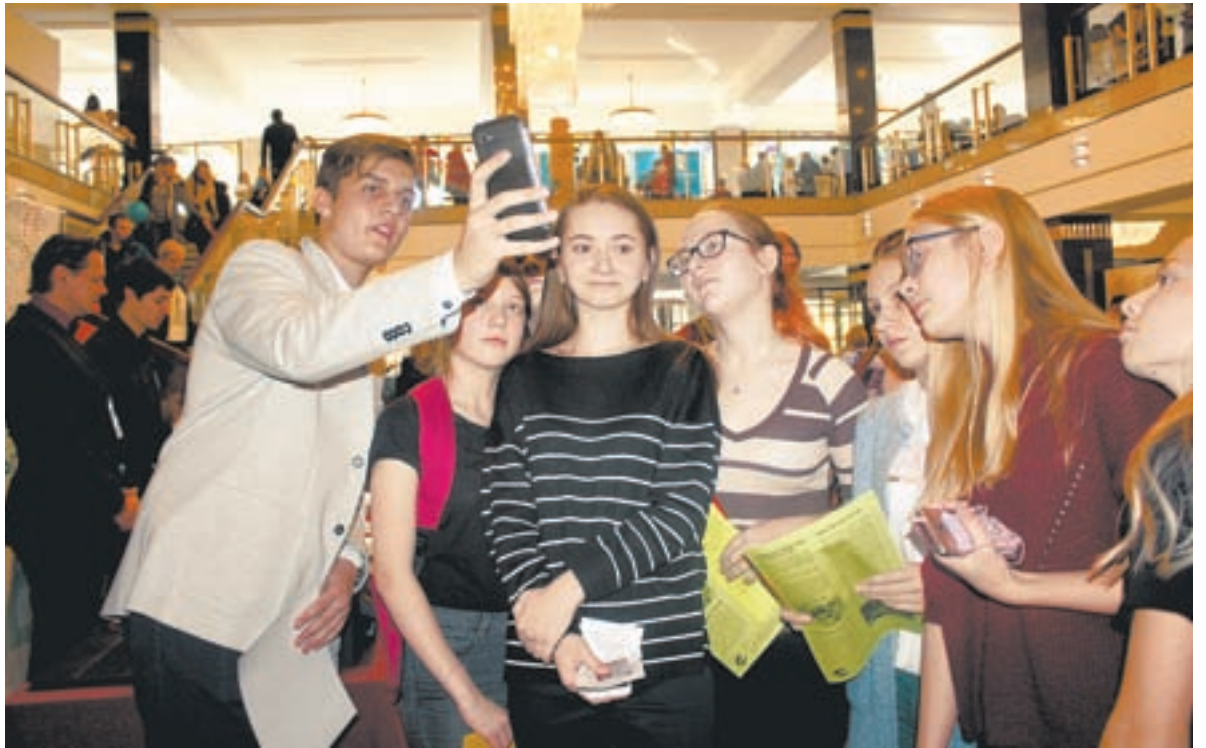
Передовые технологии дополняются знаниями и талантом.

«Пособие по истории очень нужное и появилось вовремя. У коллег, которые с ним познакомились, загорелись глаза», – от-