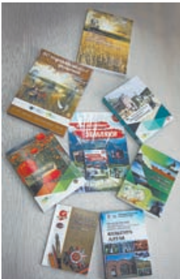
Новые учебники региона ждут учителя и ученики.