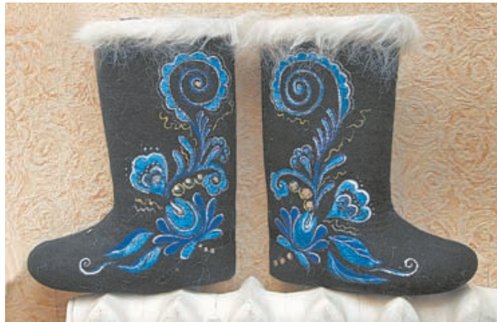
Удобно и красиво.

– Стираю шерстяные вещи в теплой воде, добавляю немного порошка. Сносу нет юбок, футболкам, шляпкам. Осенью сделала разноцветный бактус (треугольный шарф),