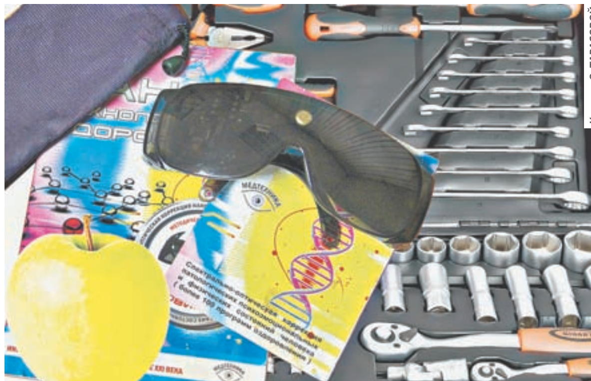
Коллаж О. ТАРАСОВОЙ.

Минули десятилетия. Новое время. Все другое. Сигналит домофон, а через минуту уже зво-