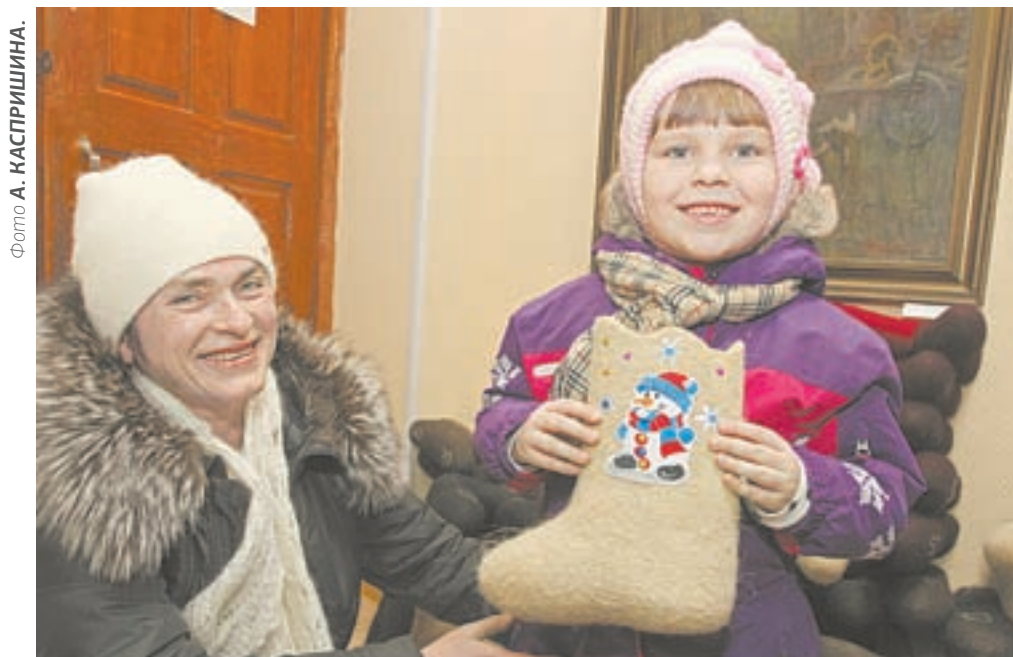
Теплую зимнюю обувь приобрели и детям.