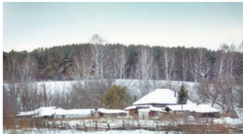
Живописные окрестности Староглушинки.