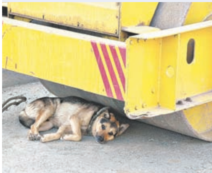
Смотрите, куда собака спряталась от ветра.