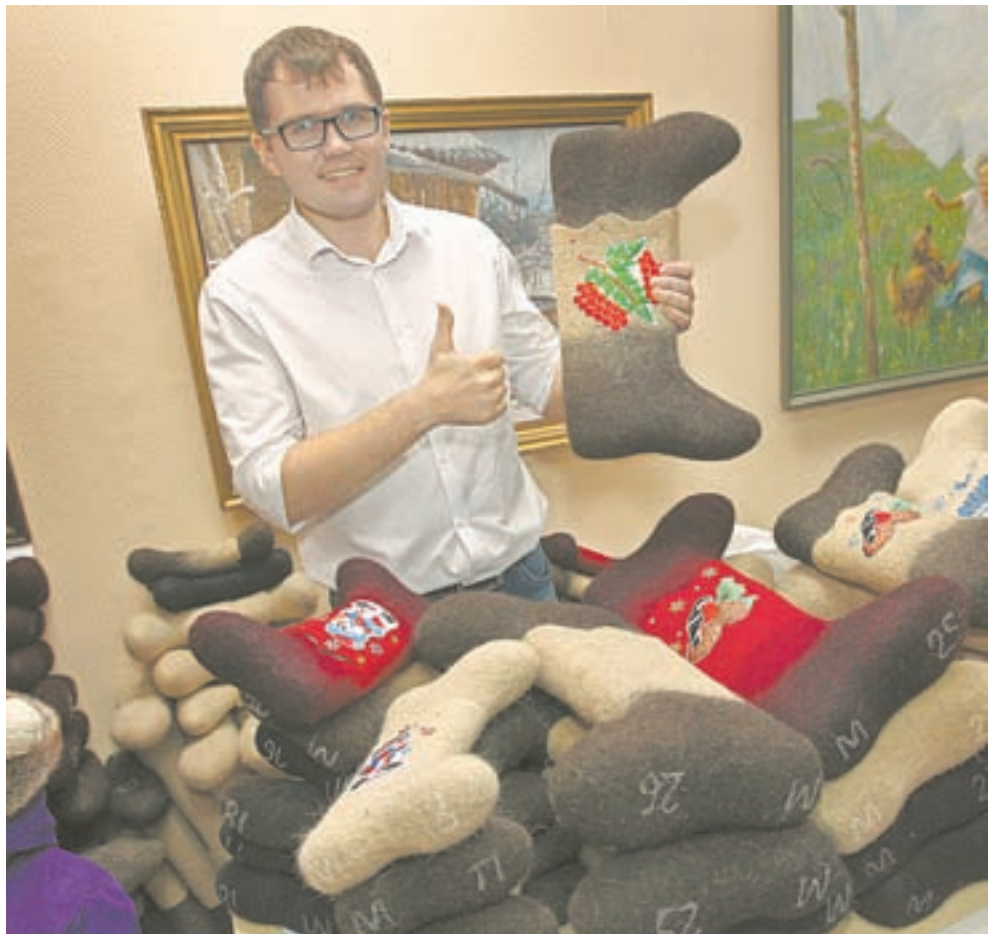
В выходные в музее продавали валенки от алтайских производителей.