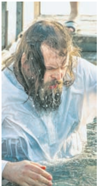
Слава Богу за все!

А вот, например, в Белокурихе омовение можно совершать круглый год. Недалеко от Пантелеимоновского храма находится Глазной родник, рядом оборудовали помещение с купелью. В нем тепло, есть раздевалка, специальные ступеньки, но вода – родниковая, целебная. Купальню регулярно чистят с моющими средствами, следят за состоянием. На Креще-