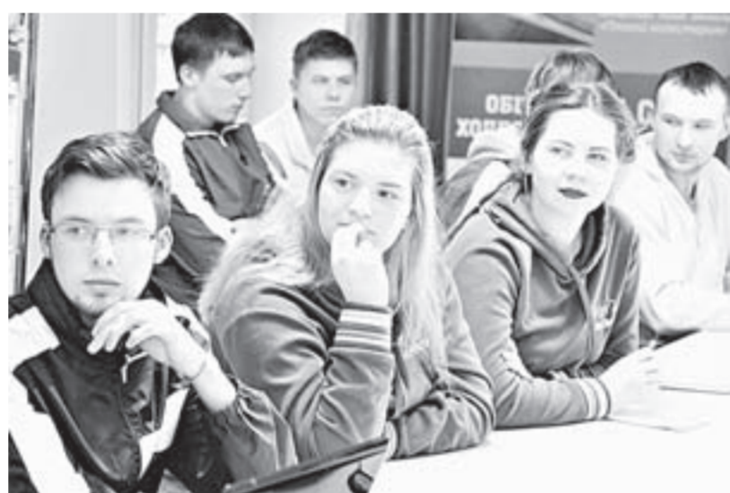
Студентам-медикам рассказывают о вредных привычках и как с ними бороться в молодежной среде.

– Факторов несколько. Во-первых, в будни людям не хватает времени нормально пообедать. Во-вторых, в семьях отсутствует культура питания. В-третьих, в городе много соблазнов – кафе, где продают огромные бургеры, картофель фри, сладкие газированные напитки.