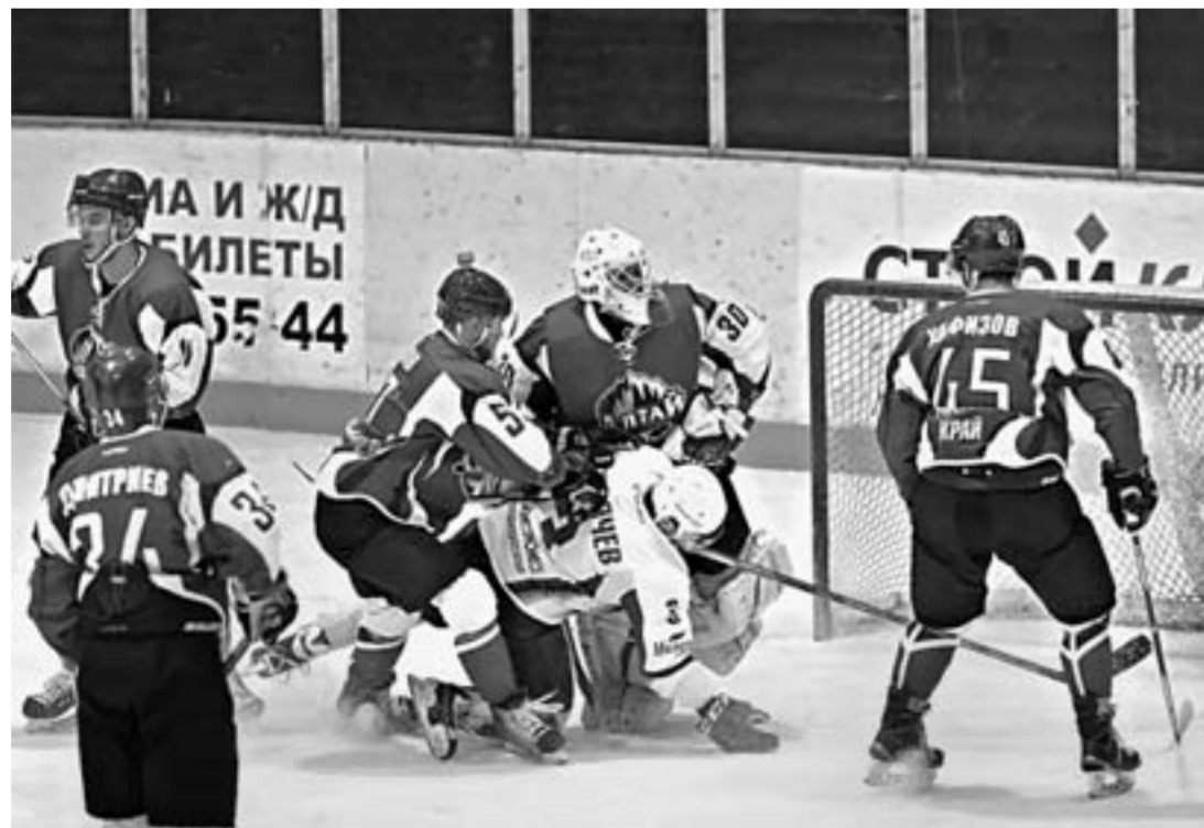
У ворот «Алтая» нередко вспыхивал «пожар».

Второй период также начался с заметного превосходства лидера чемпионата, который мог уйти в отрыв, но барнаульцы проявили нестигаемый характер, отпав в защите. Стоит отметить и надёжную игру 20-летнего голкипера