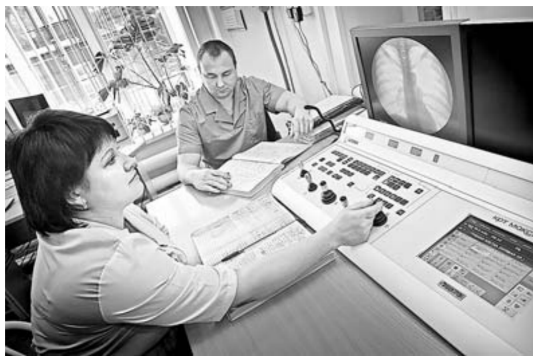
Новые информационные технологии пришли на службу медицине.

Именно этим обусловлено развитие принципов телемедицины в нашем регионе задолго до того, как необходимость ее внедрения была обоснована на федеральном уровне. Еще в 1998 году на базе Алтайского диагностического центра была налажена передача