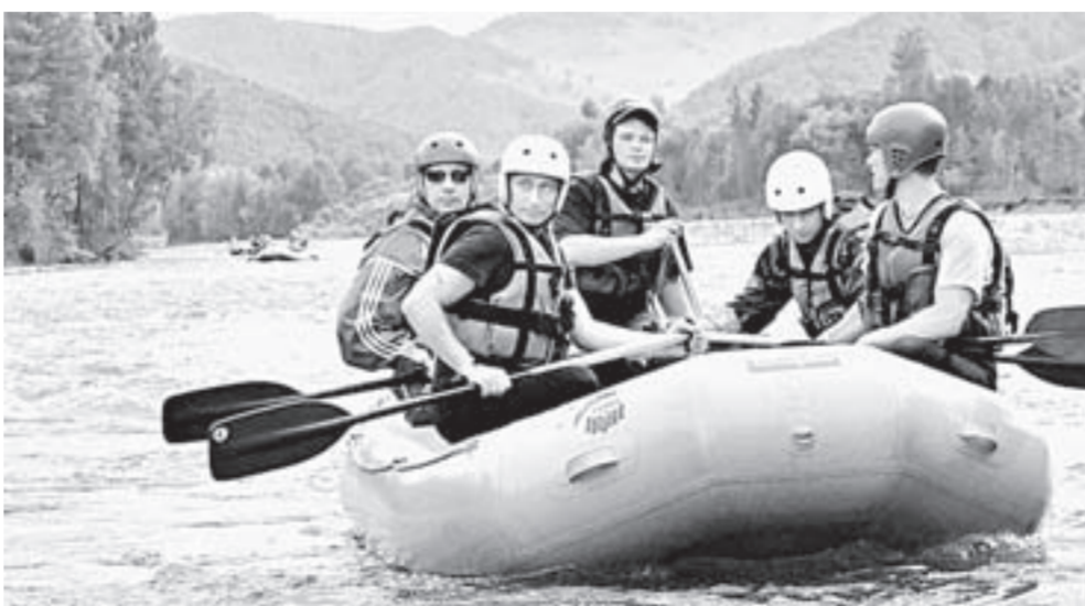
Маршрут, по которому сплавлялся глава государства, сейчас популярен среди туристов.