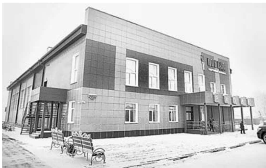
Спортивный комплекс «Победа» работает с самого утра и до позднего вечера.