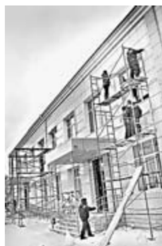
Ремонт фасада здания номината социальной защиты населения.

ем то, что имеем, и качество работ при этом не снижаем.