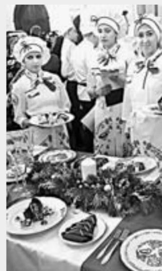
Сервировка стола алтайской командой полностью отпраздновала тему Рождества.

Команда Алтайского края заняла первое место на Международном молодежном гастрономическом фестивале «Возрождаем традиции. Рождество», который проходил 12 января в Москве.