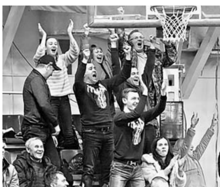
Болельщики «Университета» ликуют.

Серебряный призёр высшей лиги «А» тоже не может в нынешнем сезоне похвалиться стабильными результатами. Не прибавляет оптимизма и непростое финансовое положение «Универса», а также кадровые проблемы: в лазарете из-за травм перед от-