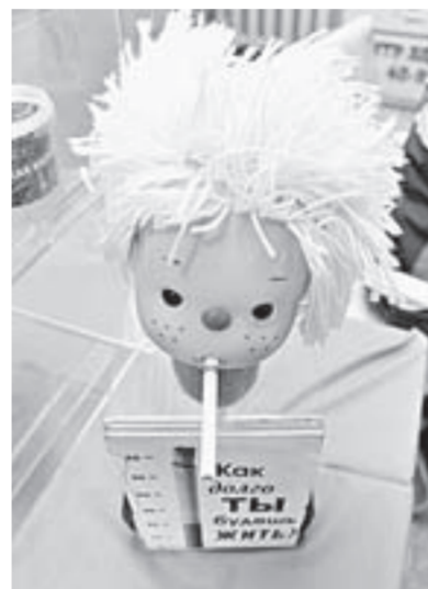
Кукла для демонстрации вреда курения.