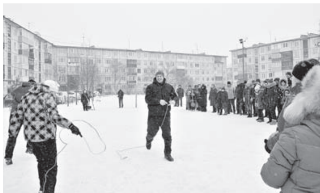
На снегалке по снегу – не просто, зато весело!