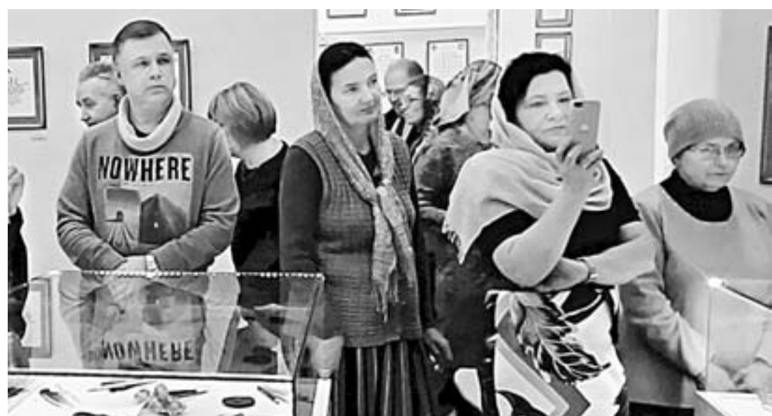
Бийчане с интересом знакомятся с экспонатами.

В Бийске начал работать единственный в Сибири центр каллиграфии. Его открытие состоялось накануне празднования Нового года в старинном здании бывшего миссионерского катедрального училища, расположенного на Архерейском подворье.