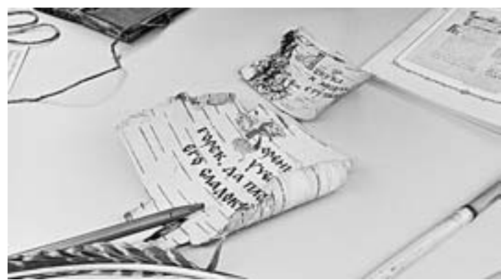
Первый «мессенджер» – берестяная грамота.

В Бийске начал работать единственный в Сибири центр каллиграфии. Его открытие состоялось накануне празднования Нового года в старинном здании бывшего миссионерского катедрального училища, расположенного на Архерейском подворье.