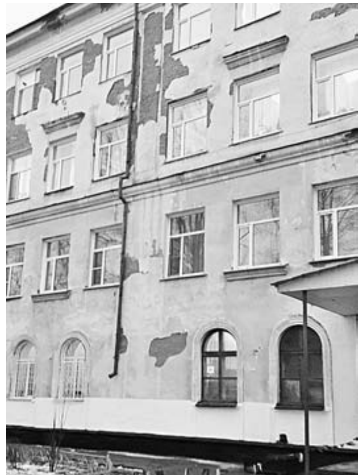
Фасад лицея № 6 вызывает опасения.

Лицей № 6 в Рубцовске считается одним из самых престижных в городе машиностроителей. Школа первой еще в советское время вела профильное обучение, у нее всегда был физико-математический уклоном. Родители со всего города старались пристроить свое чадо в шестую школу, ибо знания, которые давали и дают здешние преподаватели, отличаются особой прочностью и качеством.