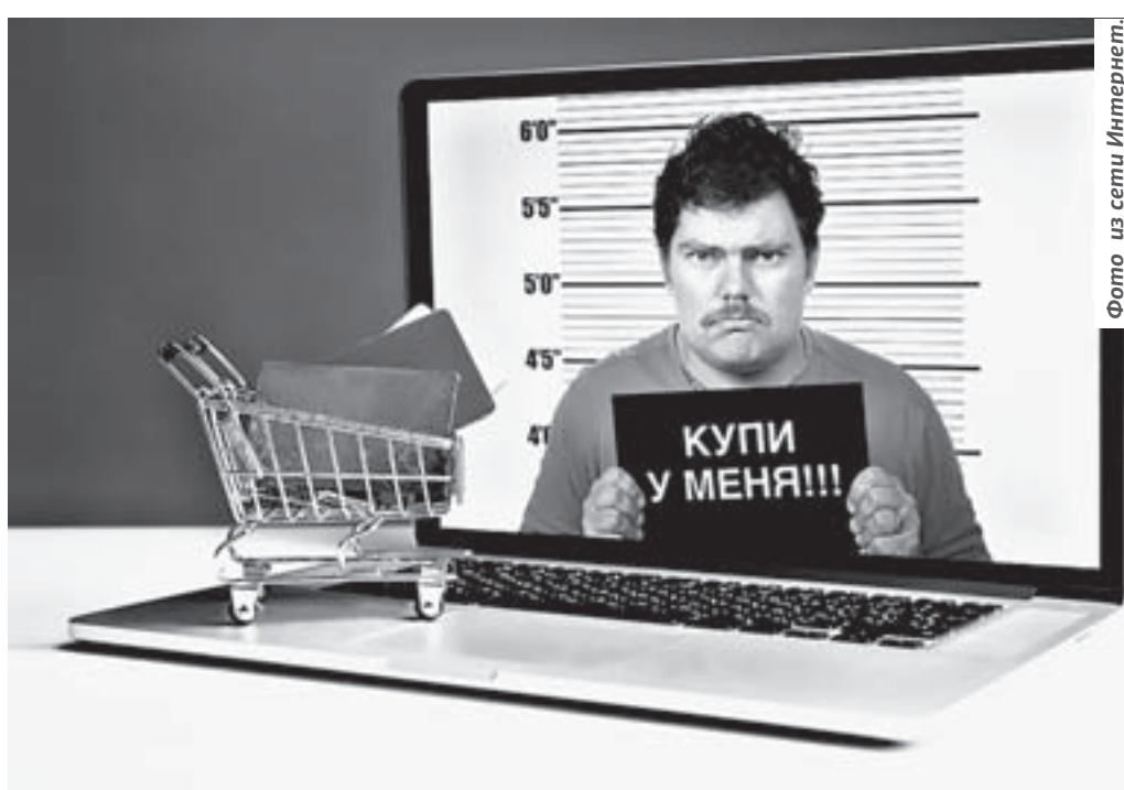
Продажа или покупка через Интернет – распространенный вид мошенничества.

Как рассказали «Алтайской правде» в ГУ МВД России по краю, практически две трети мошеннических преступлений в минувшем году совершены дистанционным способом, с помощью телефона или интернет-технологий – всего 2050 фактов. Самый распространенным видом остается продажа товаров или услуг на популярных сайтах – 988 случаев. По схемам «ваш родственник попал в беду, для решения проблемы с полицией необходимо перечислить деньги на определенный счет» зарегистрировано 269 преступлений, «СМС-рассылка – ваша банковская карта заблокирована» – 141 факт. Еще 65 случаев, когда мошенники по телефону представляются руководителями полиции, прокуратуры, судов, администрации и под предлогами трудоустройства на работу или выполнения каких-либо договорных обяза-