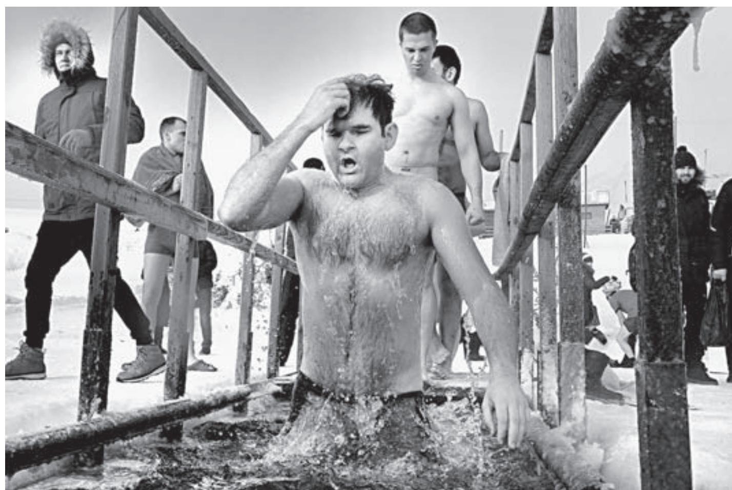
Ежегодно в Крещение на Обь приходят тысячи людей.

Праздник Богоявления начинается с навечерия, которое случается 18 января. Затем идет вечерня с Божественной