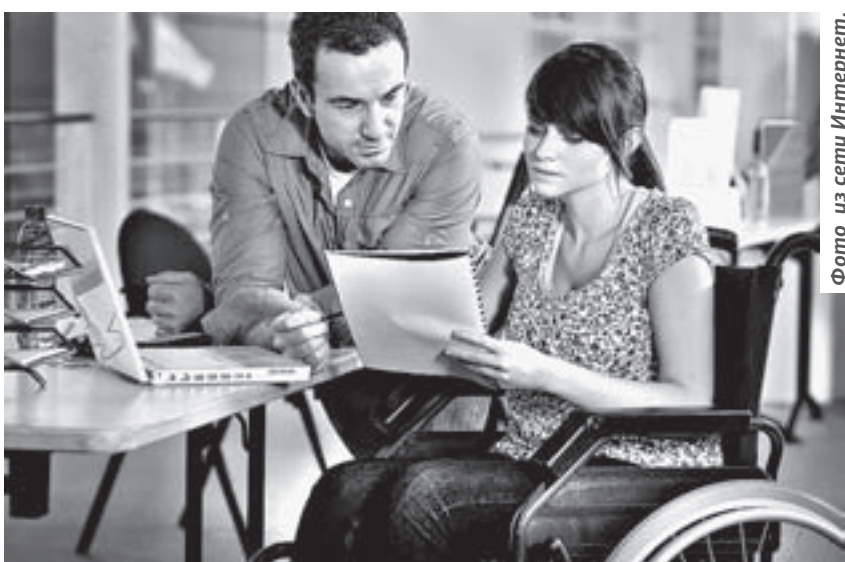
Фото из сети Интернет.

Министр юстиции уточнил, что не все категории могут получить бес-