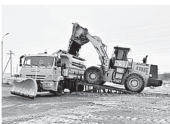
Погрузка песко-соляной смеси.

– Процентом на двадцать меньше, чем прошлой зимой, щедрой на осадки, – отметил Александр Худышкин. – Но,