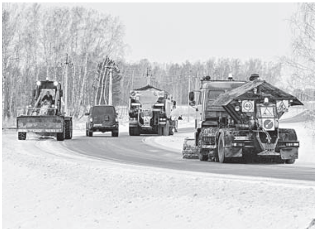
Дорожная техника в гаражах не застаивается.

– 11 января была плохая видимость на трассе, гололед, несколько машин на северо-восточном направлении слетело в кювет, одну такую, грузовую «Газель», сам видел в Косихинском районе.