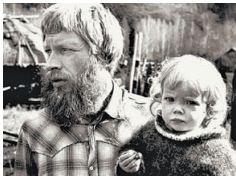
Жизнь в тайге или горах трудна.

Вы не поверите, но на ту встречу по поводу 280-летия поселка собралось 80 человек! Вот только «в связи с труднодоступностью и удаленностью» Андреевского её провели в кафе в... Змеиногорске.