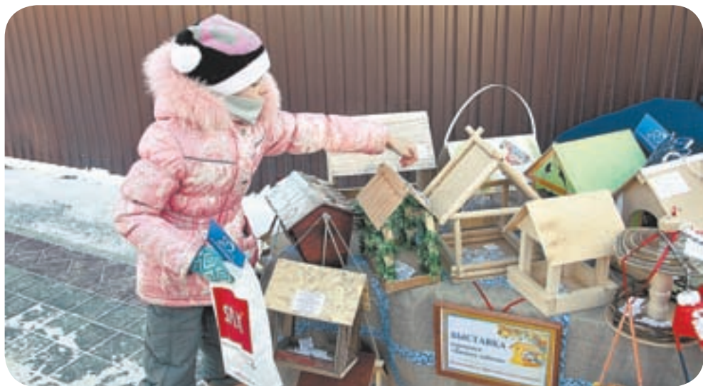
Идет народное голосование.

«Алтайская правда» и гости «Алтайской зимовки» определили победителей конкурса кормушек для птиц «Зимние заботы». Выставка авторских столовых для пичуг стала одним из самых притягательных мест для участников праздника, открывшего зимний туристический сезон. Они активно голосовали за приз зрительских симпатий и приносили угощения в дар пернатым.