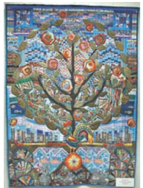
Панно работы Татьяны Горбуновой.