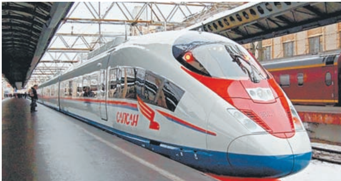
В России высокоскоростное движение налажено между Москвой и Санкт-Петербургом.

В третий как раз включают участок Новосибирск – Барнаул. Он пройдет через Курган до Омска, дальше дорога повернет на Ново-