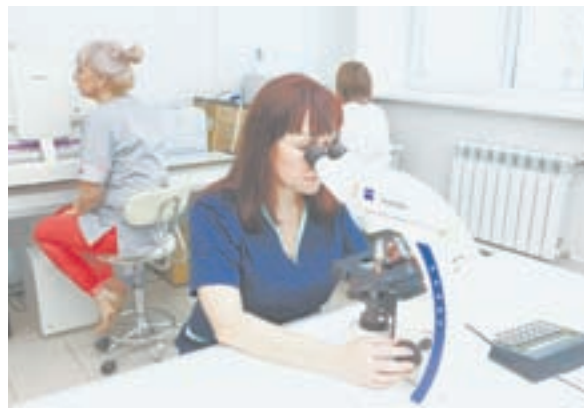
Достоверная диагностика начинается в лаборатории.

– Часть нынешних пациентов отделения – люди, заболевшие лет 15-20 назад, а часть – молодые люди, инфицированные в салонах тату, маникюра и педикюра. Чтобы не стать жертвой моды, пользуйтесь услугами мастеров, стерилизующих инструменты по нормам, утвержденным в лечебных учреждениях. Увы, актуальной остается проблема наркома-