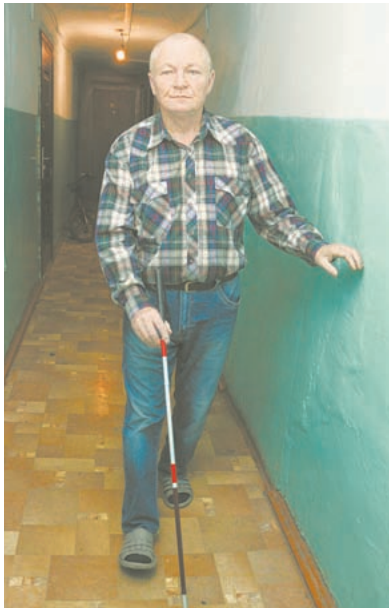
Александр Владимирович пишет во все инстанции, чтобы добиться положенной по закону благоустроенной квартиры.