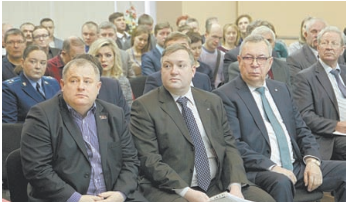
Представители предпринимательских объединений внимательно слушают выступления чиновников.

Сославшись на опыт других регионов, Юрий Фриц предложил