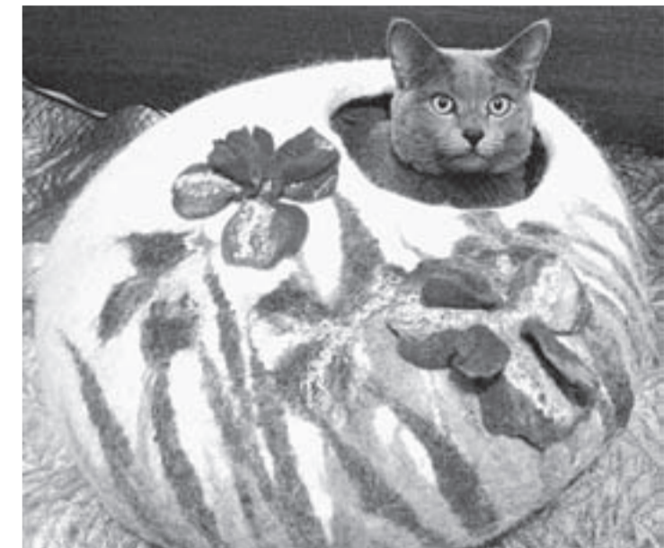
Домик ручной работы для питомца. Выставка «Шерстяные каникулы» в Художественном музее.

Интерактивный фотопроjekt «Парфюмер» (18+). Фотографии в жанре ню, а также ароматы, раскрывающие или парадоксально меняющие идею снимков.