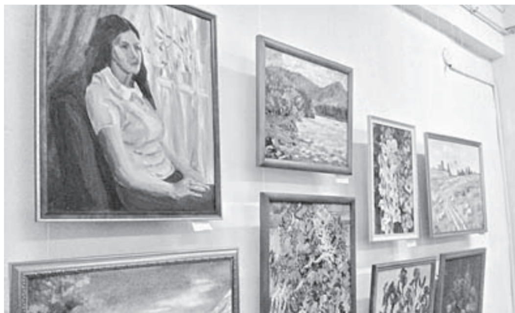
На выставку бийских мастериц поступило более 500 работ в самых разных жанрах.

В шестой раз в Бийске начала работать выставка «Восславим женщину... Чудо рук женских». Торжественное открытие прошло в выставочном зале краеведческого музея им. В. Бианки.