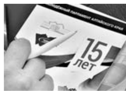
Нам - 15 лет.