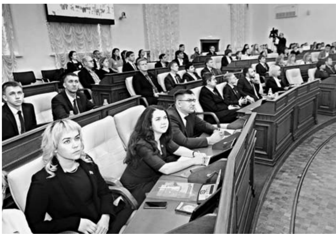
Молодежный парламент Алтайского края считается одним из лучших в стране.

— Здесь ребята получают первые навыки своего общественного позиционирования, — сказал на мероприятии, посвященном 15-летию