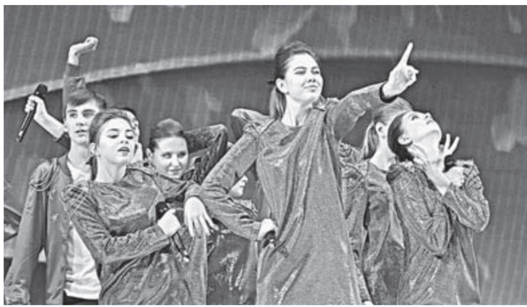
На сцене – только победители «Золотой ноты».