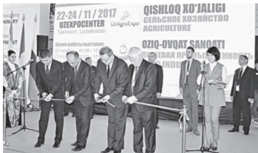
Открытие выставки в Ташкенте.

Более 10 узбекских предприятий выразили заинтересованность в поставках продукции алтайской компании «ТехноЛиги без границ»: оборудования и производственных линий для переработки растительного сырья, производства пищевых продуктов, функционального питания и косметики.