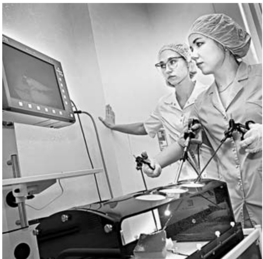
Ординаторы учатся владеть лапароскопом – пока на тренажере.

– Очень хорошо, что открылся такой кабинет. После выписки у нас возникало очень много вопросов, поскольку ребенок был недоношен-