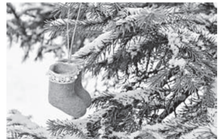
Мастер-класс по изготовлению сувенирных валенок пройдет в Художественном музее.

«О времени и о себе» – выставка к 85-летию со дня рождения художника Виктора Попкова (0+).