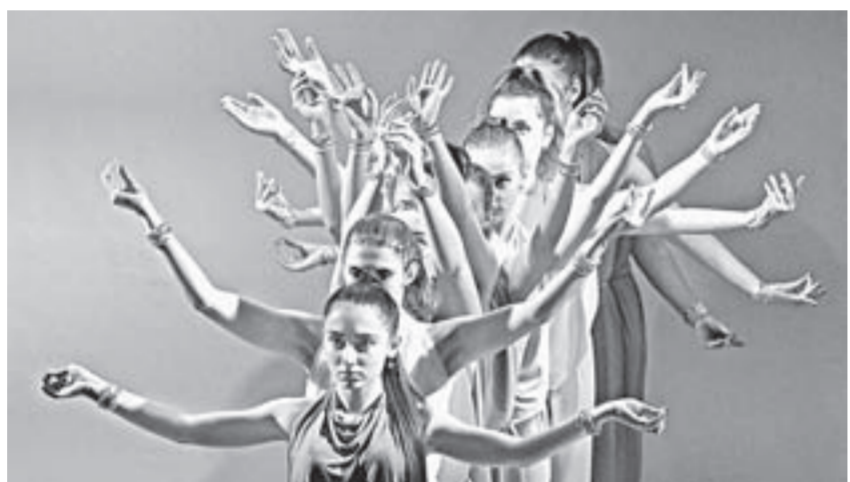
Конкурсанты представили разные танцевальные направления.