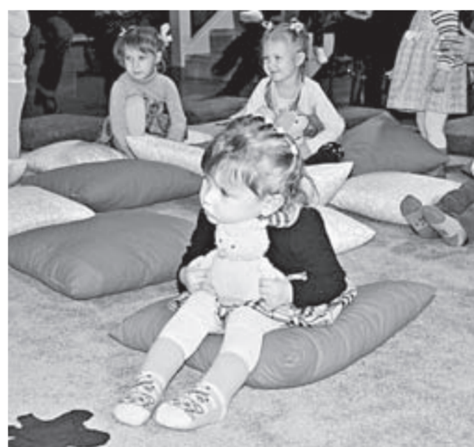
На спектакль – со своей игрушкой!

Дети прячут Колю в большой мешок, подставляют носы под мягкие поролоновые щетки. В конце на сцене появляется еще и тазик с «водой», нарезанной полосками из голубого полиэтилена, и малыши-зрители неожиданно охотно помогают