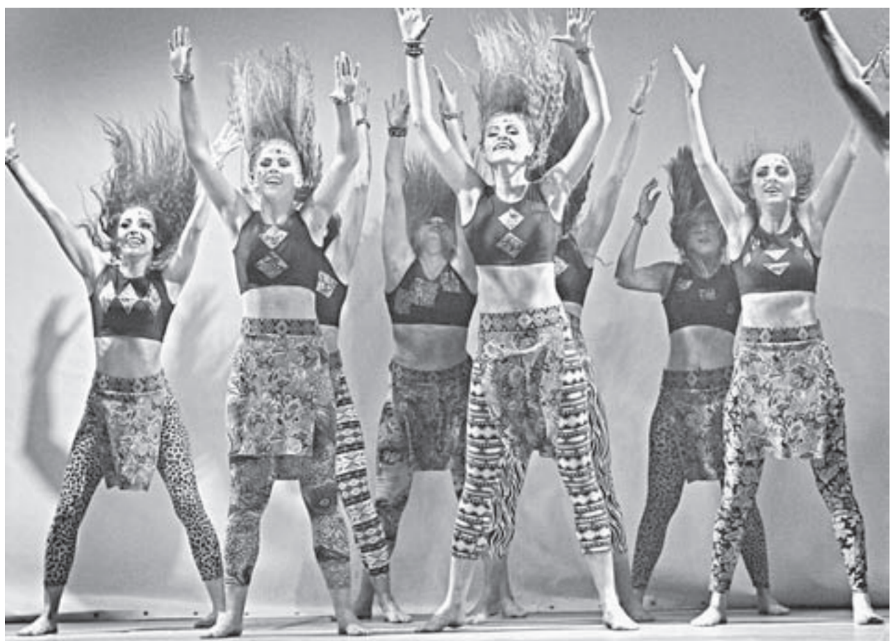
На сцене – барнаульский ансамбль современного танца «Психея».

На выходных в Барнауле прошел краевой танцевальный конкурс «Мы – здоровое поколение!».