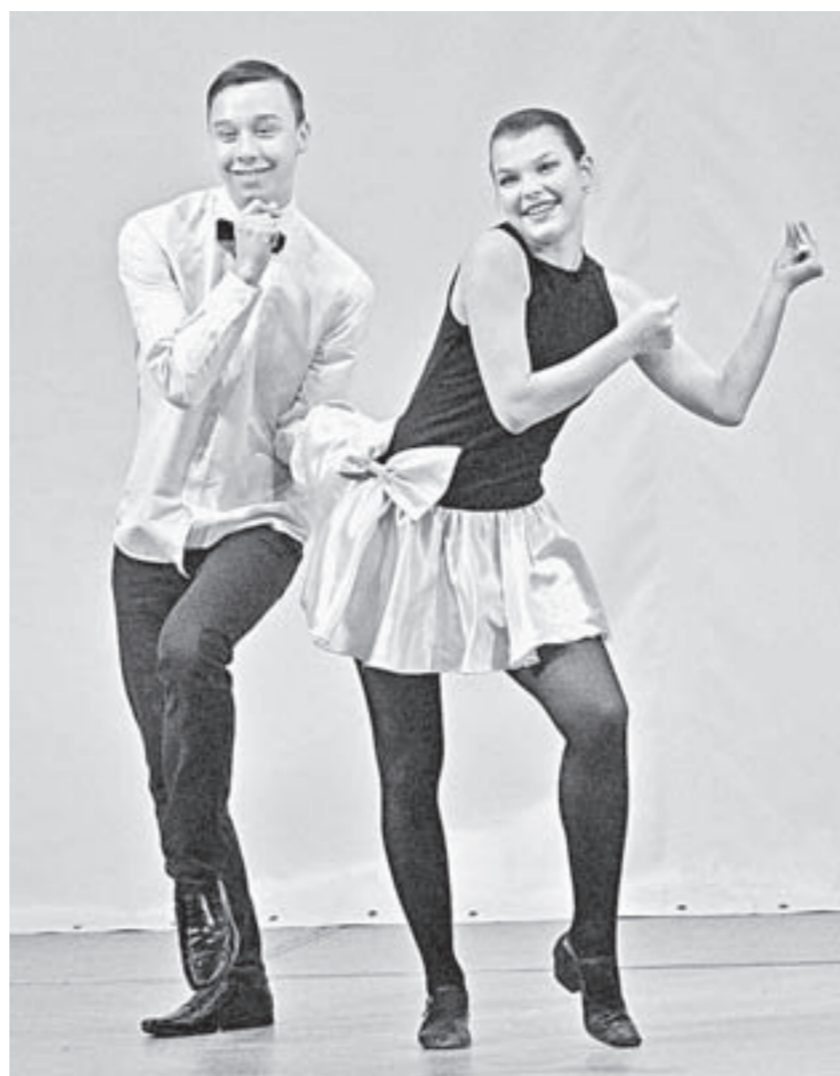
Конкурсанты покорили зрителей не только техникой исполнения, но и актерской игрой.

– Этим мероприятием завершаем месячник здорового образа жизни. Хотим, чтобы молодое поколение было крепким и сильным, чтобы люди знали о последствиях неправильного поведения. Наша задача – приобщить парней и девушек к культуре, творчеству, спорту.