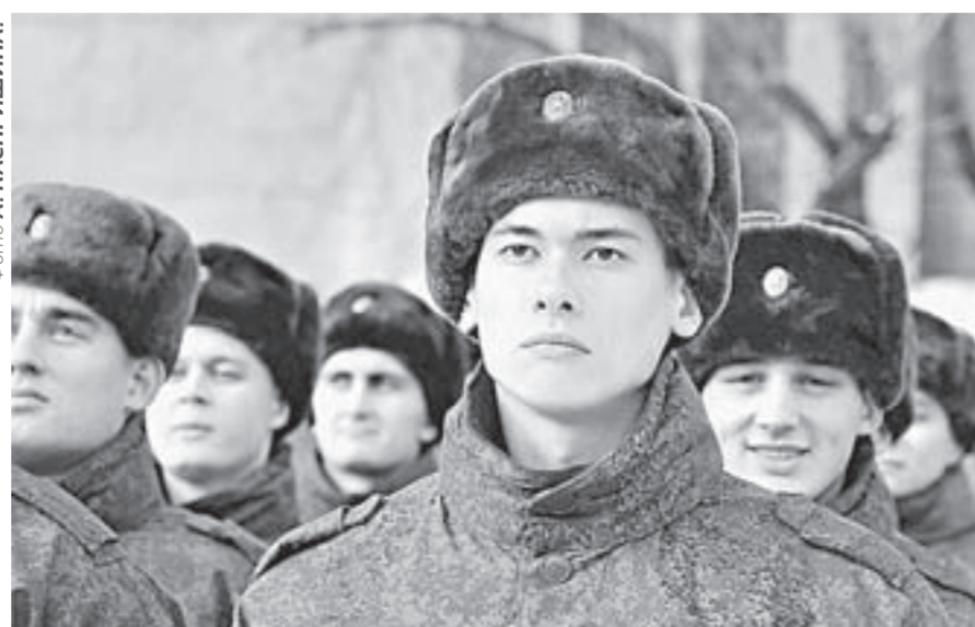
Каждый год 30 парней с Алтая отправляются служить в Президентский полк.