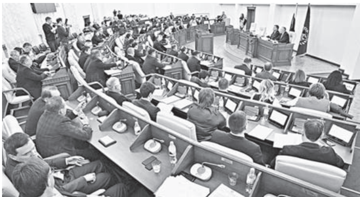
На 14-й сессии было рассмотрено 22 вопроса.