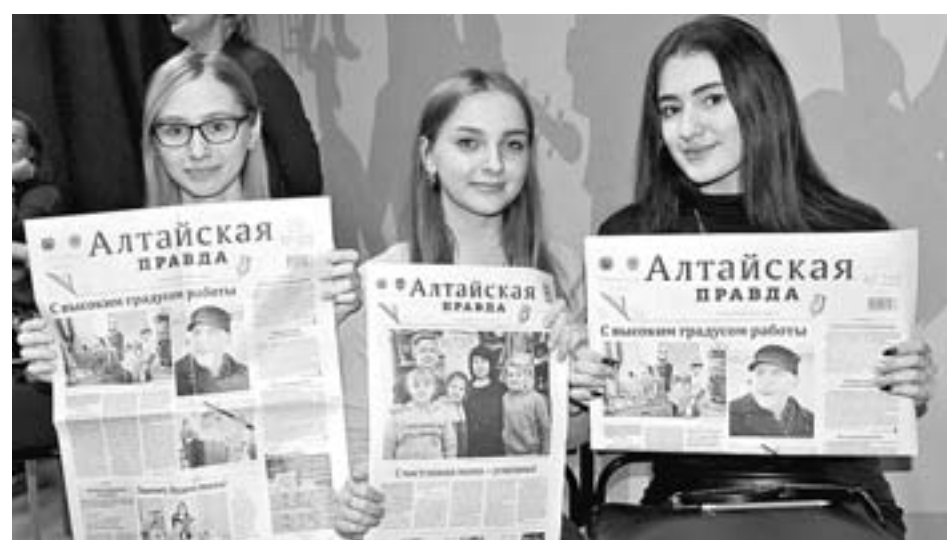
Активисты краевого молодежного общественного движения «Поколение» ближе познакомилась с «Алтайской правдой».

На минувшей неделе корреспонденты «АП» побывали в гостях у активистов Алтайского краевого молодежного общественного движения «Поколение».