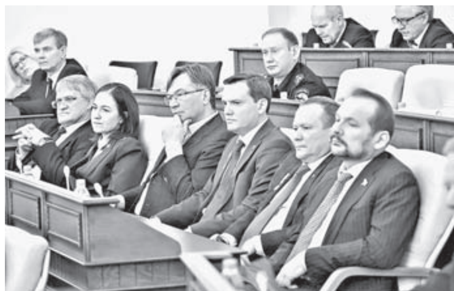
На сессию пришли представители края на федеральном уровне.

Взвешенная бюджетная и долговая политика, увеличение федеральной поддержки позволили войти в 2018 финансовый год с новым качественным состоянием бюджета края, в том числе и местных бюджетов: запланировать увеличение заработной платы в бюджетной сфере в целом по краю на 10%, значительно увеличить капитальные вложения, оказать более серьезную поддержку муниципальным бюджетам.