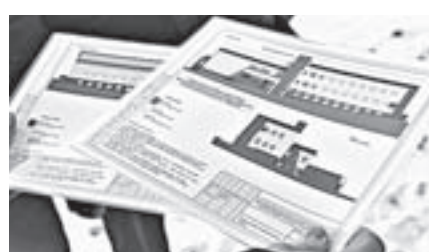
Так будет выглядеть новый корпус.

Просторное трехэтажное здание площадью 3,8 тысячи квадратных метров ежедневно будут посещать сто человек. В отделении реабилитации молодых инвалидов (от 18 до 44 лет) помимо кабинетов с современным оборудованием открыт бассейн и спортивный зал. В учреждении появятся новые специалисты: медики, педагоги, социальные работники. Строительство корпуса начнется в 2018 году и завершится в конце 2019-го. Стоимость проекта – 180 миллионов рублей. Почти половина этой суммы уже выделена из федерального бюджета.