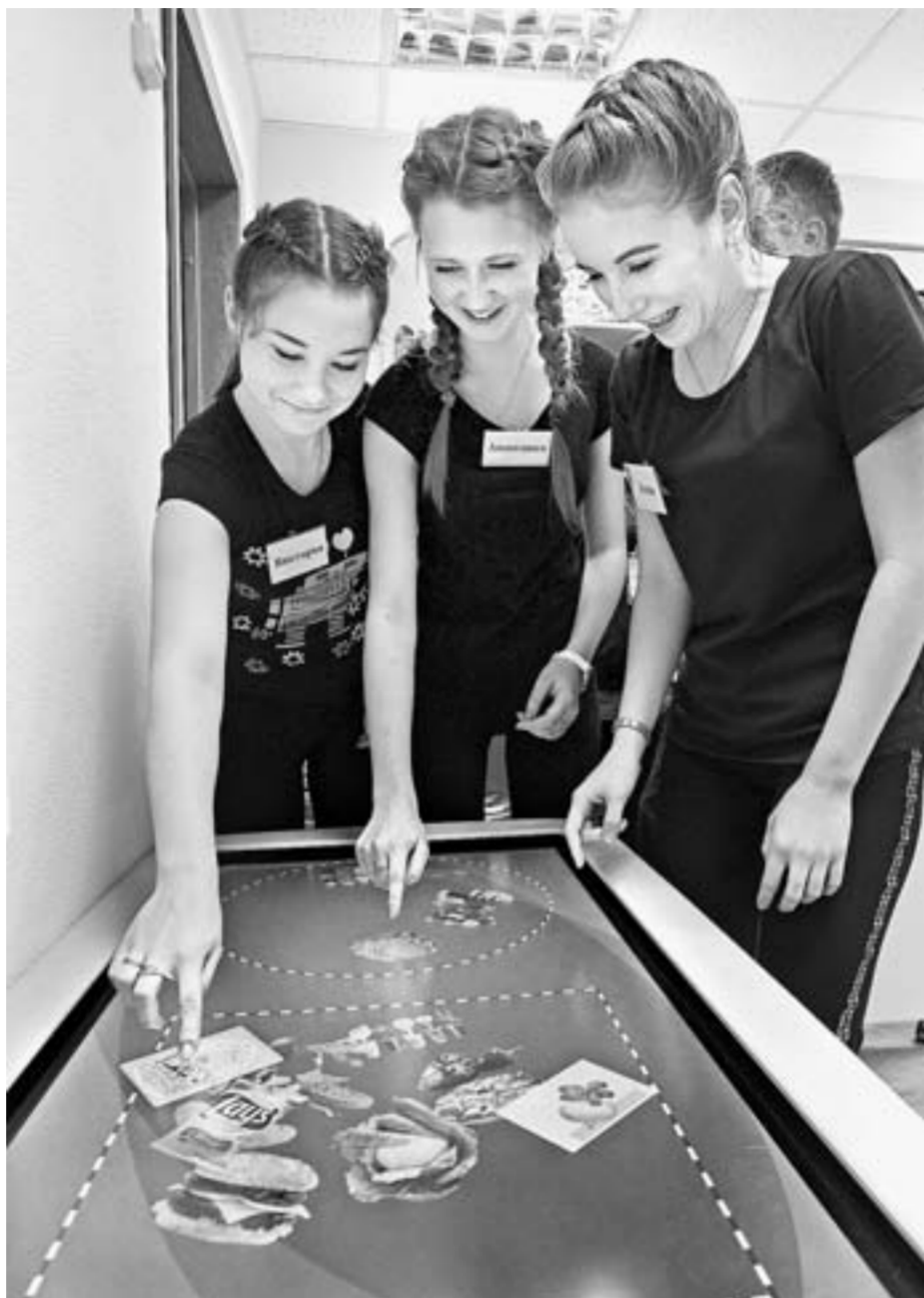
Будущий педагог просто обязан владеть современным оборудованием, уверены в Барнаульском педколледже.

Ответственная за организацию этой площадки замдиректора Барнаульского