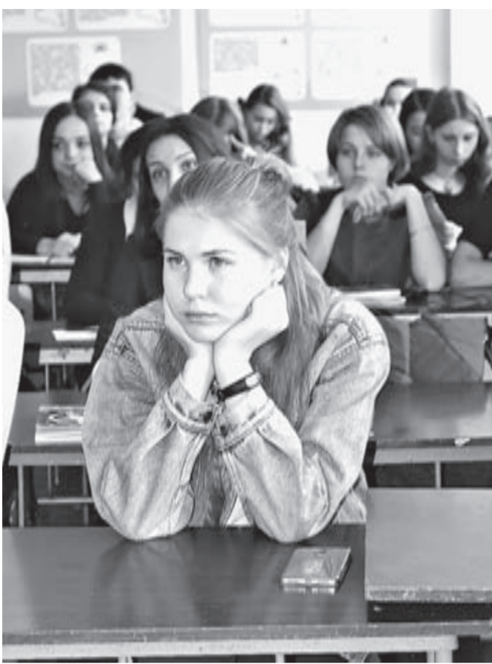
Студенты прониклись историями о подвигах земляков.

19 ноября в России отметили 75-летие начала контрнаступления советских войск под Сталинградом. Победа в ожесточенной битве, а операция «Уран» закончилась в феврале 1943 года, стала переломным моментом в ходе Великой Отечественной войны. Задача молодого поколения – помнить, какой ценой нашему народу досталась свобода. Поэтому так важно проводить встречи со школьниками и студентами, рассказывать об истории Отечества, называть фамилии героев-земляков, приглашать молодежь участвовать в патриотических акциях. Так, 17 ноября по инициативе регионального отделения Общероссийского общественного гражданско-патриотического движения «Бессмертный полк России» при поддержке краевой Общественной палаты и АлтГПУ будущие педагоги с