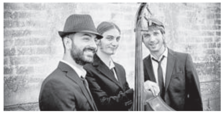
Итальянское трио Accordi Disaccordi (Филармония).