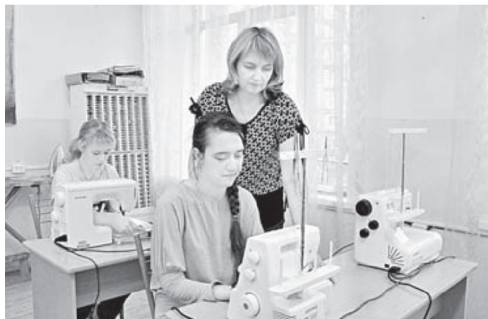
В краевом реабилитационном центре уже опробовали новое швейное оборудование.

Краевой реабилитационный центр для детей и подростков получил оборудование для швейной мастерской.