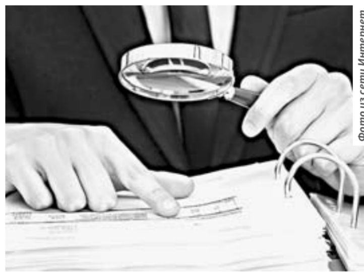
Перед заполнением любых договоров читайте их внимательно.

— Ну что вы. КПК — добровольное объединение граждан или организаций, а иногда и тех,