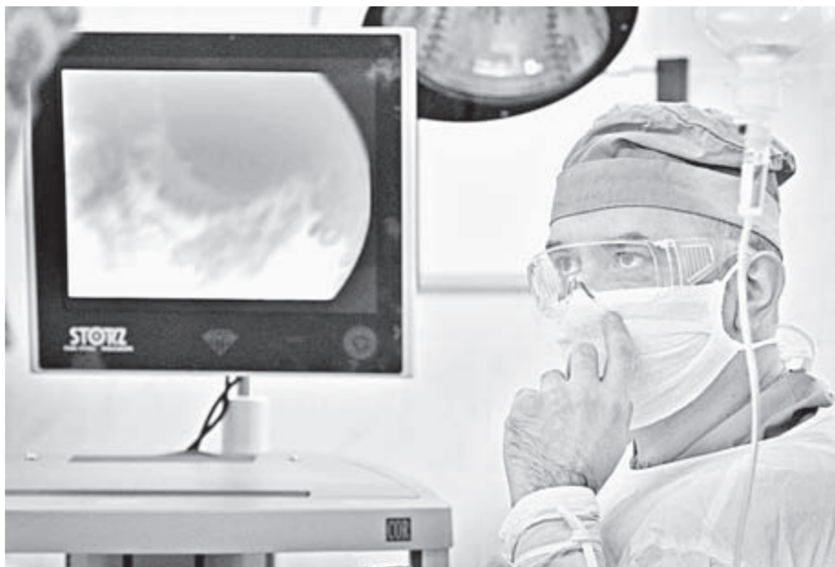
Экран позволяет увидеть сустав изнутри.

Артроскопия плечевого сустава, которую проводят хирурги БСМП, представляет собой малоинвазивную, то есть малотравматичную операцию, то есть визуализирующее устройство и инструменты. Создать объем для манипулирования помога-