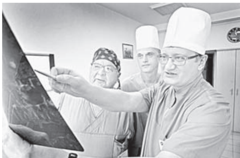
Специалисты нейрохирургии оценивают показания и противопоказания.

ет накачивание сустава жидкостью. В итоге врач видит сустав изнутри на специальном экране увеличенным, что позволяет ему осуществлять самые тонкие и точные вмешательства. Как правило, это восстановление анатомической целостности сустава – сшивание хрящей и связок, удаление суставной мышцы или блока.