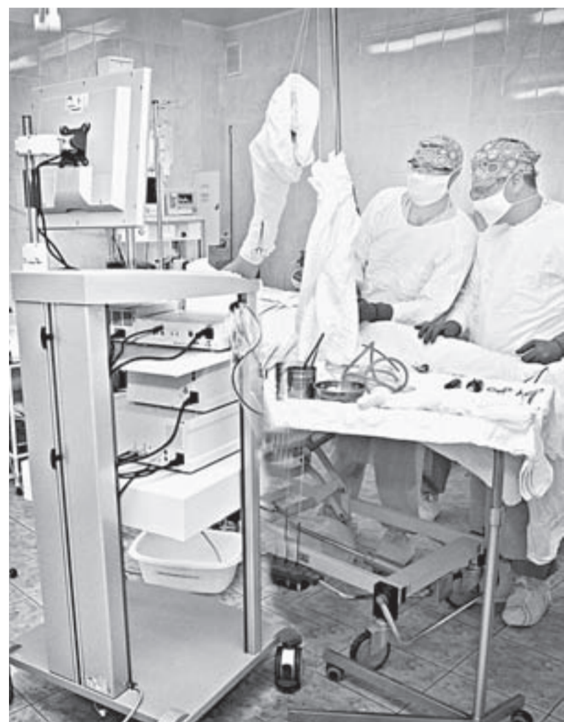
Хирурги БСМП проводят первую операцию с помощью нового оборудования.

Операционная, стойка, стол и уже подготовленный к операции пациент, хирурги и ассистенты, анестезиологи, медсестры – началась первая операция с использованием артроскопической стойки Karl Storz, приобретенной по государственной программе «Развитие здравоохранения в Алтайском крае до 2020 года».