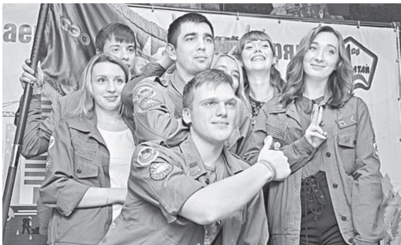
Алтайские бойцы – лучшие в стране.