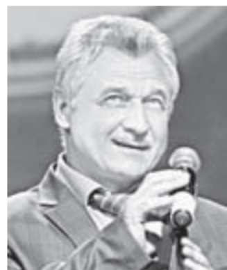
Ректор АГМУ Игорь Салдан.