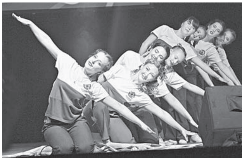
Студенты показали на сцене самые яркие творческие номера этого сезона.

– Два года в составе стройотряда «Рубин» строил космодром Восточный в Амурской области. В конце августа вернулся с запоярной межрегиональной студенческой стройки «Север-2017». Наша дружная