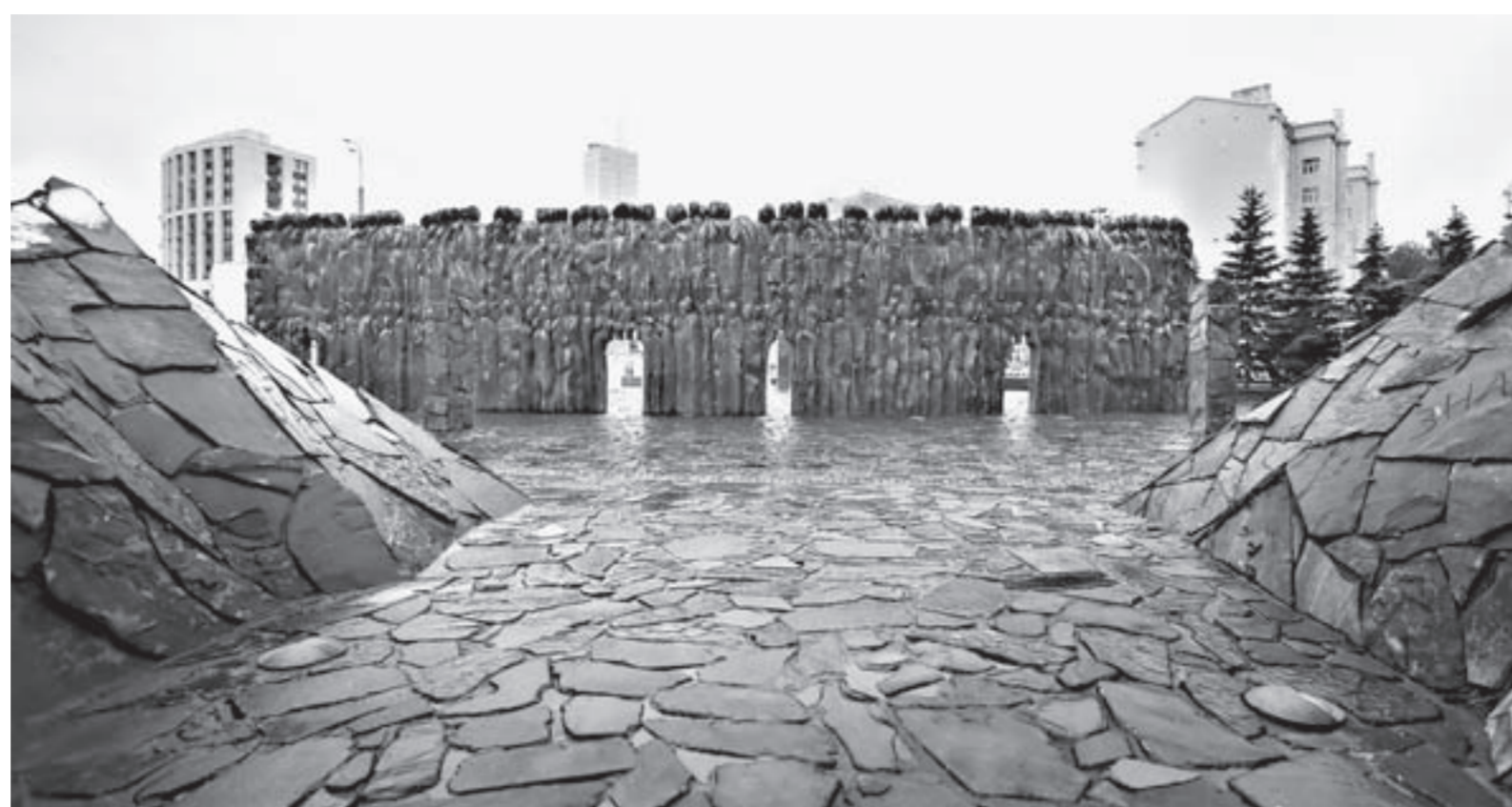
Мемориальный комплекс «Стена скорби».

ными стенками из гранитных плит. По заднему периметру площадки в качестве опорной стены расположены вздыбленные «плачущие» валуны, по которым струится вода. Также установлены специальные заградительные надолбы – создаётся впечатление, что люди идут к памятнику колонной.