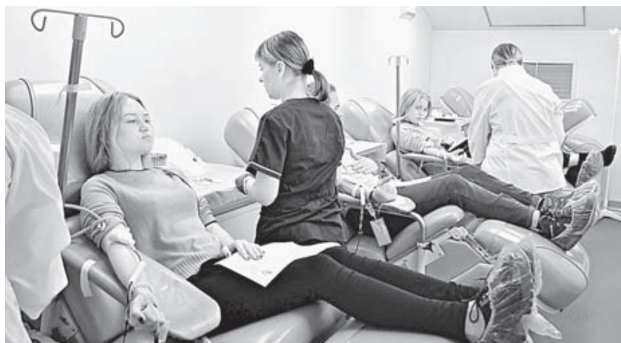
Студенты сдают кровь.

На этой неделе в крае прошла межвузовская акция по сбору донорской крови.