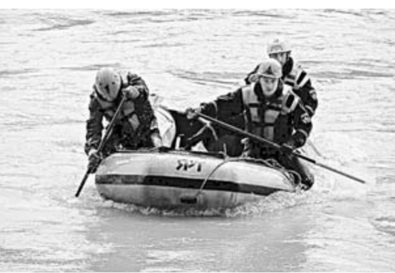
Спасатели идут на помощь.

Предзимняя рыбалка имеет свои особенности.