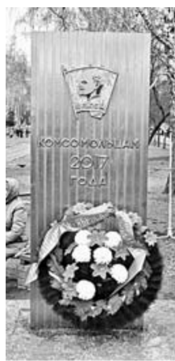
Здесь 50 лет хранилась капсула с посланием.

Несколько минут ушло на открытие самой металлической