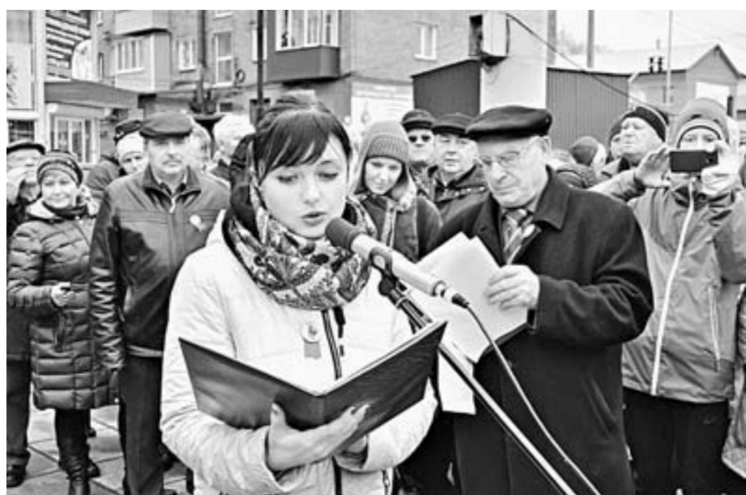
Текст зачитывали семь минут: комсомольцы 60-х во многом предугадали развитие Бийска.