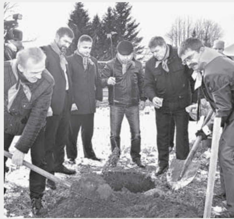
В честь края и АНДЭЦ высадили яблоню.