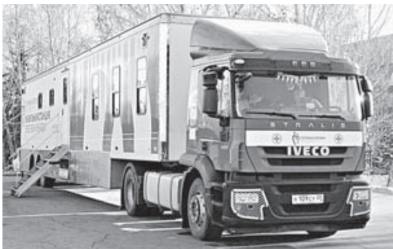
Мобильная станция переливания крови.

Акция ежегодно проходит в Барнауле благодаря студенческому профкомму АлтГТУ и Алтайскому краевому центру крови. Она набирает всё большую популярность среди молодежи. В этом году мероприятие решили провести с 30 октября по 3 ноября. По такому случаю на пл. Сахарова была доставлена мобильная станция переливания крови. Каждый день с 8.30 до 12.00 там сдавали кровь студенты из разных вузов региона. К примеру, в понедельник проект поддержали ребята из Алтайского государственного технического университета, во вторник – из классического и медицинского. Кстати, 31 октября было особенно морозно, но волонтеры не покидали свои уличные посты, регистрировали участников, направляли людей к медикам. После процедуры вручали значки и наклейки. Среди