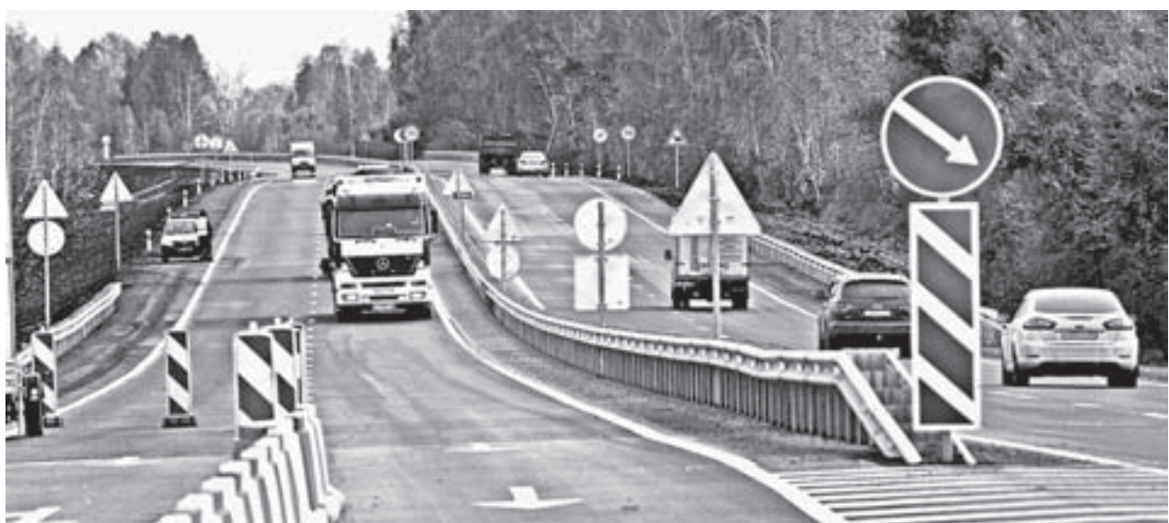
Отремонтированный участок Чуйского тракта.