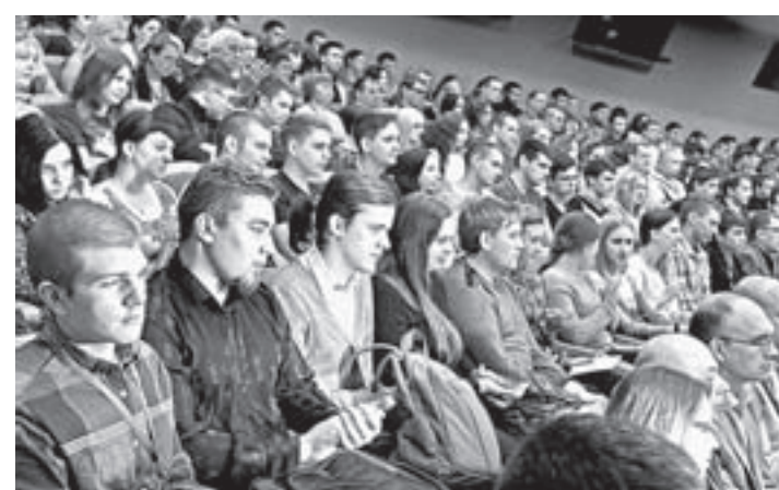
Форум собрал около 760 человек из 40 регионов страны.

В свою очередь вице-президент подразделения IT-бизнес-компаний «Schneider