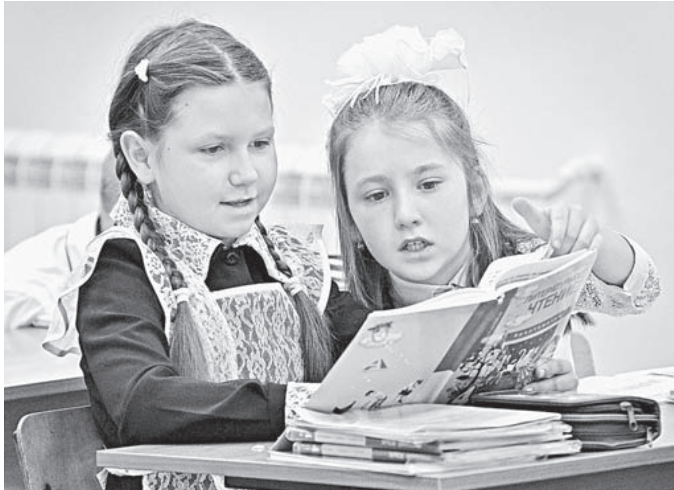
В новых кабинетах детям комфортно.

ехали строители и начали разбор крыши. Огромную помощь и в уборке, и в подготовке кабинетов оказали родители. Во время проведения ремонтных работ дети занимались в здании местной поликлиники, а также в школьном музее и кабинете директора школы. Решением губернатора края на восстановительные работы школы по краевой адресной инвестиционной программе было выделено