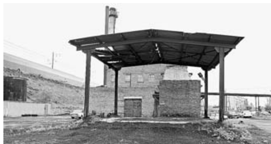
Уголь на городские котельные завозится с колёс.