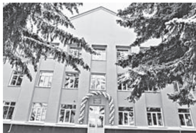
Не школа, а загляденье!

Сегодня в Пролетарской школе учатся 190 детей, но численность учеников, по прогнозам, будет расти. Так