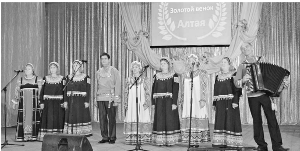
Выступает ансамбль «Русская песня».

Вкуснейшие мясные деликатесы привезли на праздник