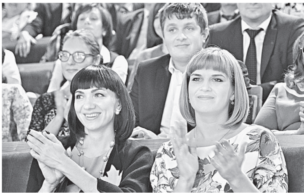
Торжественный момент награждения.

субсидии сельским учителям за жилищно-коммунальные услуги. Сейчас компенсация расходов на оплату жилого помещения, отопления и освещения составляет 1800 рублей. Ее индексируют на