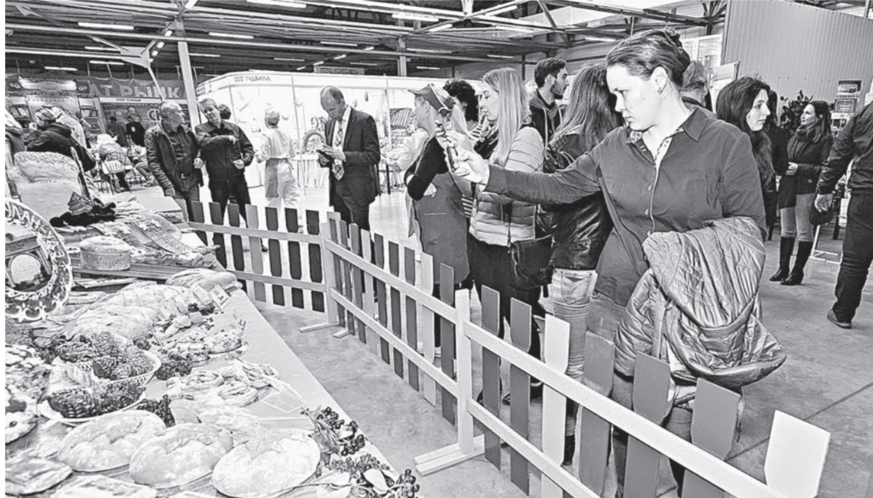
На выставке было что посмотреть.

Попыткой сблизить интересы мукомолов и пекарей для завоевания новых рынков сбыта можно назвать II Межрегиональную специализированную выставку «Пекарь и кондитер». Мероприятие прошло в Барнауле в конце прошлой недели на территории «Эко-ярмарки ВДНХ».