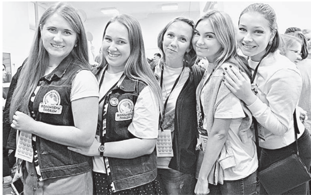
Фотом. Е. ЗЕЛЕНОВОЙ