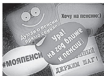
С забавными хештегами до и после занятий фотографировались все желающие.