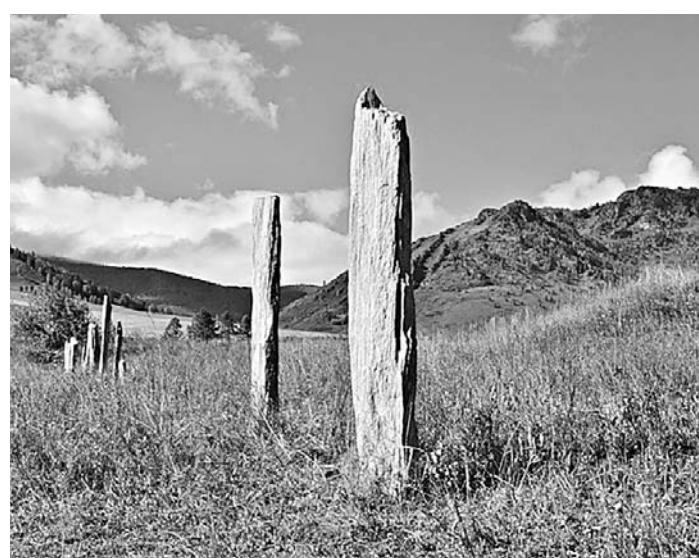
Дорога к «царскому» кургану в чарышском Сентелене.

Как говорится в документации к конкурсу, в крае придадут большое значение развитию туризма в городах и предгорных