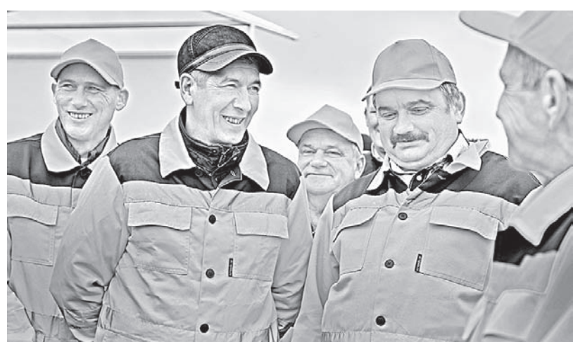
На ремонте были задействованы специалисты Северо-Восточного ДСУ.

для Заринска и Заринского района, но и для смежных территорий, где активно развивают туризм. На этой автомобильной трассе расположены круглогодичные спортивные базы.