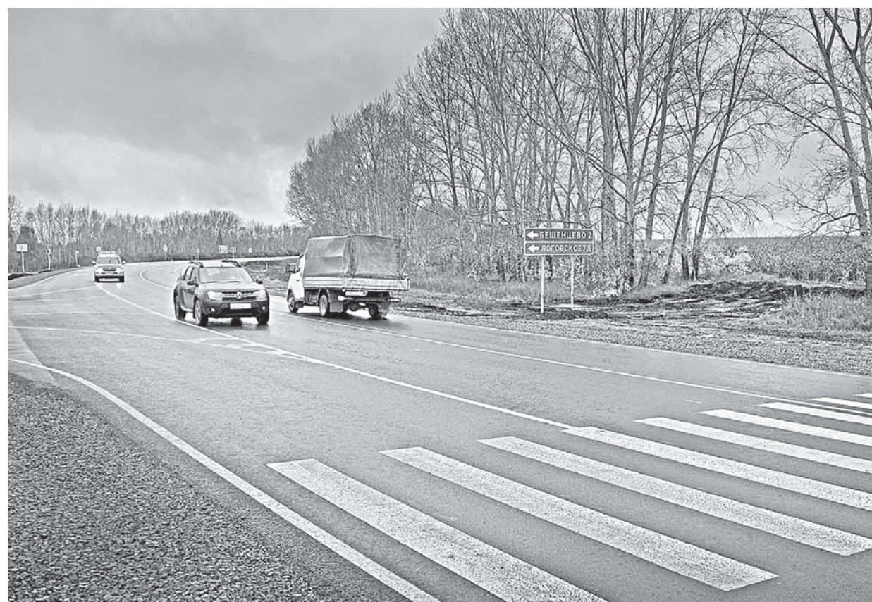
Обновленный участок трассы Белоаярск-Заринск.

В минувшую пятницу, 22 сентября, в Первомайском районе торжественно открыли очередной 15-километровый участок трассы Белоаярск-Заринск, отремонтированный по программе «Безопасные и качественные дороги». По этой оживленной транспортной магистрали в сутки передвигаются более 2,5 тысячи автомобилей.