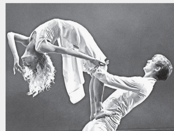
Сила и грация в танце.