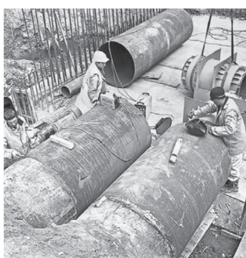
Работы на объектах теплоснабжения вельсь все лето.

проводить гораздо большую работу, если это необходимо. Обсуждением параметров работы стороны займутся в ближайшие месяцы.