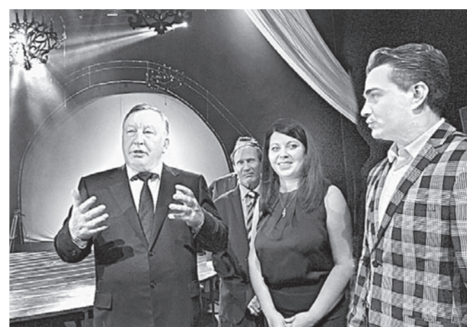
Губернатор оценил качество ремонтных работ.