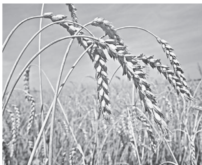
Работы на полях идут в хорошем режиме.

– Рассчитываем на участие бизнеса, инициативы населения, – сказал губернатор. – Мы должны довести до состояния полной благоустроенности все дворовые территории в горо-