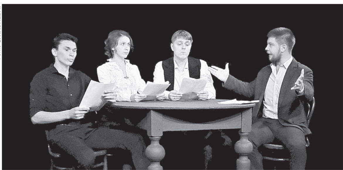
В исполнении артистов МТА прозвучали четыре рассказа Чехова.

Надо сказать, перед началом в театре немного нервничали, что живого и заинтересованно-