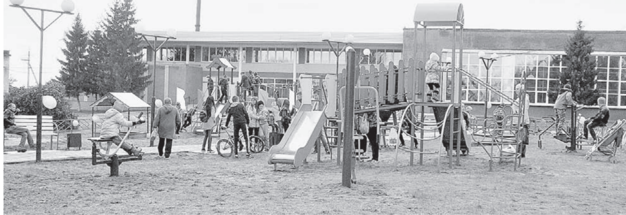
Новая площадна в Северном микрорайоне – один из этапов масштабной программы по развитию моногорода.

– Я живу здесь больше 20 лет и сейчас испытываю немалое счастье. Все тут к месту – дети играют, а Го-