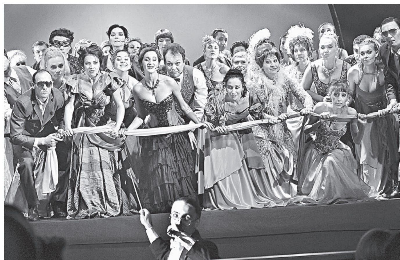
Новый сезон открыт!

Алтайский театр музыкальной комедии открыл новый сезон на обновленной после реконструкции сцене. Ее привели в порядок на средства, выделенные из краевого бюджета.