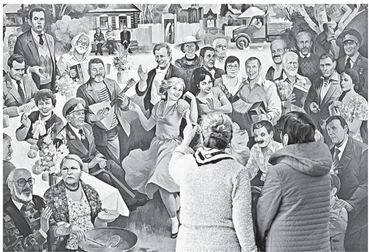
В Выставочном зале музея «Город».