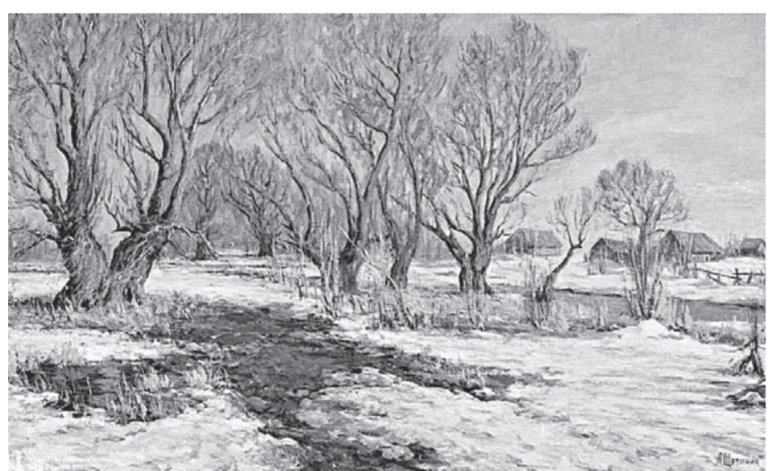
Работа Анатолия Щетинина из собрания Художественного музея «Начало весны. Затон» (2014).

Художник признается, что для него это «невероятно ответственный этап в жизни» и над реализацией