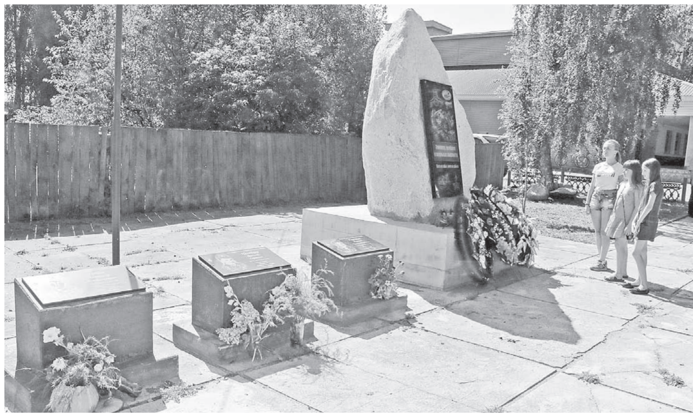
Аллея памяти погибших участников локальных войн – продолжение сквера Побединского, посвященного ветеранам Великой Отечественной.

В селе Красногорском трепетно и бережно относятся к памяти совсем молодых ребят, погибших в современных локальных войнах.