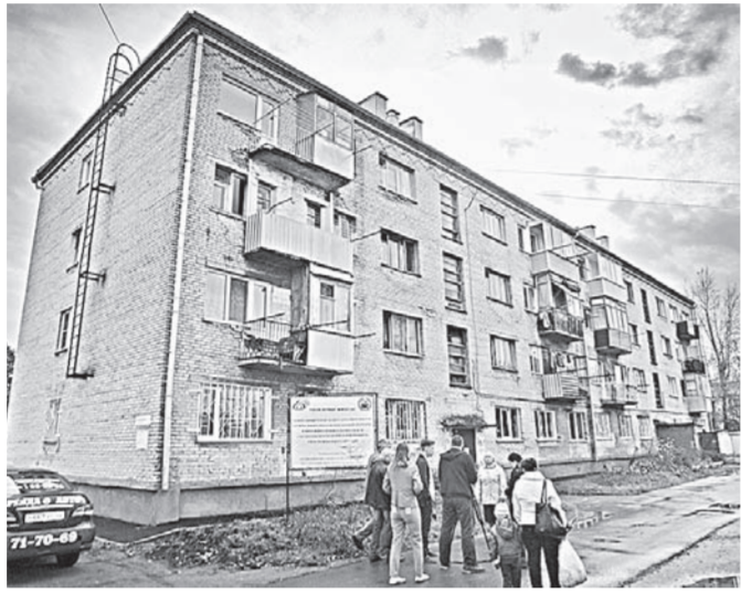
В этом доме кровля уже новая.

В барнаульском поселке Новосилкатном в рамках работы регионального Фонда капитального ремонта многоквартирных домов идет капитальный ремонт сразу в семи многоквартирных домах. В большинстве из них фактически делают новую кровлю, на улице Новосибирской в доме № 18 кроме этого капитально отремонтированы инженерные системы.