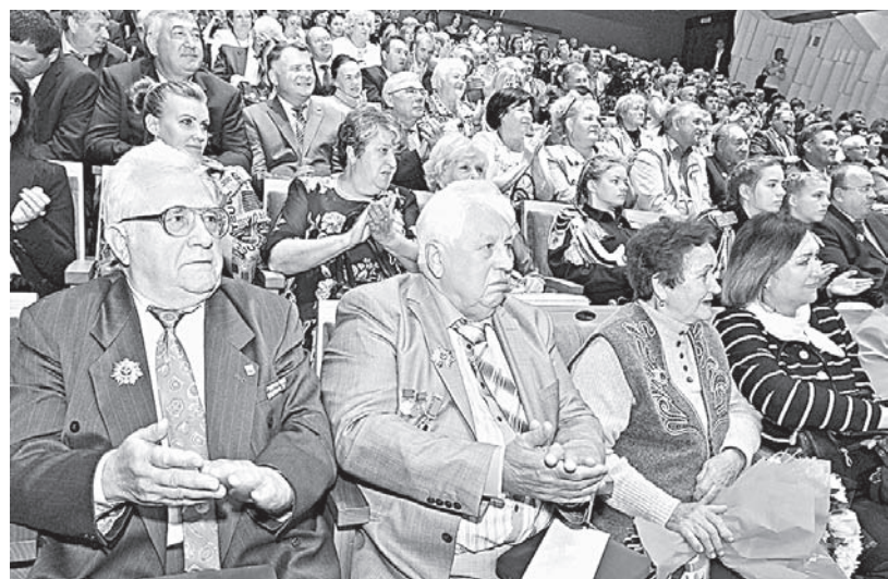
Их трудом славен край.

В четверг, 14 сентября, в Барнауле в концертном зале «Сибирь» прошла торжественная церемония вручения жителям Алтайского края государственных и краевых наград, дипломов и нагрудных знаков почетным гражданам Алтайского края. В честь 80-летия региона учредили юбилейную медаль. Всего этой награды удостоено около двух тысяч тружеников и общественных работников различных отраслей.