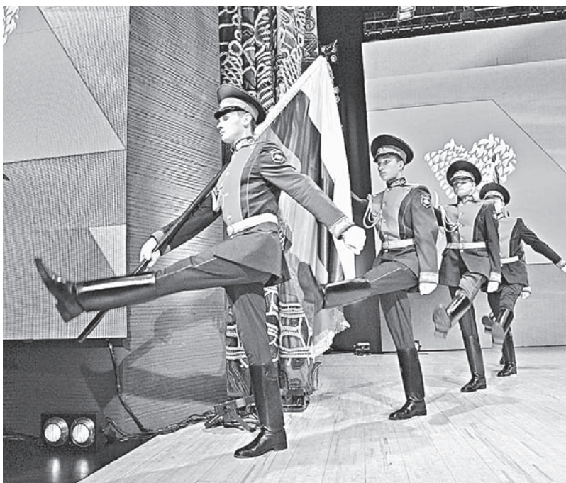
Торжественный момент церемонии.