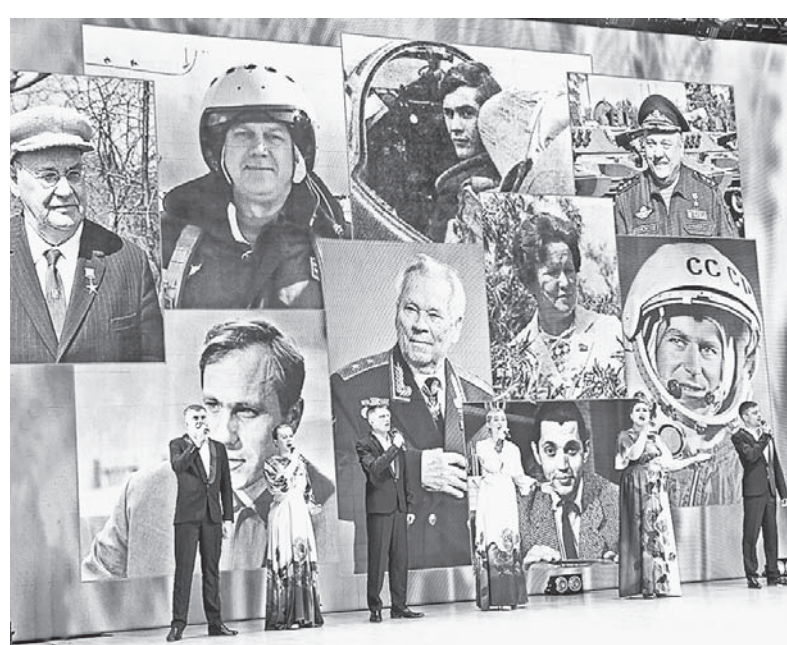
На экране – гордость края.

На протяжении последних 16 лет под ее руководством участники химической школы заняли 110 призовых мест на олимпиадах районного, краевого и международного уровней.