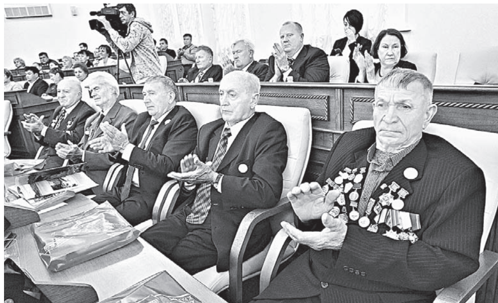
На встречу пришли и те, кто всю жизнь трудился на благо региона.

– Сегодня создано необходимое правовое поле для дальнейшего развития