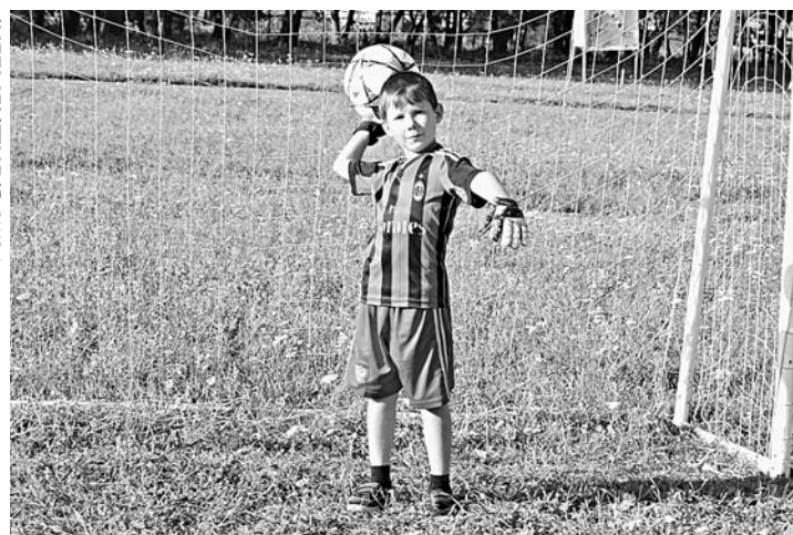
В Красногорском растут свои футболисты.

Когда-то неплохо плавал, с тех пор осталась мечта – построить в Красногорском бассейне. Проект дорогой, но реальный, если администрация района примет участие в финансировании. Кроме того, мы надеемся на будущий год тандемом власти и предпринимательского сообще-