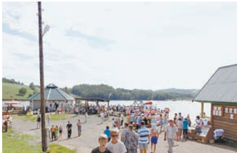
Озеро Киреево в живописном уголке Красногорского района может стать туристической Меккой.

торые может дать этот участок речушки, а ЛЭП, запитанные от каскада безопасных для экосистемы ГЭС. Это великая идея, и я не размениваюсь на мелочи.