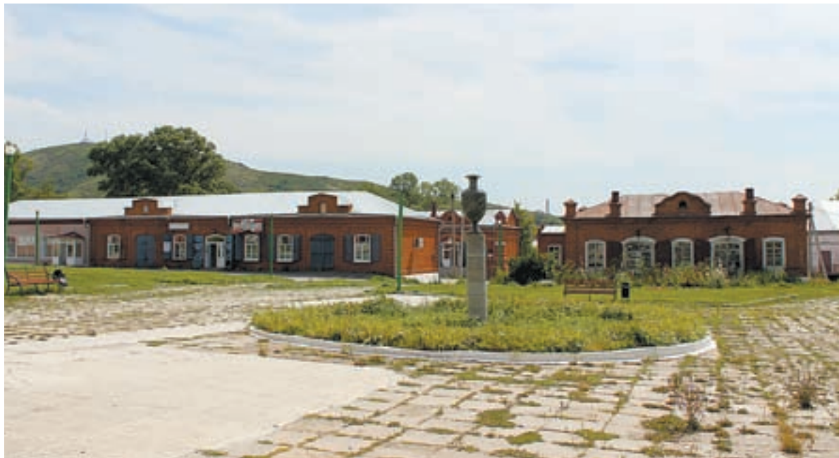
Торговая площадь в Змеиногорске, где была лавка Орешникова.

В Змеиногорске на родине известного алтайского пряничника Степана Григорьевича Орешникова планируют открыть частный музей алтайского пряника.