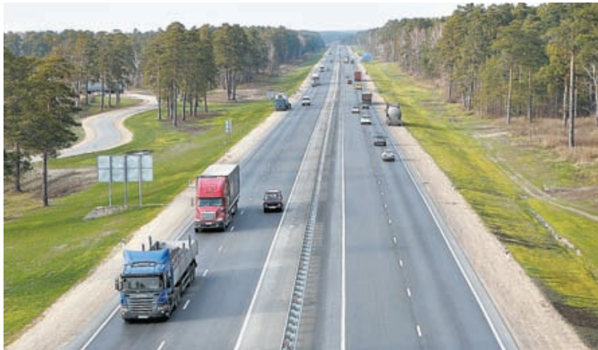
Надежные дороги – одна из примет ускоренного развития региона.

Самый главный итог 10-летнего развития ИТ в регионе – улучшение качества жизни граждан. По-