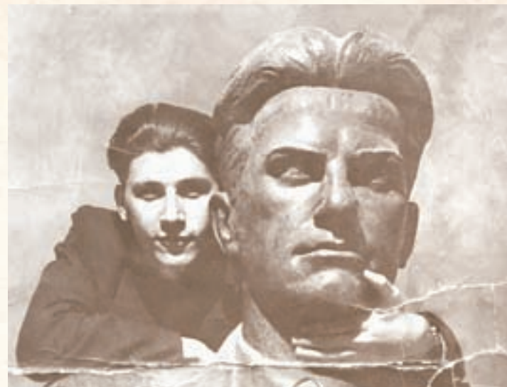
Два поэта – бронзовый и юный...

лину после окончания факультета журналистики МГУ – вот как было на самом деле.