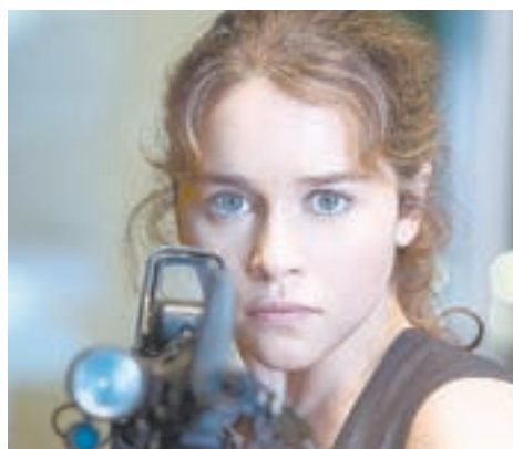
Новая Сара Коннор – уже не «девушка в беде».

Сара, которую он там встречает, познакомилась с терминатором еще в 1973 году. Тогда киборг с лицом молодого Шварценеггера спас ее от другого, из жидкого металла, и затем вырастил как отец. Таким образом, к 1984 году главная героиня морально готова не только