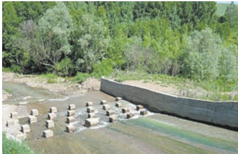
Действующая электростанция на реке Ише на сливе озера Киреево в Красногорском районе.

– Этот вопрос задают мне все испытатели бесплотинных ГЭС. В принципе, мощности одной станции хватит, чтобы обеспечить усадьбу энергией. Но я разбираю модели, построенные и испытанные на Березовке, чтобы сохранить технологии. Могу показать только отдельные рабочие узлы. Ведь цель не 1,5–2 киловатта, ко-