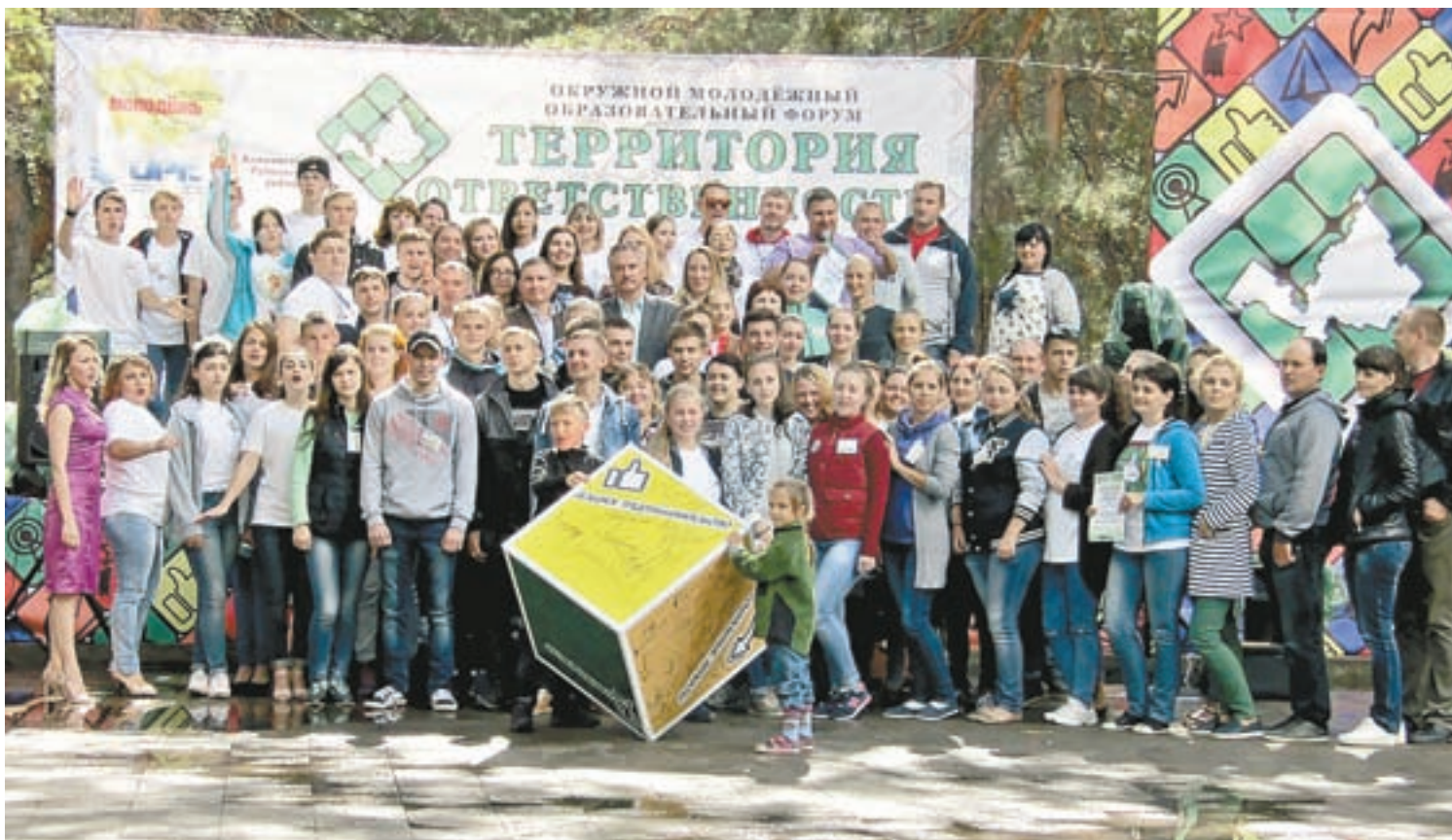
Более ста молодых людей приняли участие в форуме «Территория ответственности».