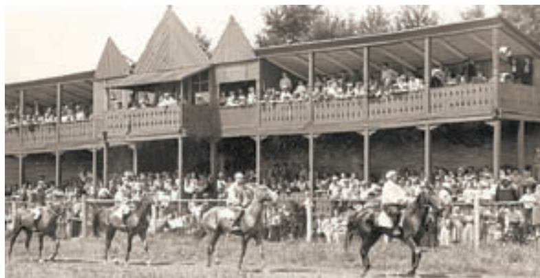
Краевые конноспортивные соревнования на старом ипподроме (р-н Прудских), 1960 г.