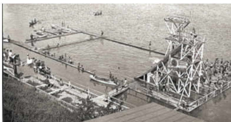
Водная станция БПСО «Динамо» на Оби ( у начала ул. Короленко), 30-е.