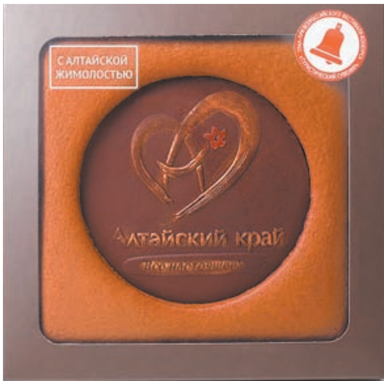
Туристы с удовольствием увозят на память о крае сувенирный пряник.