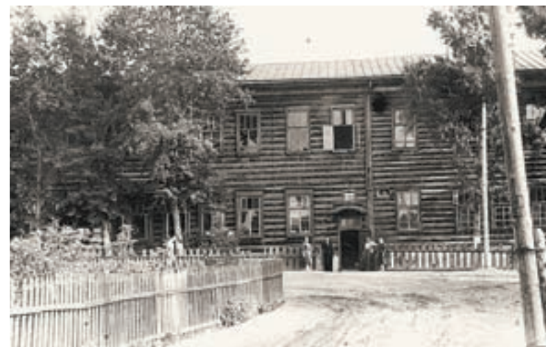
Начальная школа № 5 на пересечении улиц Мамонтова и Ивановский Лог (ул. Гуляева), 50-е.