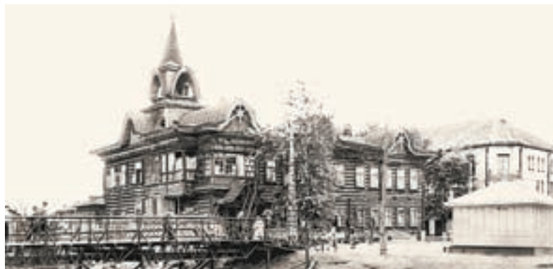
Жилой дом в бывшей гостинице «Империал» на ул. Малой Олонской, 60-е.