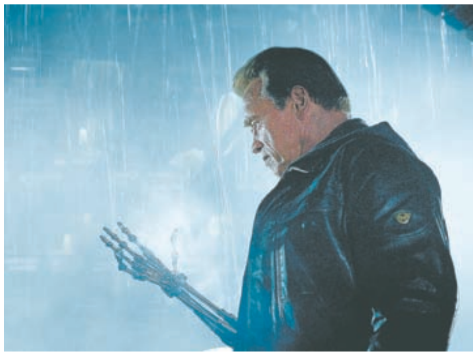
Душой фильма предсказуемо стал постаревший Терминатор.

Проблема в том, что фильм, который должен был начать эту историю как бы с нуля, совершенно не работает как самостоятельное произведение, он то и дело отсылает к канону. Сценаристы, кажется, не особо верили в свои силы, надергав и перемешав сюжетные ходы из первых двух фильмов. Многие сцены пересняты покaдрово, что вызвало у фа-