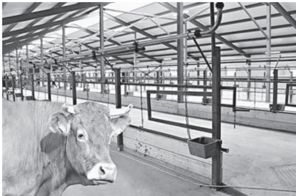
Новый комплекс рассчитан на 600 голов.

– Сегодня у нас особенный, радостный день. Строительство новых объектов животноводства – это