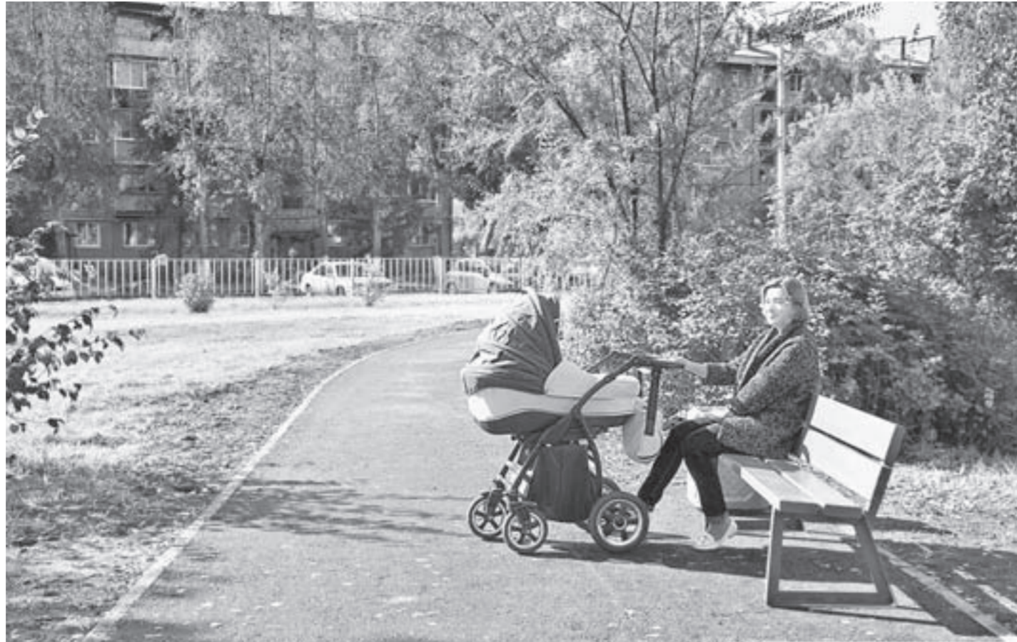
Обновленный парк привлекает все больше горожан.

Отличительной особенностью программы стало предоставление возможности гражданам самим выбирать как объекты, так и виды работ по обустройству территории. С 1 апреля по 1