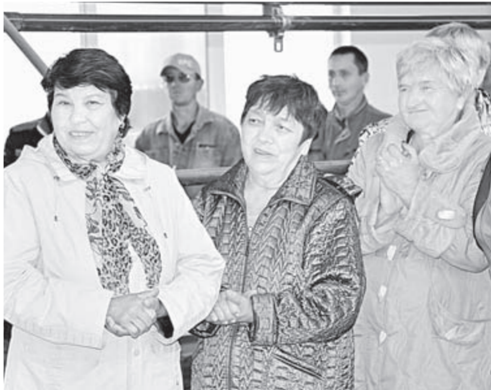
На работу – с настроением.

прежде всего инициатива руководства предприятия, – делится глава администрации Кытмановского района