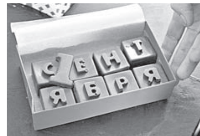
Конфеты ручной работы из бельгийского шоколада.

Наталья ИСАЕВА