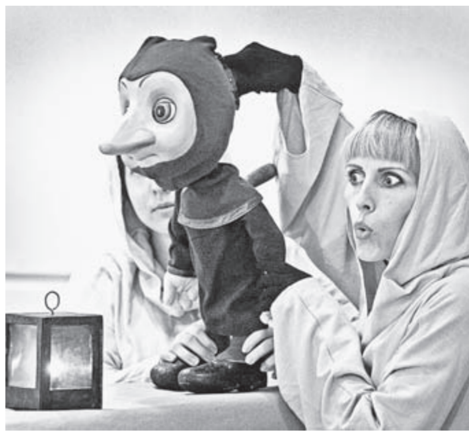
Зрителей встречали персонажи разных спектаклей.

На прошлой неделе театр кукол «Сказка» открыл 54 сезон на новой сценической площадке – в здании кинотеатра «Родина». Новоселье отметили уличным перформансом, а затем в бывшем синем зале кинотеатра юные зрители увидели первую премьеру осени.