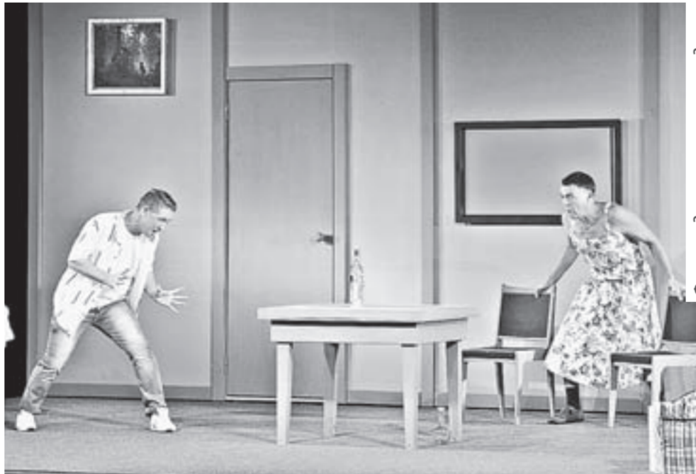
Сцена из спектакля «Феномены» по пьесе Григория Горина.