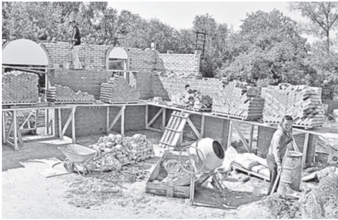
Работа на площадке идет споро.

Тревоги их были напрасны. Здесь возрождают храм Живоначальной Троицы, только быть ему еще более прекрас-