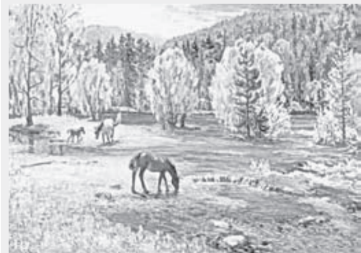
Анатолий Щетинин. «Большая вода» (2014). Художественный музей.

16 сентября. 14.00 – музейная программа «Оружие Победы. 1941 – 1945 гг.», посвященная Дню оружейника (6+).