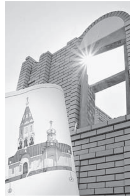
Так будет выглядеть храм Живоначальной Троицы.