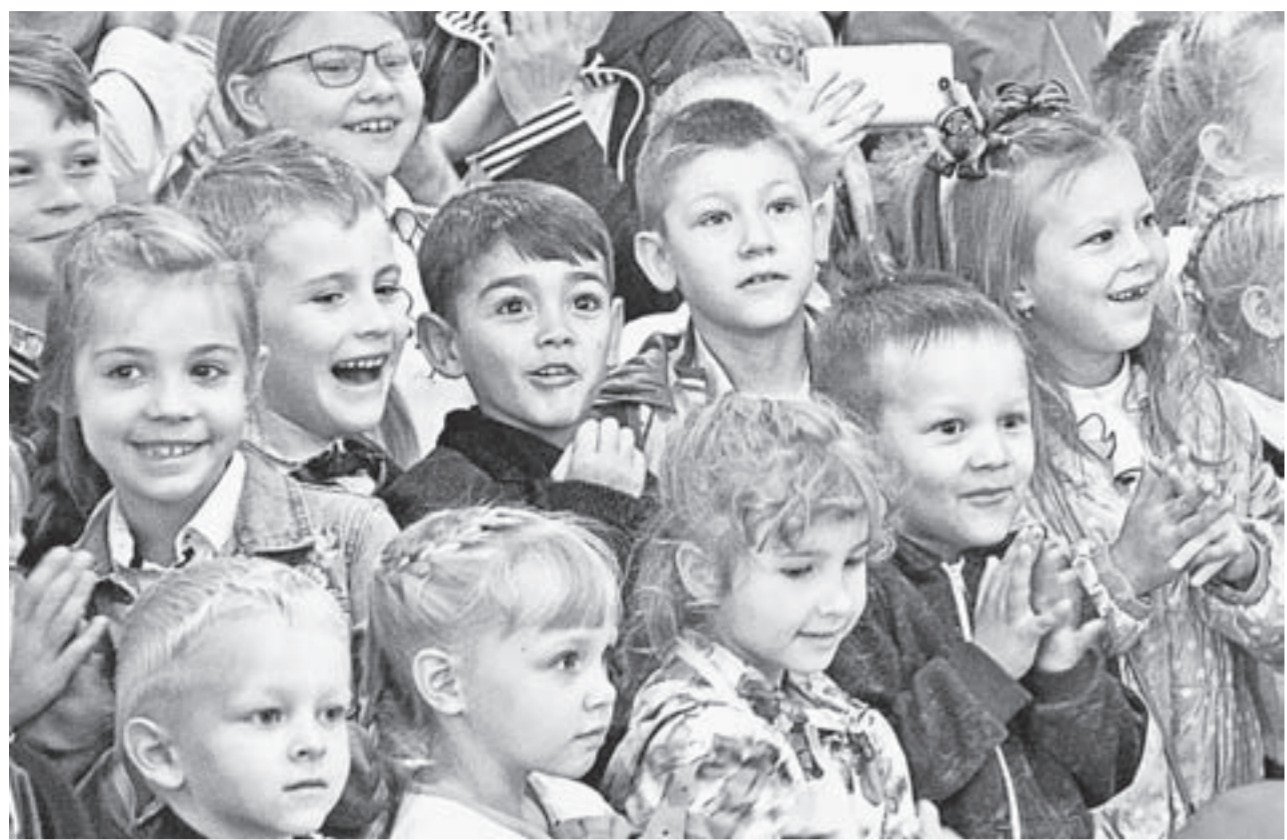
Первые гости «Сказки» на временной площадке.