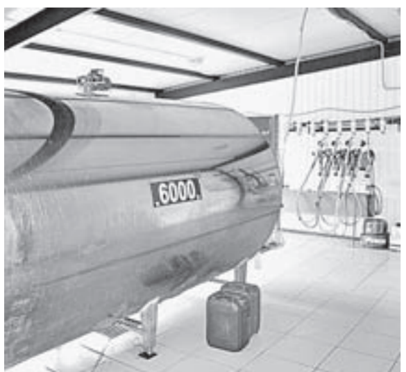
Животноводческие помещения оснащены по последнему слову техники.

Ольга РОДИОНОВА (фото автора и Виктории ЛОНИНОЙ)