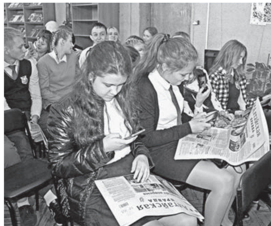
Гимназисты с упоением писали свежие посты о мастер-классе в соцсетях.

– Меня привлекают в профессии журналиста возможность общения с интересными людьми, новые впечатления. Я стараюсь быть всегда в курсе событий, новостей, ну и пишу, конечно, о том, что меня волнует. Сейчас буду учиться на курсах радиийщиков, кастинг в