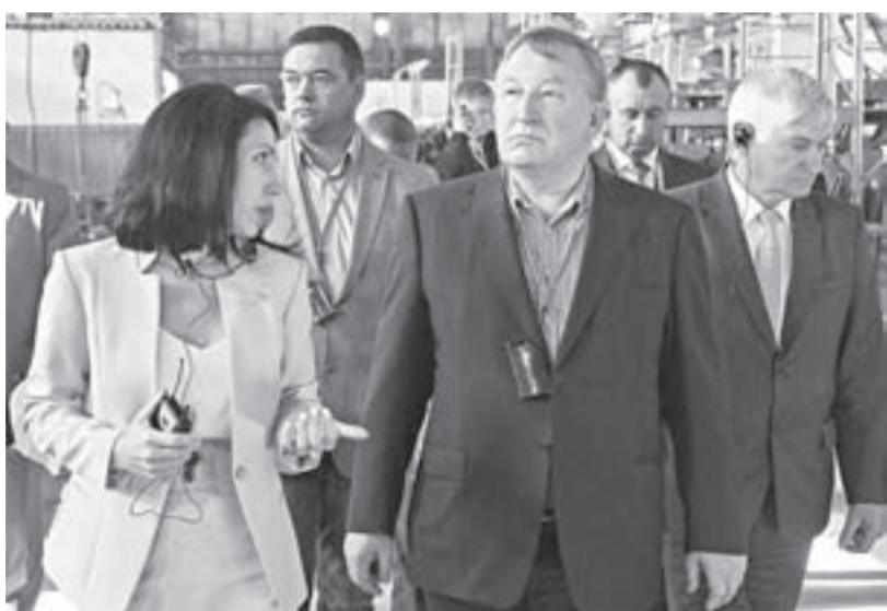
Губернатор Александр Карлин побывал на Алтайском заводе сельскохозяйственного машиностроения.

О динамике роста производства и конкурентных преимуществах техники предприятий Алтайского кластера аграрного машиностроения красноречиво говорит статистика последних лет. Если в 2014 году наши сельхозмашиностроители произвели машин на 2,7 млрд рублей, то в 2016-м – уже на 12,7. При этом общероссийский выпуск сельхозтехники в денежном выражении в прошлом году составил 92 млрд рублей. В текущем году сельхозмашиностроители края планируют увеличить долю на рынке – произвести более 9 тысяч единиц современной конкурентоспособной техники на 14,5 млрд рублей.