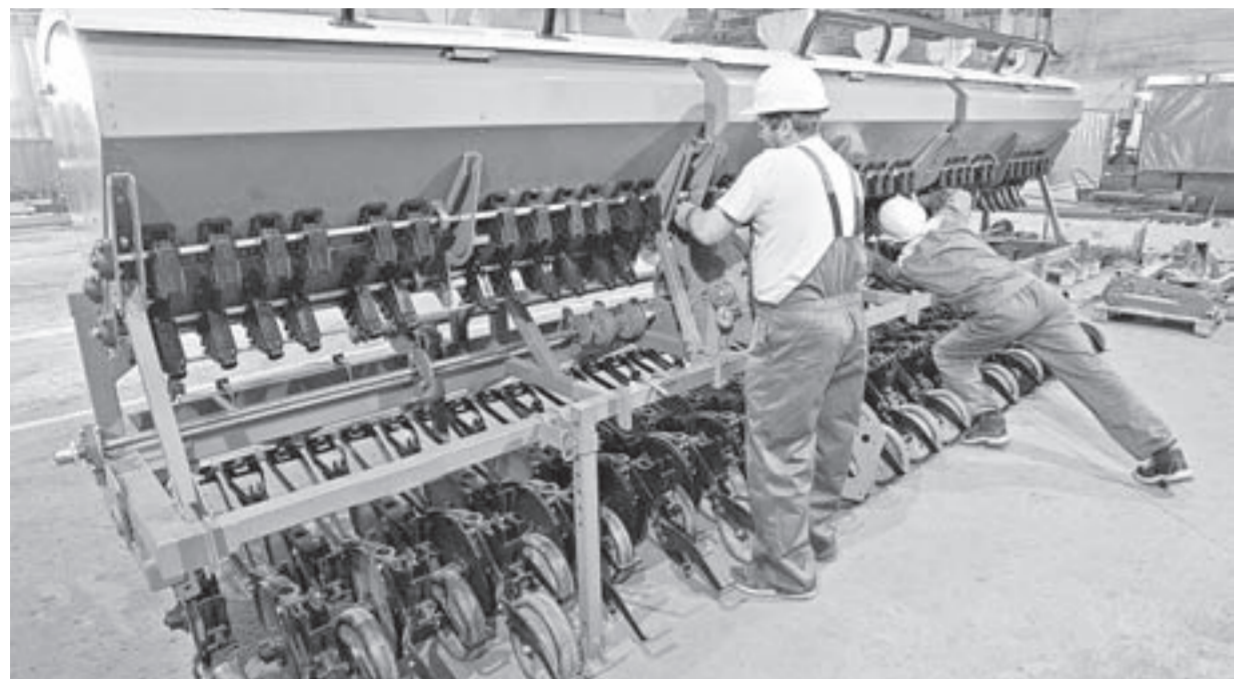
Алтайская сельхозтехника конкурентоспособна в сравнении с зарубежными аналогами по цене и качеству.