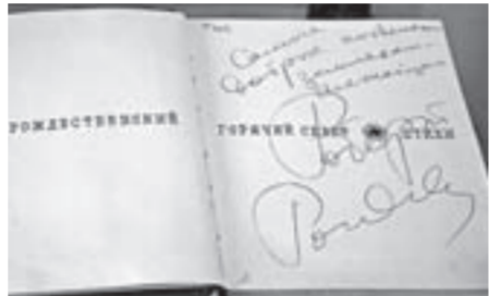
Книга с автографом Р. Родионова.

Задумывая все это, мы отнеслись к проекту с большой ответственностью, идея вошла в душу и сердце!