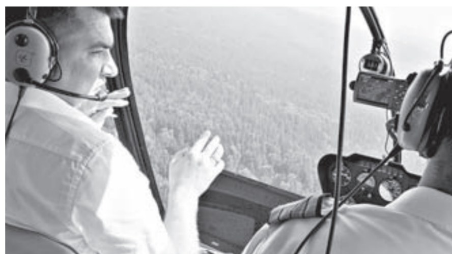
Наблюдение за лесными массивами с воздуха.