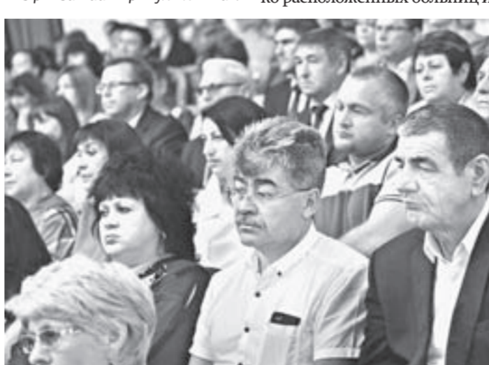
Участники подвели первые итоги реализации шести проектов, направленных на улучшение качества жизни барнаульцев.

Ведется активная работа по решению поставленной президентом задачи о переводе школ на однопольный режим работы. В 2016 году в Барнауле было создано 2750 новых учебных мест, 12 школ переведено на однопольный режим. К 2025 году планируется полностью перейти на