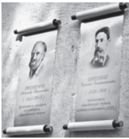
Новые мемориальные доски на стене «Шишковки».