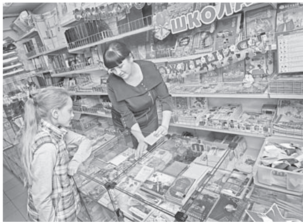
К каждому покупателю – свой подход.

Автор этих строк первым делом увидела на полках походные альбомы, в которых показано, как нарисовать портрет человека. Маленькая книжка, легко входящая в дамскую сумочку, – то, что нужно. – И такую же книжку, только с пейзажами, для дочери, – прошу я. – А может быть, ей интереснее будет с животными?