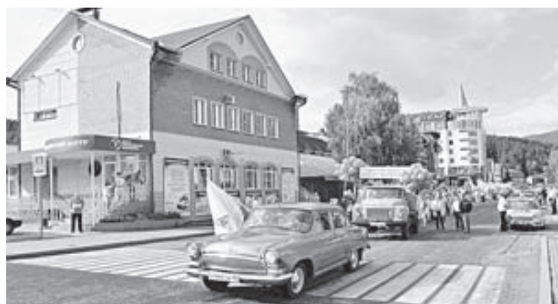
Белокуриха умеет удивлять гостей.

– Вся моя жизнь связана с Белокурихой, – рассказывает она. – После окончания медицинского университета попала сюда по распределению врачом-недиатром. Затем трудилась заведующей отделением, физиотерапевтом. Сейчас продолжаю работать в должности главного врача санатория уже девять лет. Мы постоянно что-то изучаем, вводим новые методики, используем природные факторы. В этом году расширили возможности по лечению опорно-двигательного аппарата. В общем, не стоим на месте. Конечно, главное достижение – здоровые отдыхающие. Они к нам возвращаются. Это напрямую говорит об эффективности сегодняшней Белокурихи.