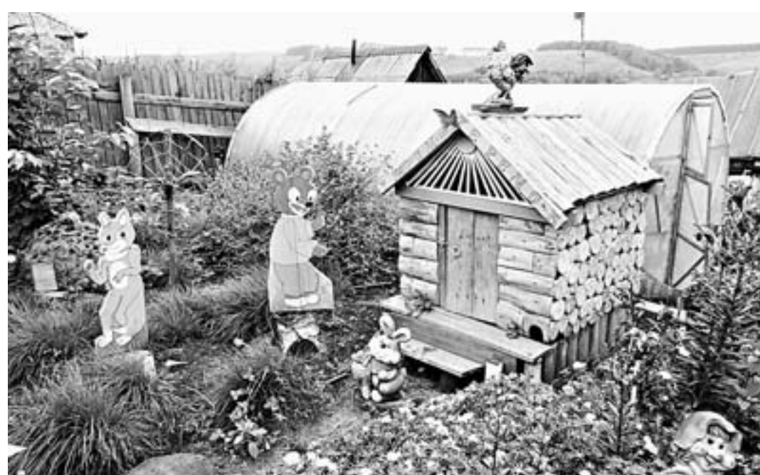
Идею терема Тамара Половинкина подсмотрела на экскурсии в Алтайском районе.

Кроме того, Тамара Михайловна не оставляет физкультуру, заставляя тело трудиться не только на грядках, но и выполняя специальные упражнения. Для