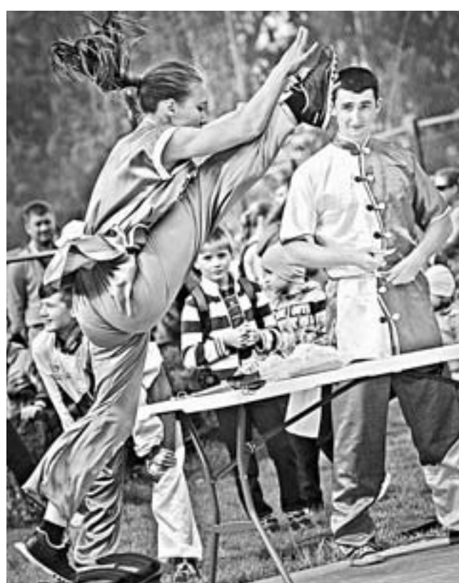
В Парке спорта Алексея Смертина стараются создать условия для всех: и детей, и взрослых.

Фото-репортаж с мероприятия смотрите на сайте ar22.ru