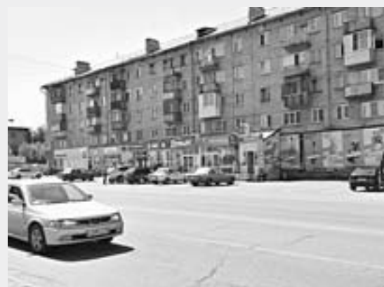
Теперь на привокзальной улице Бийска стало просторно.