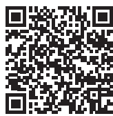
Фото-репортаж с мероприятия смотрите на сайте ar22.ru