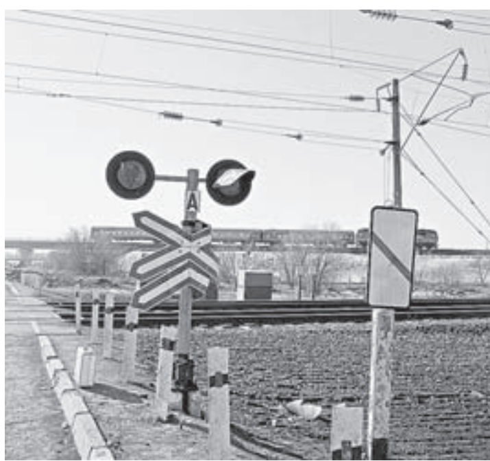
Эти знаки пострадали от рук хулиганов.

Трое жителей Новоалтайска оштрафованы за разрушения, которые они устроили на станции Алтайская. Каждому из них предстоит выложить по 5 тысяч рублей. Также они должны возместить железной дороге ущерб – 52 тысячи рублей. Парням еще повезло, что их «подвиги» были рассмотрены до того, как изменилось законодательство.