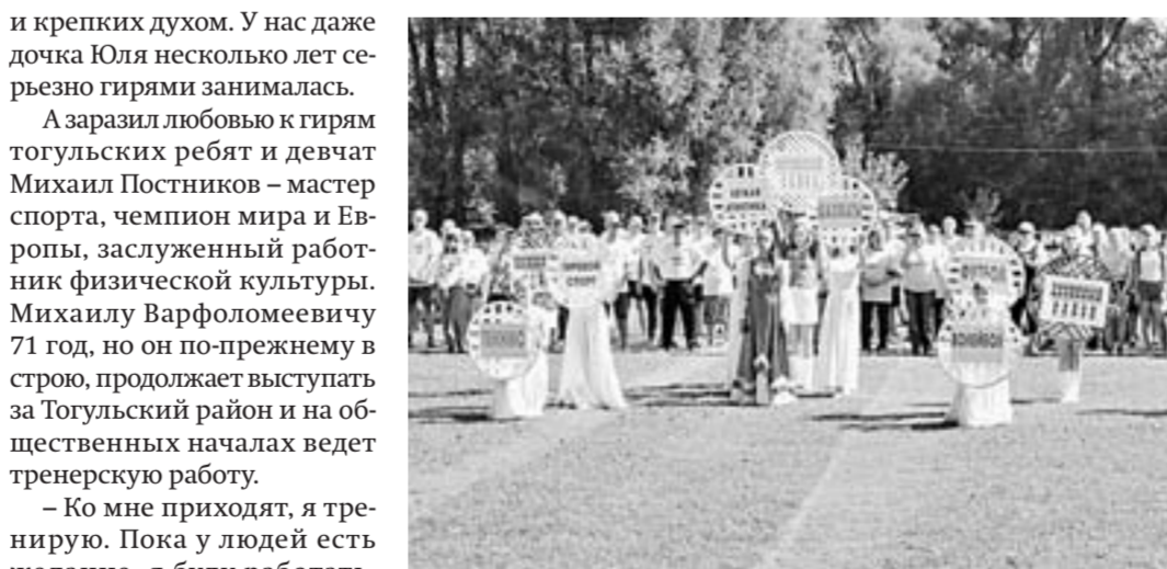
Торжественное открытие соревнований.