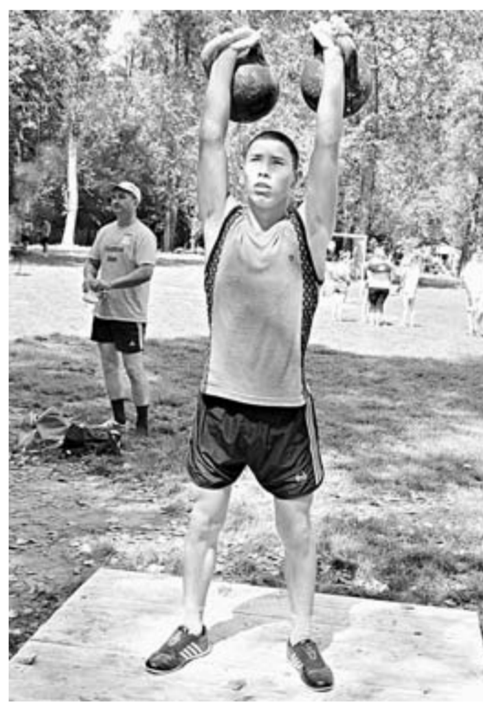
Гиря покоряется сильнейшим.

А вот кытмановские волейболистки были настроены очень серьезно и даже попро-