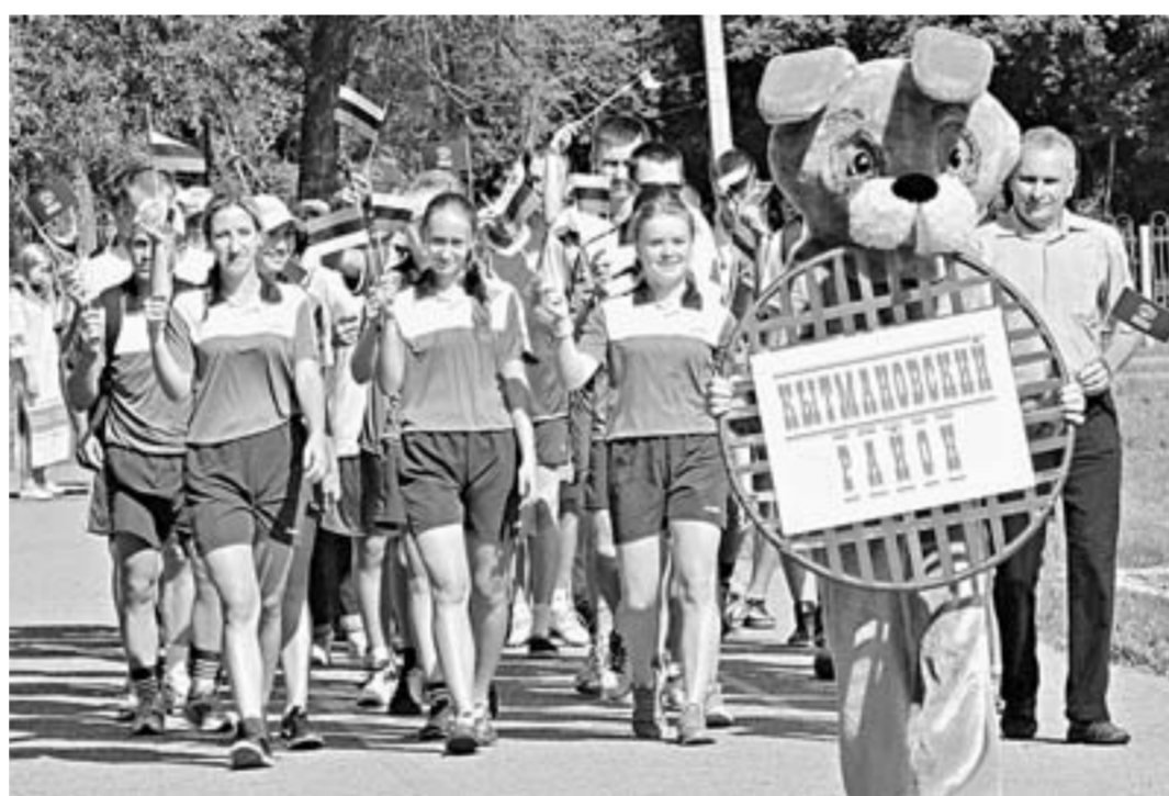
На олимпийской дорожке – хозяйка праздника.