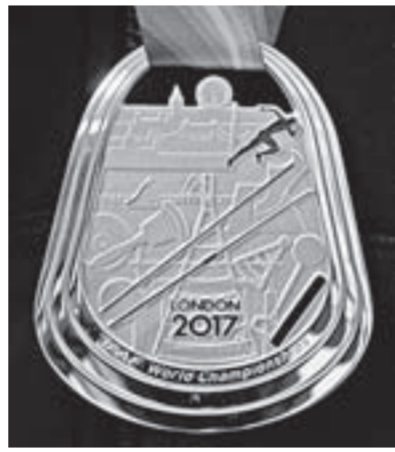
«Серебро» чемпионата мира – на Алтае.

психологический прессинг? Легко ли пережить ситуацию, напроочь перечеркивающую планы и мечты? В Лондоне Сергей Шубенков выступал под нейтральным флагом – не под российским триколором. Таково было условие участия сильнейшего барьериста России в ЧМ-2017. При этом уставший после долгого перелета, но счастливый и улыбающийся спортсмен признается: – У меня было абсолютное ощущение, что я бегу за Россию, только за