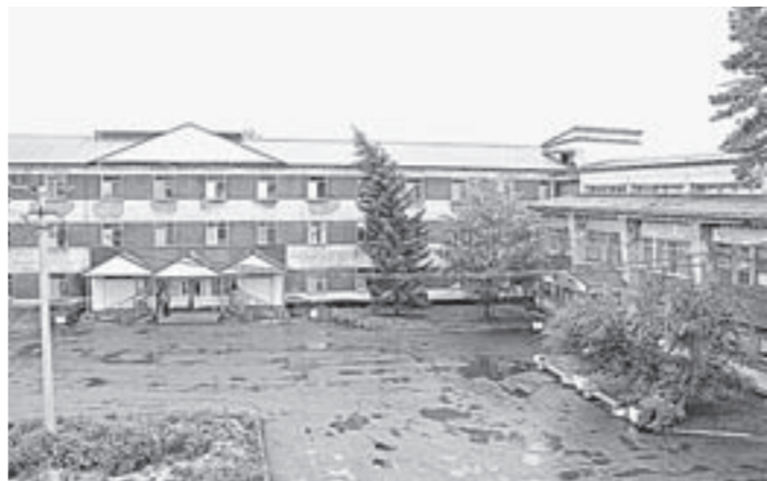
Теперь крыша Павловской больницы что надо, всем ветрам назло.