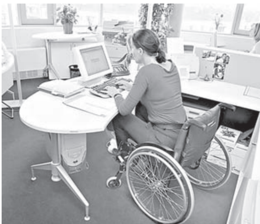
Трудоустройство инвалидов имеет множество аспектов.