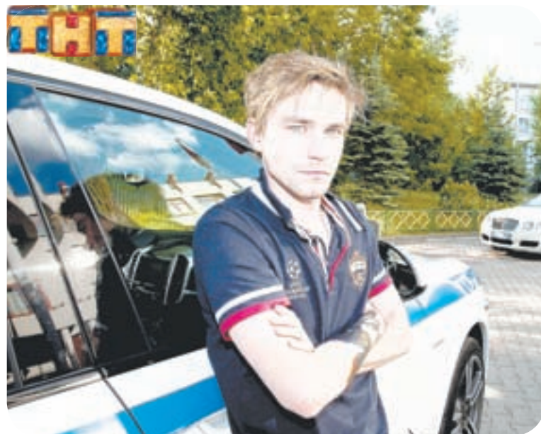
21.00 Т.с. «Полицейский с Рублёвки» (16+)

06.00, 06.25, 07.00, 07.25, 08.00, 08.25, 09.00, 09.25 Утренний канал (12+) 06.15, 06.50, 07.15, 07.50, 08.15, 08.50, 09.15, 09.50, 10.30, 13.30, 15.30, 17.30, 18.00, 22.00, 22.30, 23.00, 23.30, 00.00, 00.30, 01.00, 01.30, 02.00, 02.30, 03.00, 03.30, 04.00, 04.30, 05.00, 05.30 Новости (12+) 06.40, 07.40, 08.40, 09.40 Мультфильм (6+) 10.00, 13.00, 17.00, 20.30 Прямой эфир. Новости 10.15, 11.45, 12.15, 12.45, 13.15, 16.50, 17.15, 18.15, 18.45, 19.45, 22.20, 23.20, 23.50, 00.20, 01.20, 01.50, 02.20, 03.20, 03.50, 04.20, 05.20, 05.50 Интервью дня (12+) 10.45, 13.45, 15.45, 17.45 Спортивный клуб (12+) 11.00, 19.00 Т.с. «Последний янычар» (16+) 11.55, 15.20 Правила жизни. Дети (12+) 12.00, 12.30, 18.30, 20.00 Новости с субтитрами (12+) 14.00 Т.с. «Без свидетелей» (16+) 14.30 Ток-шоу о здоровье «Доктор И» (12+) 15.00 На первом плане. Барнаул (12+) 16.00 Д.д. Среда обитания (12+) 20.15 «Паркинг. Барнаул 22» (12+) 20.50, 00.50, 02.50, 04.50 Былое (12+) 21.00 Т.с. «Дом образцового содержания» (16+)