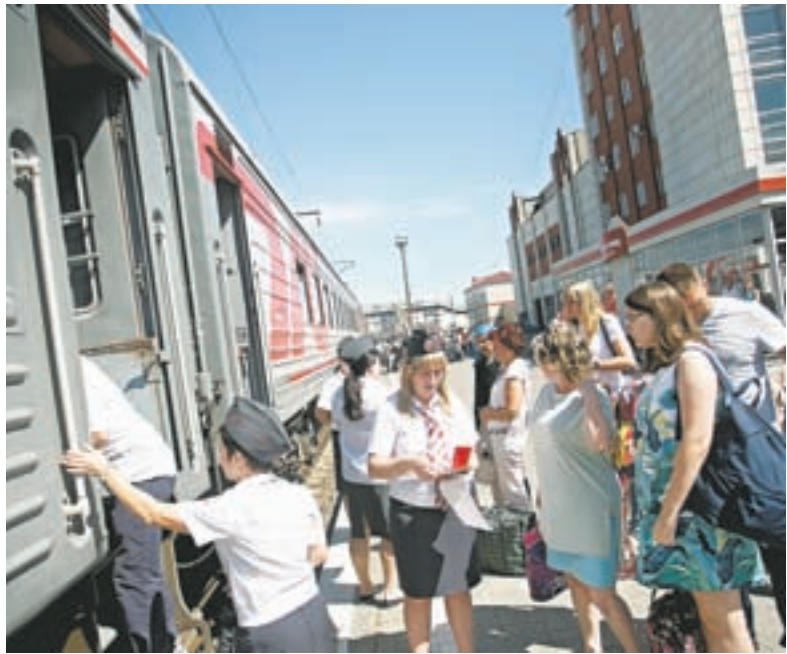
Барнаул – Адлер. Идет посадка.