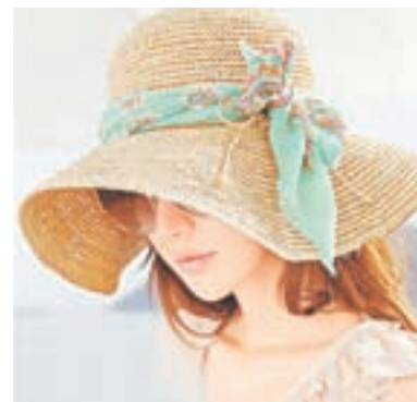
Выбор сделаем сами.

гриб? Тогда проследите, чтобы поля шляпки не оказались шире ваших плеч. Девушкам невысоким лучше взять головной убор с полями среднего размера.