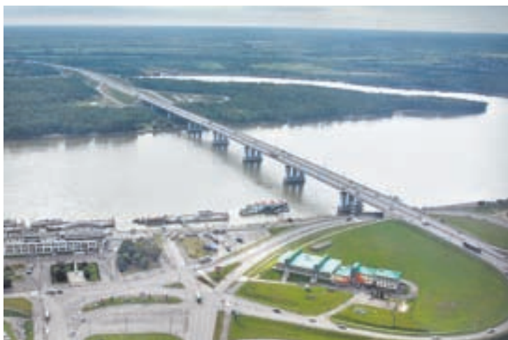
С высоты птичьего полёта.