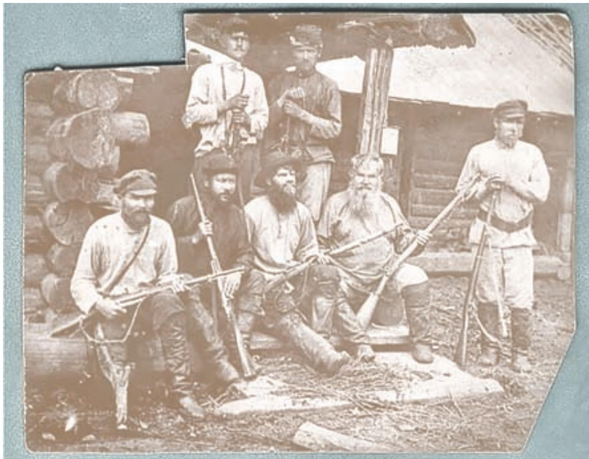
За мужицкую волю.