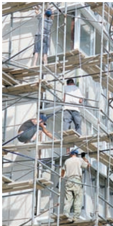
Фасад закрывают плиткой.

Что же тогда так взволновало дольщиков? В обращении инициативной группы в редакцию «АП» говорится: «Дольщиками приобретено и полностью оплачено 196