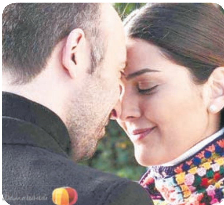
Региональные телепрограммы помечены знаком *

21.00 Т.с. «Ментовские войны» (16+) 23.10 Ты не поверишь! (16+) 23.55 «Экстрасенсы против детективов» (16+) 01.30 Т.с. «ППС» (16+) 03.20 «Лолита» (16+) 04.10 Т.с. «Преступление будет раскрыто» (16+)