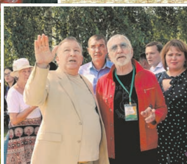
Фильм А. КАСПРИШИНА