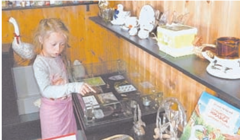
В день фестиваля вход в «Музей гуся» бесплатный.

Фестиваль проводится на Алтае уже в третий раз. В прошлом году