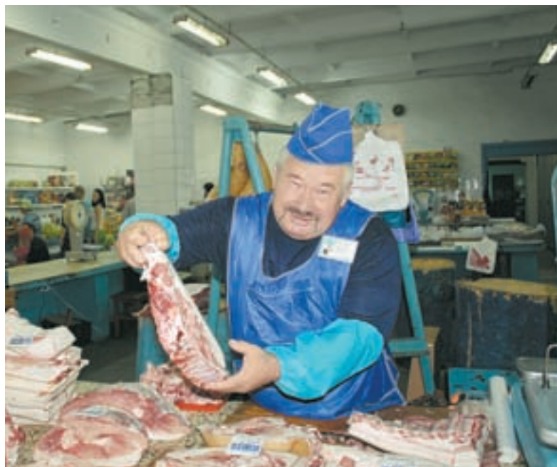
На тальменском рынке всегда есть выбор мяса.

«Мы работаем с местными фермерами, не задираем цены на наши блюда. С одной стороны, еда готовится из повседневных продуктов (суп из лисичек, рагу из кабачков), с другой – необычная подача: использование жидкого азота, можем принести кли-