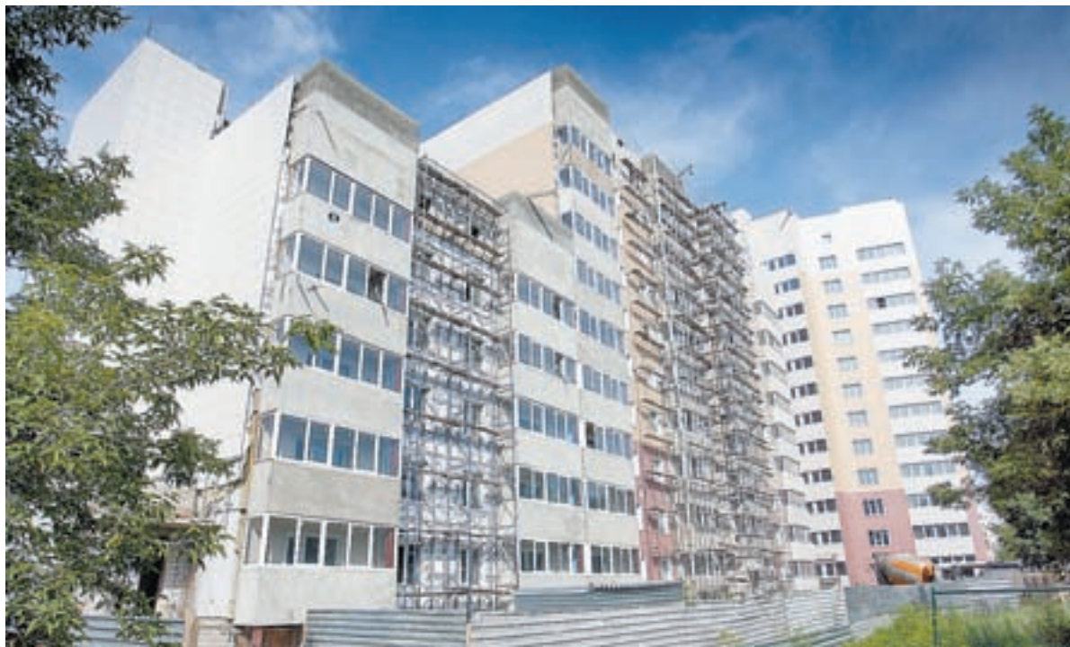
В доме сдано 5 из 8 блок-секций.

Жильцов дома на улице А. Петрова, 254 в Барнауле можно разделить на две группы. Счастливицки, которые живут в давно сданных квартирах, и тех, кто своей очереди еще ждет. Последние высказывают опасения, что квартиры, приобретенные в строящемся доме на условиях долевого строительства, так и не будут сданы. В ситуации разбирались корреспонденты «АП».