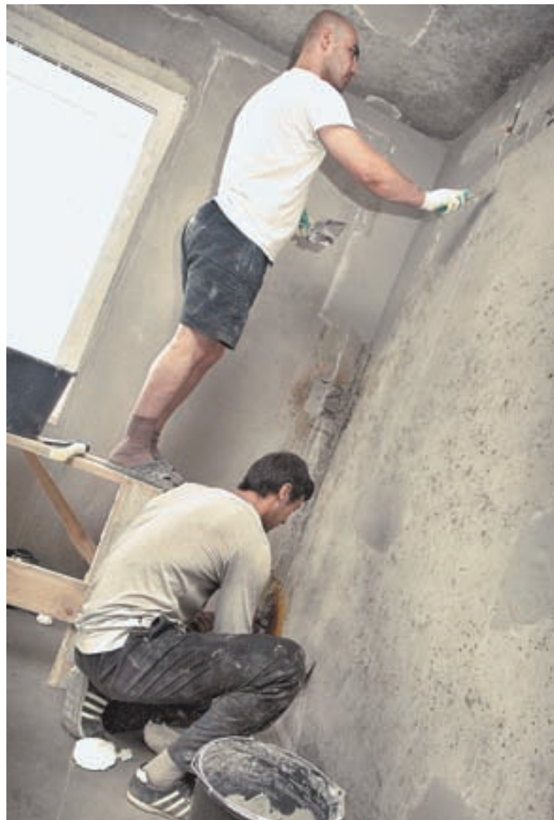
В квартирах ведутся отделочные работы.