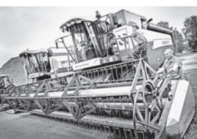
Хорошо практиковаться на современной технике.

Практико-ориентированное обучение в Первомайском не новость, как и тесное взаимодействие с работодателями. С птицефабрикой «Молодежная» филиал техникума (бывшее СПТУ № 13) сотрудничает еще с середины 2000-х. Предприятие не только крупнейший социальный партнер учебного заведения, но также база практики и работодатель для значительной части выпускников. А старший инженер сельхозпроизводства птицефабрики является председателем экзаменационной комиссии. Собственно, под птицеводческие предприятия