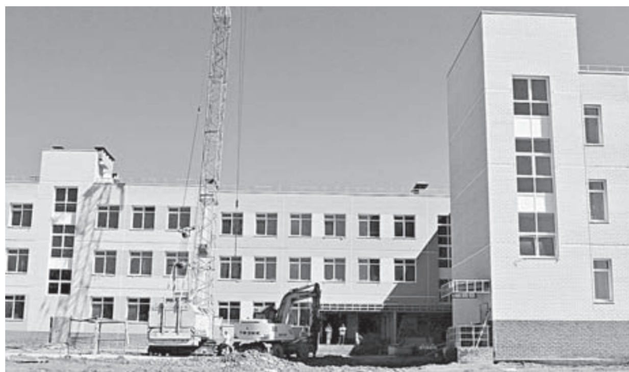
Совсем скоро школьный двор заполнят юные барнаульцы.

Строительство новой школы ведется в рамках программы «Со-