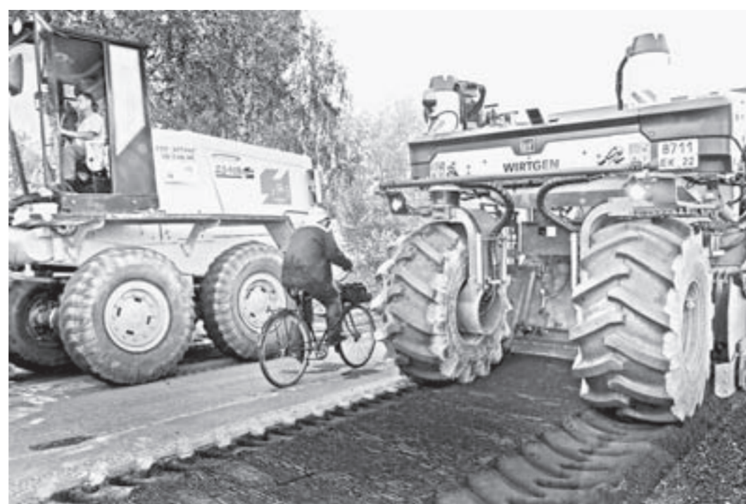
Работы идут, движение не прекращается.

11,5 километра автодорог отремонтируют в Первомайском районе. Работы ведутся по технологии холодного ресайклинга.