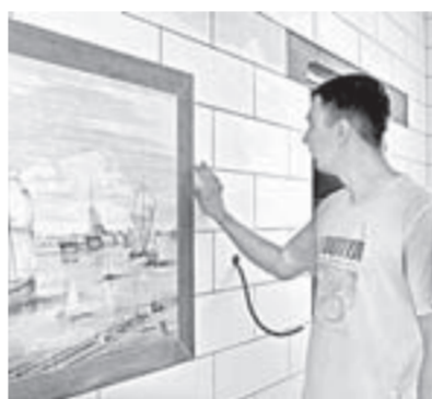
Внутренний интерьер также выглядит современно.