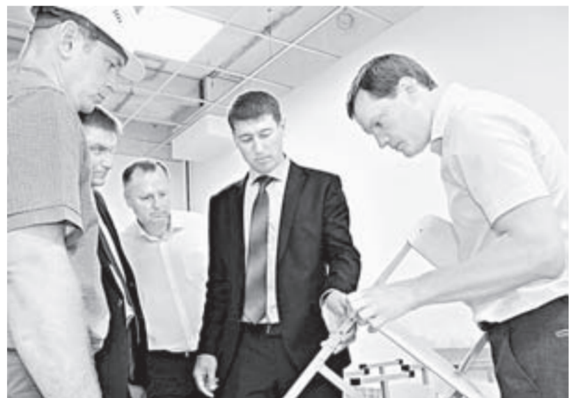
В деле образования не может быть мелочей.