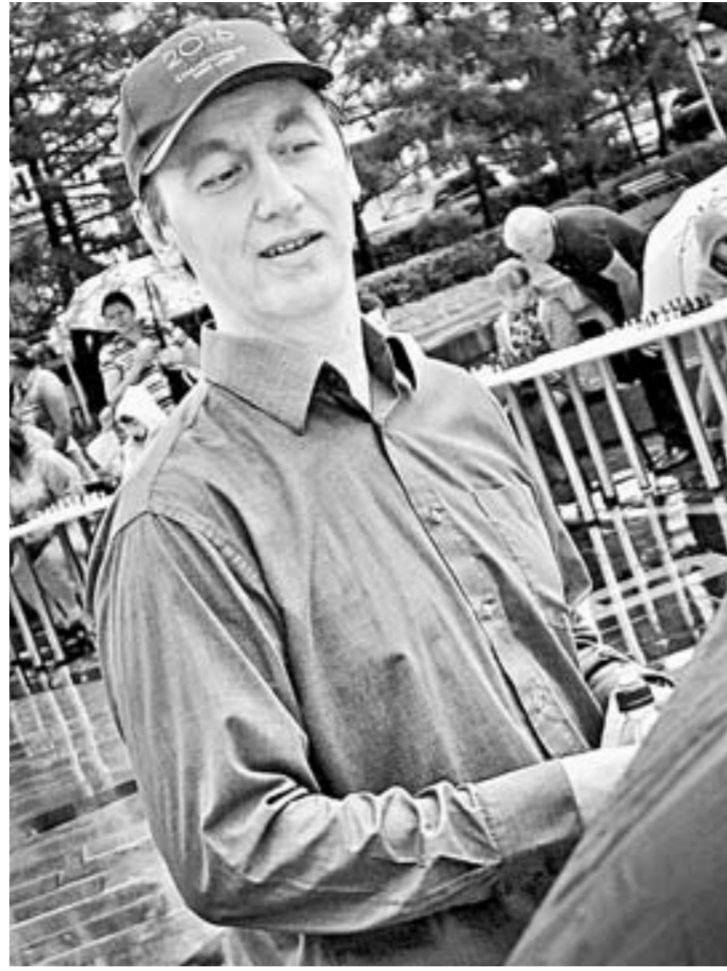
Вице-чемпион мира по шахматам Гага Камский пребывает в Барнауле в отличном настроении.