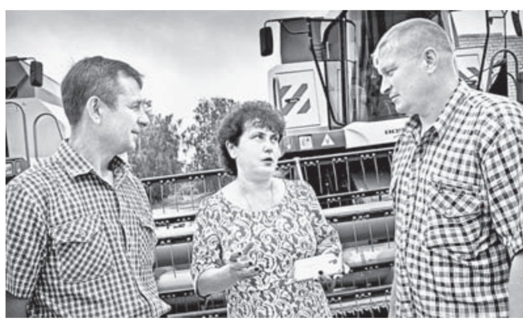
Сотрудники Алтайского транспортного техникума подтверждают: теперь их учащиеся практикуются на таком оборудовании, которое используется сельхозпредприятиями края.

– Требования к реализации новой специальности очень серьезные, и чтобы получить образовательную лицензию, мы должны были полностью укомплектоваться оборудованием, – говорит директор