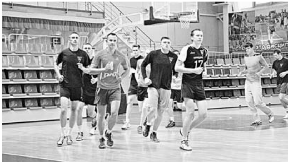
Волейболисты «Университета» на разминке.

Волейболисты барнаульского «Университета» вышли из отпуска и возобновили тренировки. Первые они собрались вместе 17 июля. Планировалось, что на первых сборах «универовцы» займутся общефизической подготовкой на стадионе «Лабиринт», но дожди внесли коррективы: 19 июля, когда мы заглянули на тренировку, парни из-за проливного дождя в спешном порядке перебазировались в зал спорткомплекса «Победа».