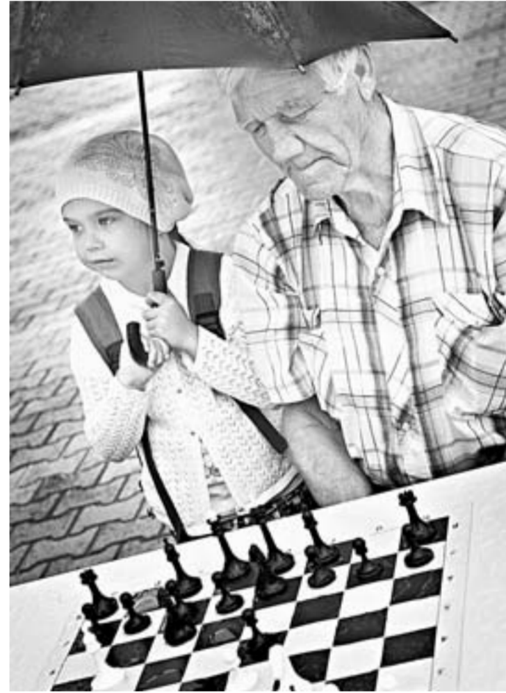
Скоро выглянет солнце и платье шахматной королевы подсохнет.