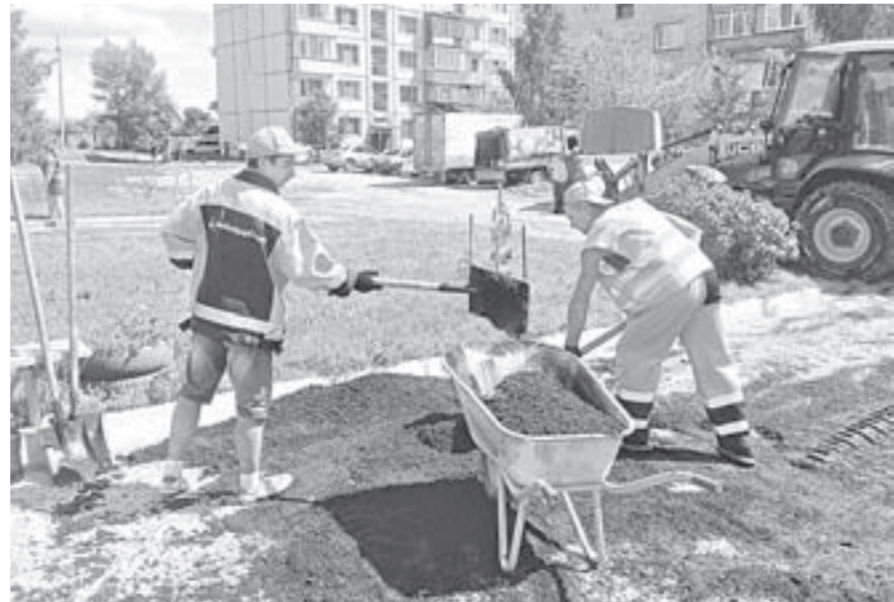
Сегодня работы ведутся полным ходом.

В Бийске завершился ремонт одной из дворовых территорий по программе, инициированной партией «Единая Россия». Счастливыми обладателями первого обновленного двора стали жители пятиэтажки на ул. Красильникова. Там силами компании «Бийскдорстрой» положено новое асфальтобетонное покрытие, установлены бордюры.