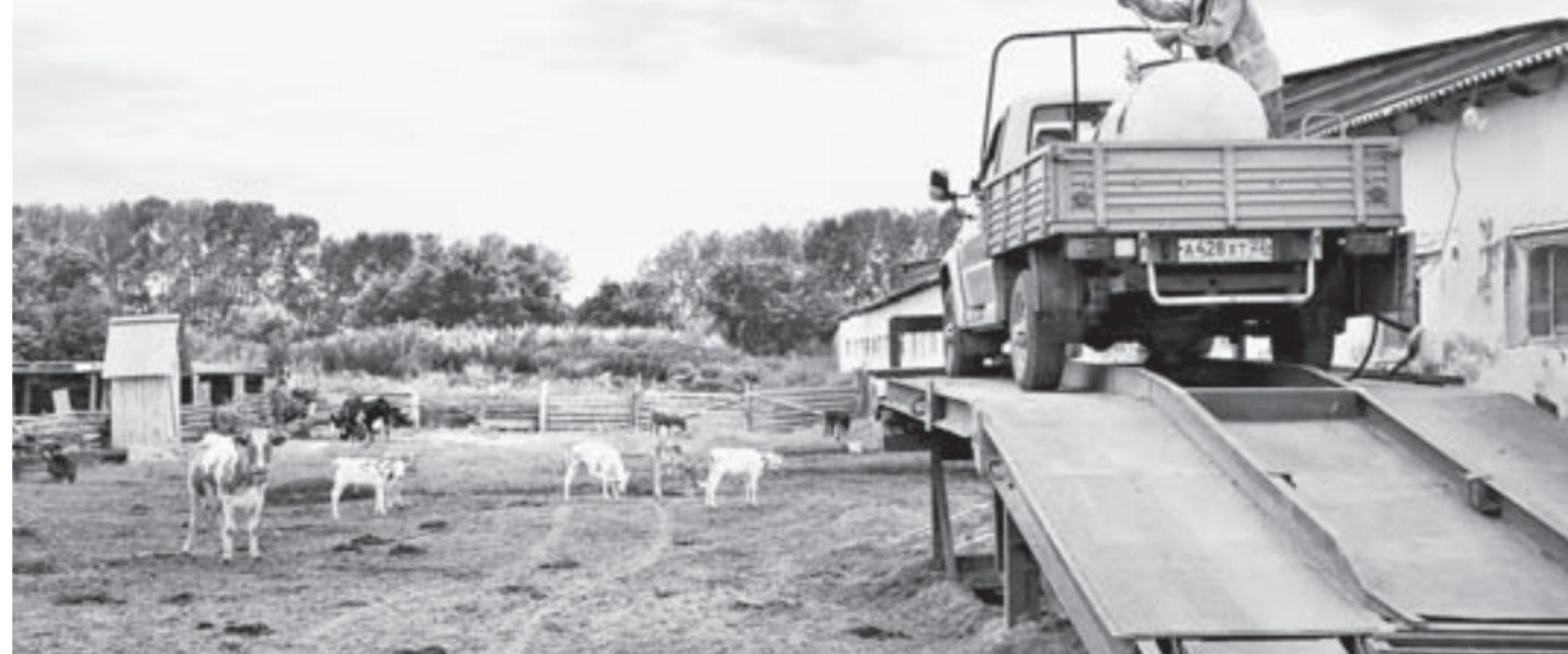
Доброе сено – хорошее молоко.