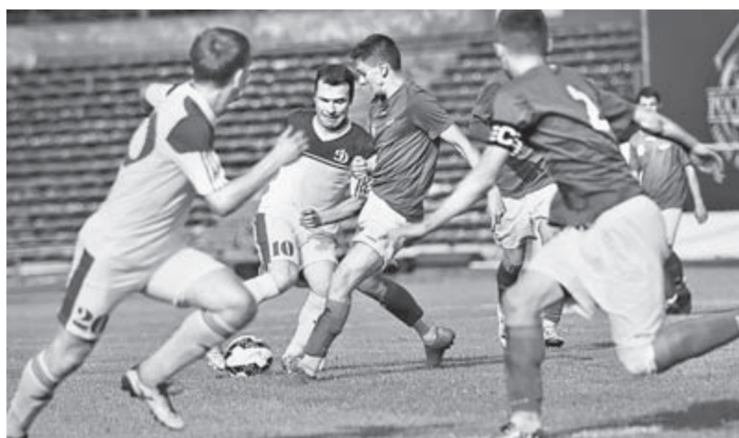
Первые проверки на прочность ворот.

Сейчас в клубе идёт процедура подписания контрактов с игроками. С большей частью футболистов они уже подписаны. Завлючное окно будет открыто до конца августа. Состав участников первенства России