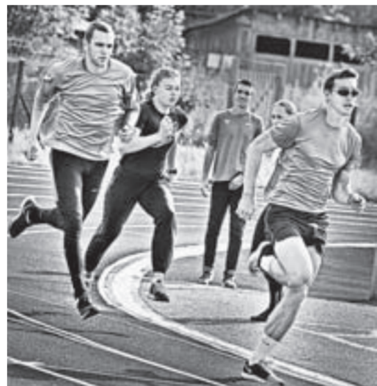
Гонка за лидером.