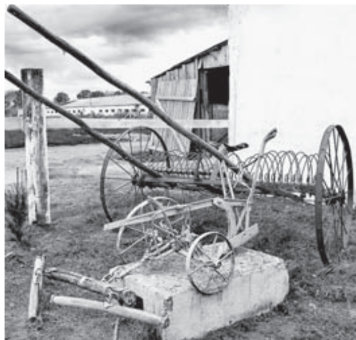
Начало семейному музею земледелия положено.