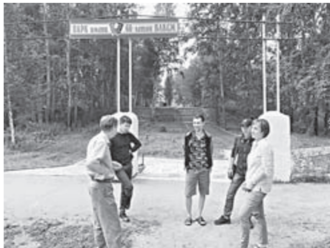
Городской парк Змеиногорска скоро обновится.

«Идея так понравилась людям, что горожане откликнулись на инициативу еще до начала основных работ. В Яровом, например, силами общественности был установлен памятный знак пограничникам и морякам, в мае посажены деревья, проведен субботник. Еще одну партию