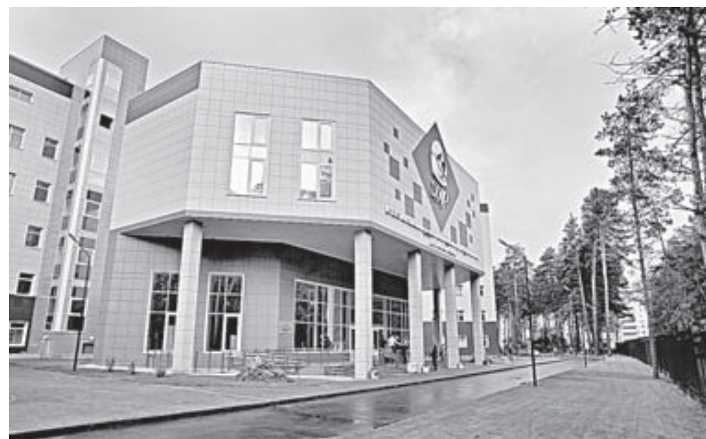
Перинатальный центр – сплав новейших достижений медицины и технологий.