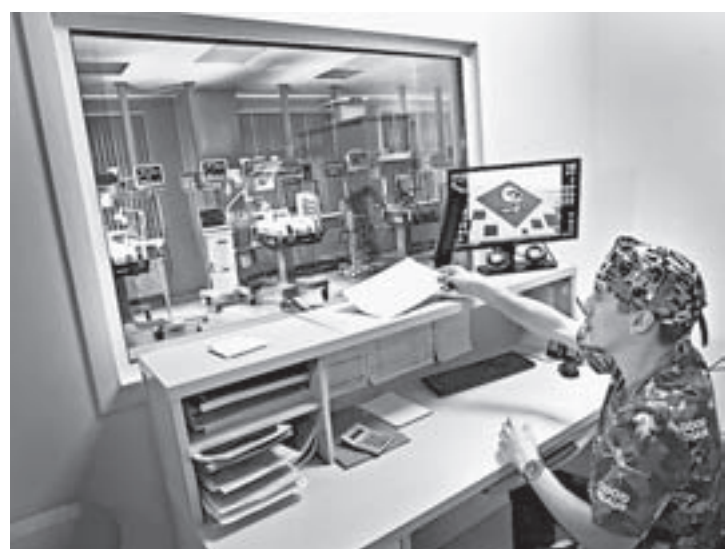
Там, за стеклом, в открытых реанимационных системах лежат недоношенные дети.

Глава региона отметил высокий уровень оснащенности перинатального центра современным оборудованием. Там оптимальное сочетание отечественной и импортной медицинской техники. — Зарубежные образцы присутствуют только в тех случаях, если у нас в стране аналогов пока не производят, — пояснил