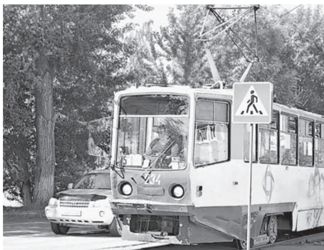
Выход — в субсидировании части затрат на перевозку.

Что касается трамвайного парка сегодня, то в отличие от Барнаула, где ставку сделали на чешского производителя трамваев «Татра», в Бийске основа подвижного состава представляется советскими и российскими вагонами КТМ: КТМ-5МЗ (71-605), более новой модификации КТМ-5А, а также приобретенными в 1990 годах — 71-608К и 71-608КМ (до