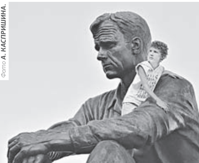
Программа праздника будет очень насыщенной.

названа также выставка-продажа книг под брендом «Издано на Алтае», там будут представлены издания об уроженцах Алтайского края и книги наших современников. А в мемориальном музее-заповеднике В.М. Шукшина откроется выставка известного в крае фотохудожника Александра Волобуева «Кислород Пикета», на которой можно будет увидеть снимки, сделанные на родине Шукшина в разные годы.